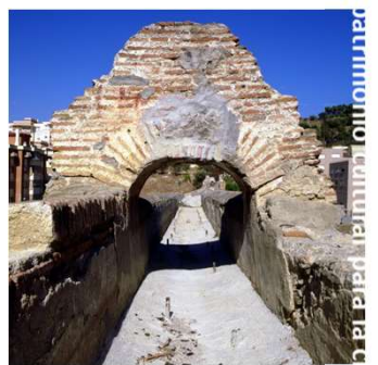
patrimonio cultural para la

programas de actividades destinadas a la formación de los ciudadanos