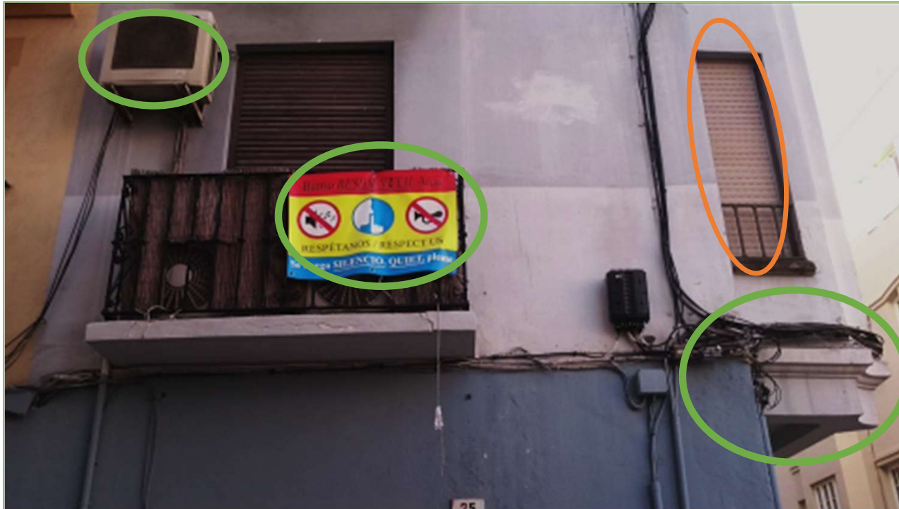
Análisis concepción holística del patrimonio cultural en fachada histórica de valor tipológico en el Conjunto Histórico de Málaga [16/06/2019] Elaboración propia-