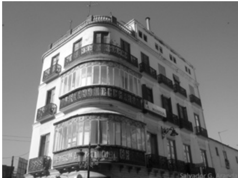
Fig. 4: Cierres característicos de la arquitectura doméstica malagueña. 2008.