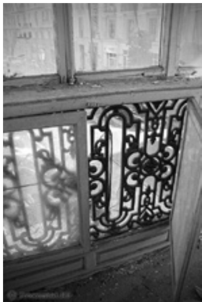
Fig. 3: Detalle de los antepechos de fundición.