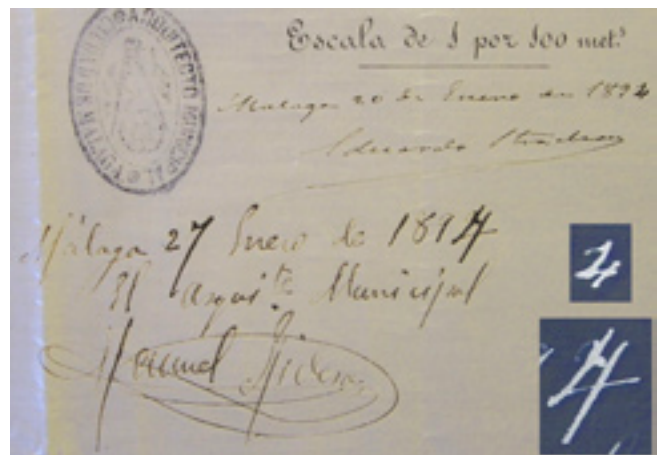
Figs. 14: Firmas de Strachan y Rivera, en las que se observa la fecha de 1892 bajo de la 1894. A.M.M..