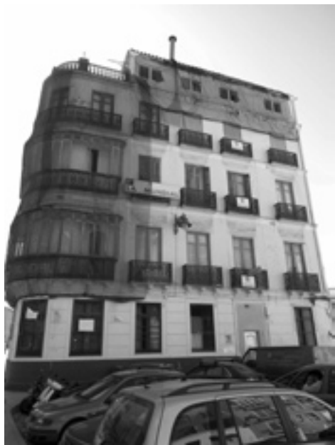
Fig. 1: Fachada principal al Hoyo de Esparteros. Mayo de 2010.