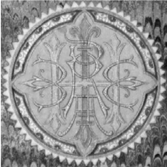
Fig. 10: Ex libris con el anagrama RH de Ricardo Heredia, curiosamente con los colores verde y morado de la bandera de Málaga. "¡Gades Constitución", Diego Mallén , 12 de junio de 2009, en http://diegomallen.blogspot.com/2009/06/gades-constitucion.html

claras las razones que impulsaron a Ricardo Heredia a tal necesidad, según Benjumea Heredia fue al no ocuparse de negocio alguno "por lo que se le presentó la ruina sin darse cuenta", aunque Gil Serra habla de "una tradición oral según la cual el conde se jugó una noche su biblioteca y la perdió" 47 , hipótesis que toma de Mendoza Díaz-Maroto quien la considera posible: