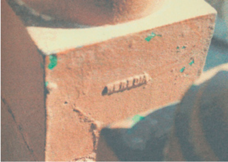
Fig. 15: Sello de la fundición de Heredia en la base de los balaustres de la azotea.