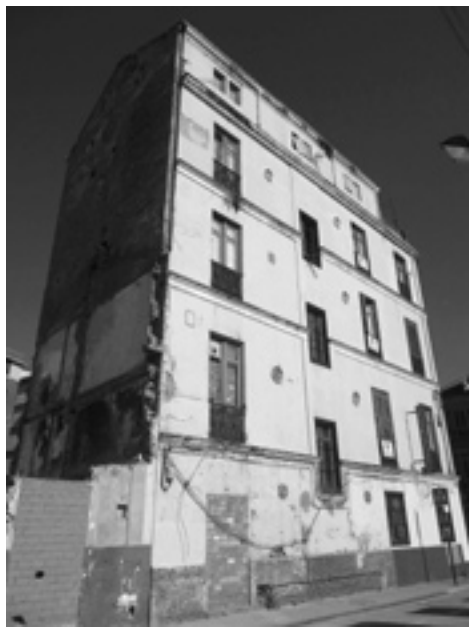
Fig. 2: Fachada trasera al Pasillo de Atocha. Mayo de 2010.

debido al gran cartel de neón que en uno de sus balcones aún se dispone, antiguo anuncio de la pensión que albergó hace años, una de las últimas funciones que se desarrollaron entre sus muros.