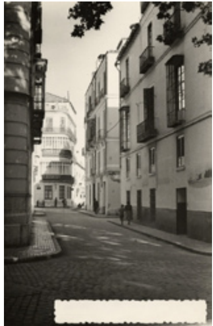
Figs. 11-12: Pasillo de Atocha y Hoyo de Esparteros desde la Alameda a través de calle Ordóñez. Décadas de 1950 y 1940 respectivamente. A.M.M..