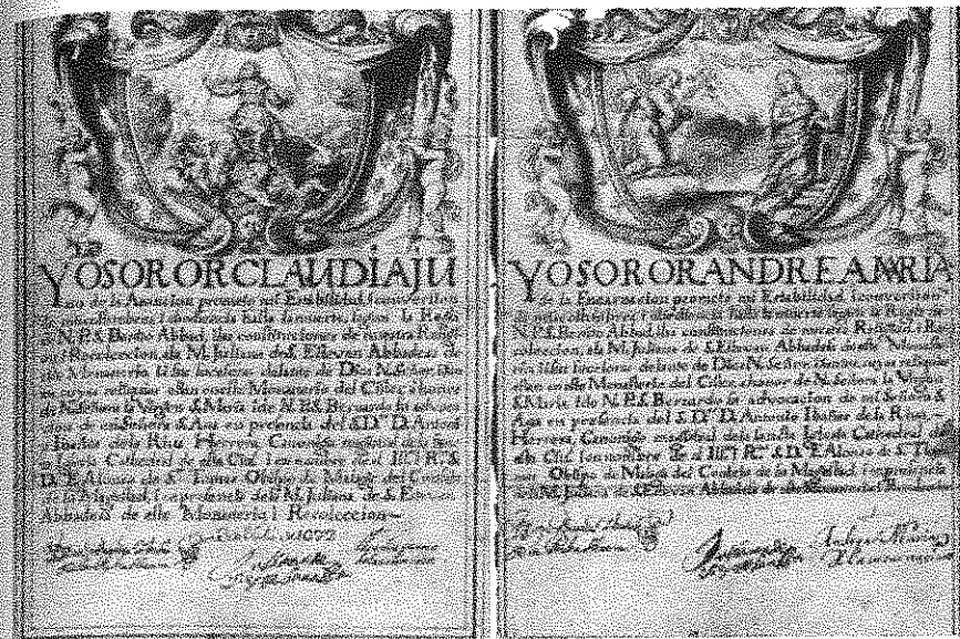
Fig. 4: Andrea de Mena [atribución], Cartas de profesión (1672). Archivo Histórico Municipal de Málaga. Fondo documental de la abadía cisterciense de Santa Ana.

Artísticamente, estos documentos se asemejan a proyectos arquitectónicos lignarios que enmarcan el texto que promete la Regla, significando una inapreciable fuente para el estudio de los motivos ornamentales y su evolución en los Siglos de Oro. Por lo general, muestran ricas e imaginativas ornamentaciones pintadas a base de grecas florales y geométricas, cartelas y espectaculares portadas dibujadas a modo de altares, frontispicios y retablos. También incorporan una iconografía alusiva al nombre de religión de la profesa,