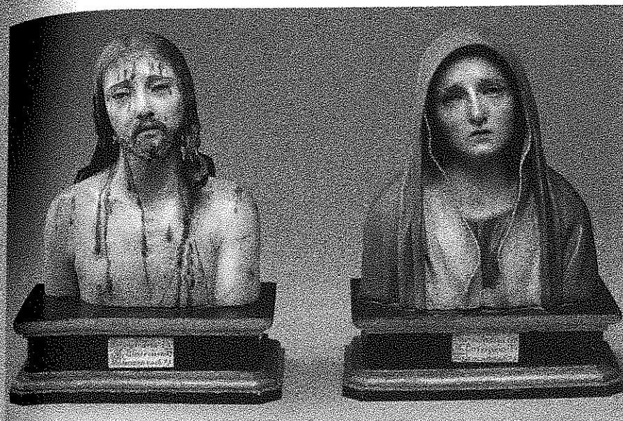
Fig. 5: Andrea de Mena, Ecce-Homo y Virgen Dolorosa (1675). The Hispanic Society of America (Nueva York).