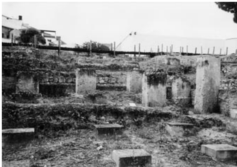
FIG. 2. Detalle de los pilares y ábside que ocupan la zona inferior del cerro.