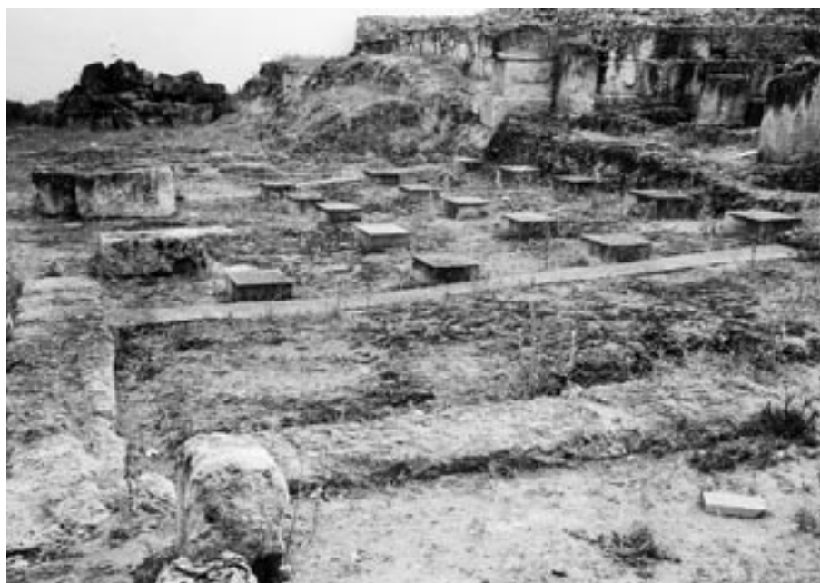
FIG. 3. Vista lateral con la posible restitución de esta área.