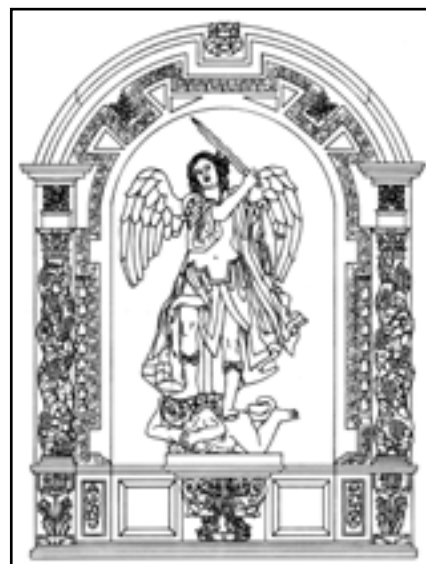
Fig. 5: Reconstrucción estructural e iconográfica del retablo de San Miguel de la catedral de Tui. Dibujo de Roberto Novo Sánchez (www.novodesenho.net).

un esbelto mancebo de cabello ensortijado, con las alas desplegadas y vistiendo a modo de centurión romano, con túnica, manto, botas y coraza, tal como aconseja Pacheco 19 . Con el brazo izquierdo sujeta un escudo circular y con la mano derecha alza una espada flamígera con la que reta y somete a un horrendo dragón antropomorfo, símbolo de Lucifer, al que humilla bajo sus pies y precipita hacia las llamas infernales (Fig. 3). Como queda dicho, en el seiscientos se potencia el culto al San Miguel victoriosus en el marco de la propaganda católica, puesto que, como sostiene Sebastián, ejemplifica a la perfección la contienda alegórica entre la Roma papal y el desafío luterano 20 , del mismo modo que en la Edad Media se había puesto al servicio de la cruzada 21 . Buena muestra de la repercusión alcanzada por el mensajero divino en el recinto catedralicio durante el Barroco son las otras dos representaciones del mismo como pesador de almas, en uno de los respaldos de la sillería coral, y de nuevo como guerrero celestial en un cuarterón de la puerta occidental.