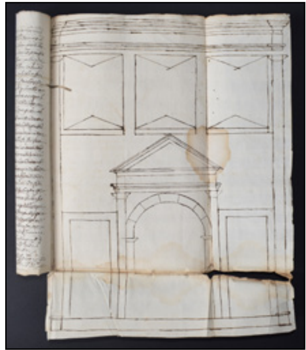
Fig. 1: Gonçalo Barbosa. Traza del trascoro de la catedral de Tui, 1630. Archivo Catedralicio, Tui.

Dicho altar de San Miguel, dedicado también a la Virgen de la Soledad, contaba con una imagen del arcángel, pero desconocemos si poseía retablo antes de la reforma o se fabrica tras la misma 3 . Sea como fuere, tras algo más de medio siglo, la Fábrica decide amueblar este espacio. Esta empresa capitular consiste en una sencilla mazonería barroca y una nueva figura del alado. Aquí tendría su sede la cofradía de San Miguel, documentada en 1510 y 1511, aunque no hay evidencia alguna de su existencia en el momento de la ejecución del nuevo retablo 4 . En el sínodo de 1482 se da al alado un papel relevante como protector de la Iglesia de Tui, junto con San Agustín y Santa Catalina de Siena, y se manda celebrar la fiesta de la Apparitio Sancti Michaelis 5 . En ella se conmemora la lucha de las tropas angélicas, comandadas por San Miguel, contra la caterva liderada por Lucifer. La conmemoración de esta advocación se confirma en todos los cónclaves locales del quinientos y el seiscientos, desde el de Diego de Avellaneda de 1526 6 hasta el de Pedro de Herrera de 1627 7 . En el Breviario tudense, mandado publicar por el mitrado Juan de San Millán en 1564, figura a 8 de mayo 8 . El obispo Miguel Ferrer, de acuerdo con su testamento del 9 de abril de 1659, funda un aniversario en honor a su santo homónimo, con 600 ducados de principal 9 . No hay que desechar la idea