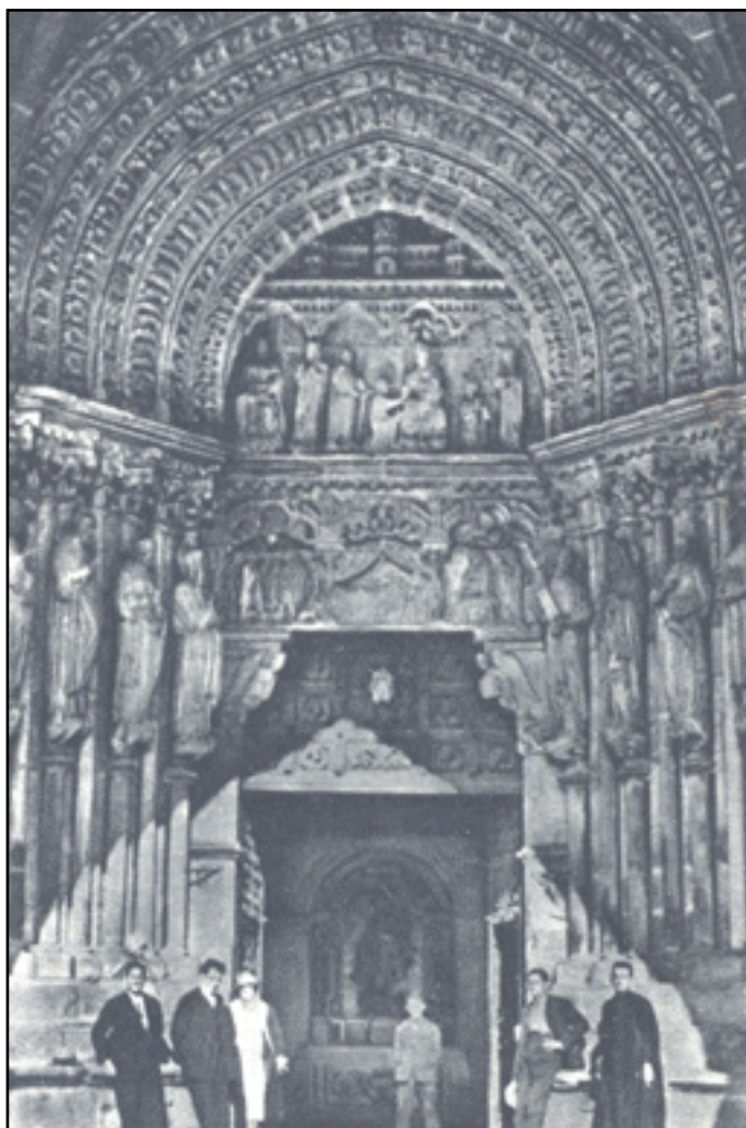
Fig. 4: Las bellezas de Galicia. España turística y monumental. Serie 40. Nº 1. Vista del retablo del trascoro de la catedral de Tui. Antes de 1962.

San Miguel se efigia aquí como princeps militiae caelestis , en calidad de ejecutor de la justicia divina, liderando una pugna aérea contra los ángeles rebeldes hasta su expulsión del Paraíso. Concuerda con el tipo iconográfico que, prácticamente invariable desde la Edad Media, será utilizado como metáfora de la lucha de la Iglesia postridentina contra el demonio reformista 15 . Esta imagen tiene como referente textual la lucha de la tropa angélica frente a la bestia infernal en defensa de la Mujer apocalíptica 16 . Según la teoría de Mâle, secundada por Réau, este San Miguel combatiente contra Satanás hunde sus raíces en la Europa altomedieval, concretamente en el santuario italiano de San Miguel de Monte Sant'Angelo, exportándose más tarde a Francia al Mont-Saint-Michel y al arte carolingio 17 . Lo que más cambia en la Edad Moderna con respecto al modelo de tiempos pasados es la humanización del ángel caído, que se aleja de su aspecto animalizado 18 . Se trata de