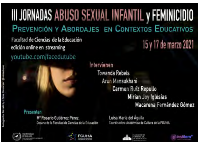
Figura 4. Cartel de las III Jornadas sobre Abuso Sexual y Femicidio. Prevención y abordaje en contextos educativos (2021), a partir de la obra Für Mich , de Sina Niemeyer.

Todo esto nos lleva a una búsqueda de nuevos equilibrios que nos permita avanzar en la difusión sin perder la calidez que da el encuentro directo entre seres humanos.