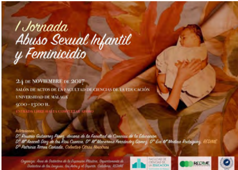
Figura 1. Cartel de la I Jornada Abuso Sexual y Femicidio (2017), a partir de la obra Ensayo sobre la Identidad , de Mayra Martell (2010).

que viajaron desde diferentes puntos del país. A través de las ponencias y el posterior intercambio entre especialistas, alumnado y profesorado asistente, el encuentro quebró el silencio con el que víctimas y abusadores ocultan los abusos saliendo a la luz micro y macrorrealidades en sus auténticas dimensiones; se mostraron estrategias para la prevención y se conocieron recursos para afrontar los ASI de forma correcta sabiendo que, mientras un buen abordaje minimiza las consecuencias de un abuso, no intervenir o hacerlo de forma inadecuada implica que los daños, que afectan a todas las parcelas de la vida, puedan perpetuarse.