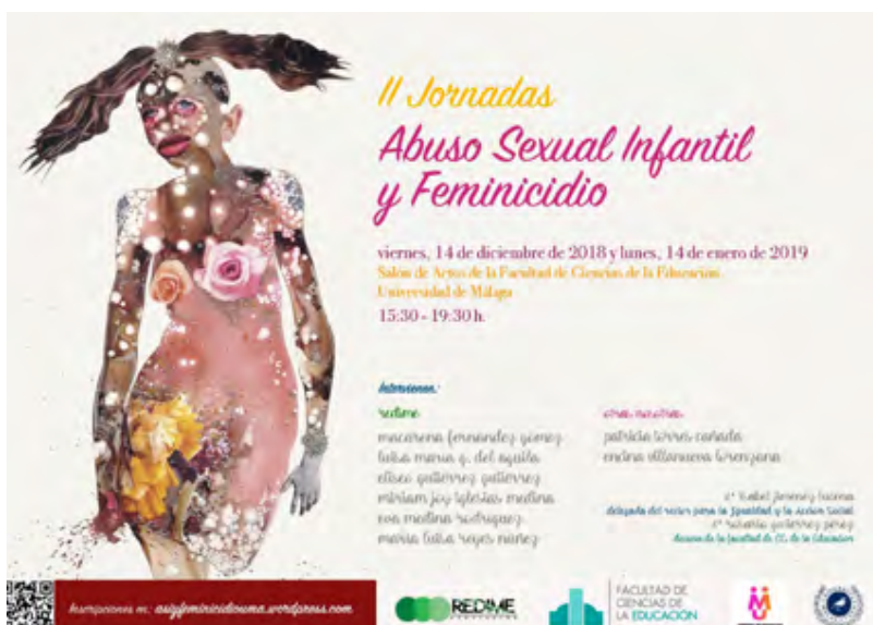
Figura 2. Cartel de las II Jornadas Abuso Sexual y Feminicidio (2018-2019), creación propia a partir de la obra All Rosey , de Wangechi Motu (2003).

Tras la repercusión de la primera jornada, era evidente la necesidad de poner en marcha las segundas, que se realizaron en el curso 2018/2019. La ampliación del equipo de trabajo nos permitió incrementar su duración; además, se desplazaron a horario de tarde para facilitar la asistencia de las y los estudiantes del grado de Educación Social, una titulación especialmente implicada en temas transversales y actividades extracurriculares. En esta edición, además de con la ayuda económica de la Unidad de Igualdad de nuestra universidad, contamos con una aportación del Departamento de Didáctica y Organización Escolar y de la propia Facultad de Ciencias de la Educación y, tras la evaluación de la primera edición, mantuvimos parte de sus objetivos, perfilamos otros y añadimos alguno, quedando en conjunto tal y como se indica a continuación.