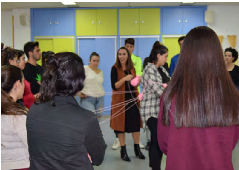
Figura 3. Desarrollo del taller ¿Quién dijo qué? De(Re)construcción social de escenarios , durante la primera sesión de las II Jornadas sobre ASI yFeminicidio.

Por último cabe añadir que, aunque en este momento ya era frecuente grabar las actividades complementarias, nuestro equipo mantuvo la decisión de no hacerlo, consciente de que, a menudo, no sucede lo mismo delante que detrás de una cámara.