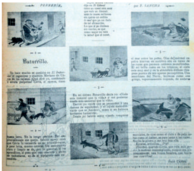
Fig. 1. Madrid Cómico , n.º 40, 5/10/1901, p. 321. Perrería .

1892) en Málaga y de León Bonnat (1833-1922) en París. Los dos familiares habían cultivado el arte de la caricatura, José María en trabajos de carácter privado y Horacio utilizando el afilado lápiz con algunos de sus colegas o con su crítica mordaz a ciertas lacras, además de la colaboración gráfica en la prensa gaditana; el hermano mayor de Tomás, Francisco Sancha, ha sido posiblemente el dibujante de prensa más conocido y valorado en la última década del siglo XIX y primer tercio del siglo XX –Rubén Darío, en su primigenia labor de articulista, describe a Francisco como una figura destacada de la ilustración española en 1899.