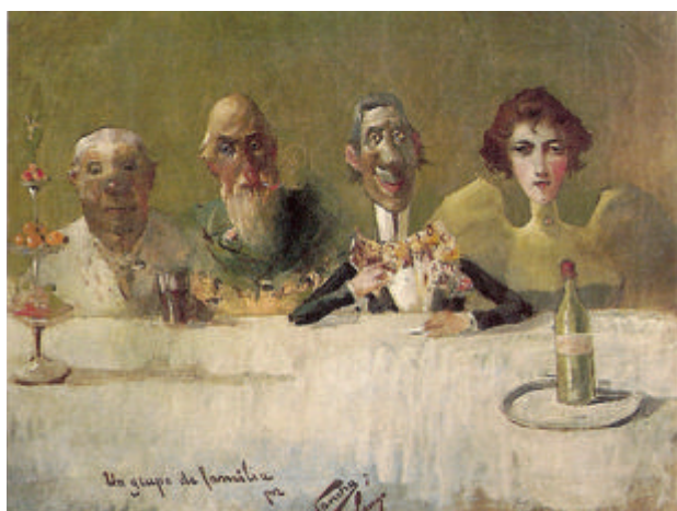
Fig. 2. Un grupo de familia . Óleo sobre lienzo, 43,2 x 56,5 cm, Col. Fundación Unicaja

La muerte prematura e inesperada del cabeza de familia en Vigo, a la edad de cincuenta y dos años, condi-