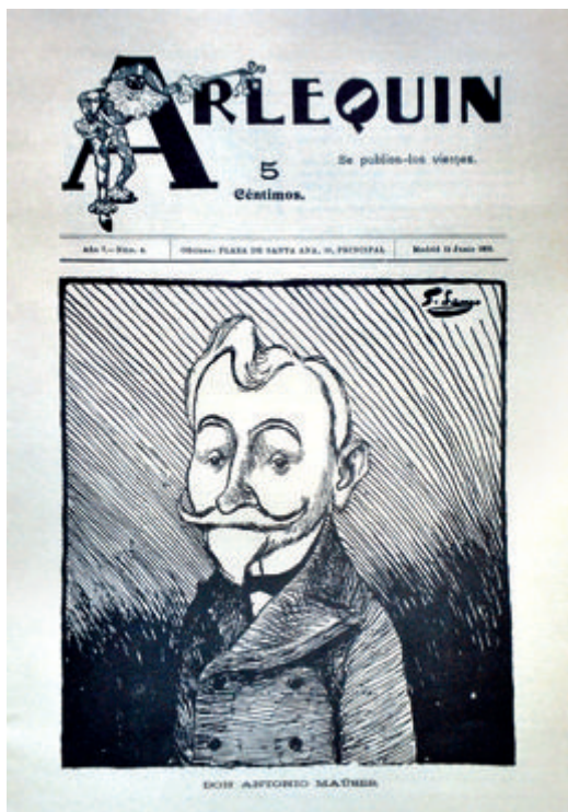
Figura 5: Arlequín , n.º 4, 12/6/1903, Don Antonio Maïser. Facsímil FPMCN

y t mpera sobre papel de 64 x 49 cm. que puede ser observado en la Real Academia de Bellas Artes de San Fernando de Madrid, apreciando el trabajo de las sucesivas aguadas y las veladuras de color, aunque como se puede notar aqu  y a lo largo de su carrera en Tom s domina m s el gusto por la narraci n y la composici n.