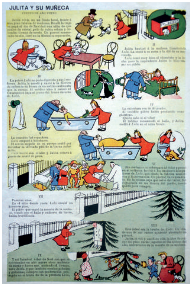
Figura 12. Blanco y Negro , n.º 714, 7/1/1905, p. 16. Julita y su muñeca . Col. BASL

narrativa, en apoyo de un texto denso (fig. 12). El dibujo es rápido y ágil, adaptado a una supuesta narración infantil que suele ser una historia truculenta o surrealista, a veces de ambiente exótico, con moraleja final en un sinsentido hilarante. No sólo recoge aquí Tomás el testigo de Joaquín Xaudaró (1872-1933) o de Atiza, sino que lo cede a las siguientes generaciones (fig. 13) (fig. 14) con el encargo de su desarrollo narrativo y la creación de la historieta gráfica.