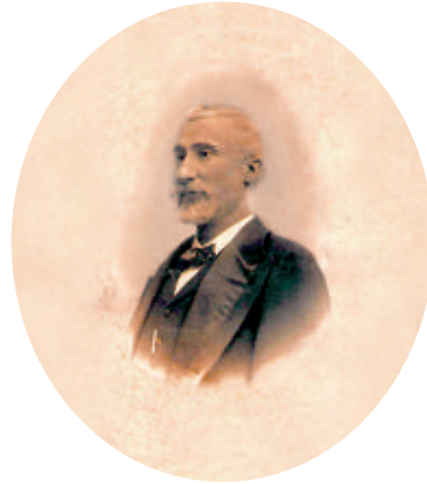
Figura 6. Antonio Maura Montaner. Documento fotográfico A-3.

En junio de 1903 comenzará su colaboración con la revista La Fotografía , dirigida por Antonio Cánovas del Castillo y Vallejo, sobrino del famoso político y unido estrechamente a Málaga desde sus años de Gobernador Civil de la provincia. Este polifacético personaje –abogado, político, dibujante, pintor, escritor y finalmente fotógrafo– ganó el primer concurso de fotografía convocado por La Ilustración Española y Americana en 1899, fundando en 1904 el estudio fotográfico Kaulak (uno de sus varios pseudónimos). Lengo dibujará la sección titulada Nota Cómica , siempre centrada en el mundo de la foto-