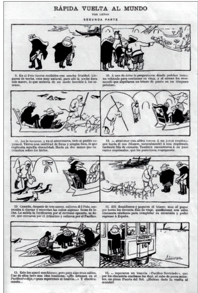
Figura 14. Blanco y Negro, n.º 726, 1/4/1905, p. 9. Rápida vuelta al mundo 2ª parte.