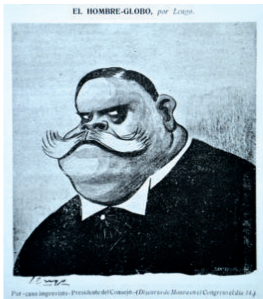
Figura 8. Alma Española , n.º 19, 20/3/1904, p.11. El hombre-globo .

año-, con una sección titulada Nuestros aficionados , desapareciendo la anterior. Sólo volverá a ella 9 meses más tarde, con un último dibujo. En sus apuntes sobre artistas malagueños, Cánovas –también llamado Vascano o Dalton Kaulak – se olvidará de Lengo, cuestión normal si atendemos a su poca valoración del arte de la caricatura.