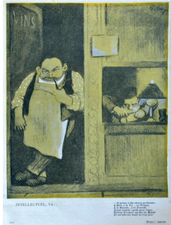
Fig. 3. L'Assiette au Beurre , n.º 120, 18/7/1903, p. 2017. Col. BASL

Tras la prensa española, el siguiente año lo ocupará con publicaciones francesas, donde va a alcanzar un cierto reconocimiento. Un cuadro de esa época es Un grupo de familia , un óleo sobre lienzo de modestas dimensiones (43,2 x 56,5 cm), firmado Sancha y Lengo , donde el autor retrata una serie de cuatro personajes tras una mesa, junto a una botella, copa, vaso y frutero, donde se percibe la ridiculez de un ambiente burgués en los rostros caricaturizados de los personajes. Es imposible no pensar en maestros como James Ensor (1860-1949) al contemplar esta escena de referencias realistas en un estilo caricaturescamente sombrío, con una especial dedicación a los personajes (fig.2).