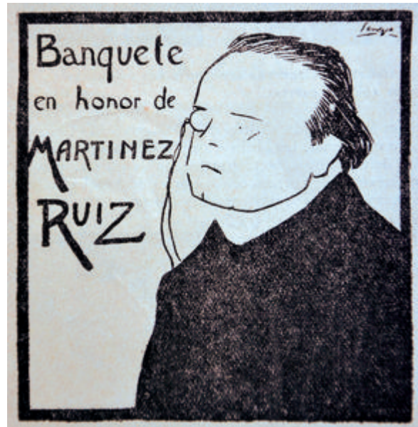
Figura 11. ABC , n.º 108, 12/5/1904, p. 8.

española, cabecera de la revista. Directores de periódicos: José Ortega Munilla es un ejemplo de una de las maneras de hacer de Lengo, sintética y límpida, como Directores de periódicos: Miguel Moya , la última portada de la revista (fig. 10). En el último número del semanario, en este caso el más amplio en colaboraciones del artista, Lengo continúa las directrices anticlericales de la revista y se sitúa muy cerca de Darío de Regoyos Valdés (1853-1913) y sus grabados para España Negra junto a Émile Verhaeren. Su firma se ha asentado definitivamente, con un gran talento para captar la realidad y darle una apariencia gráfica cercana al diseño más moderno, pero Alma Española acaba su aventura editorial.