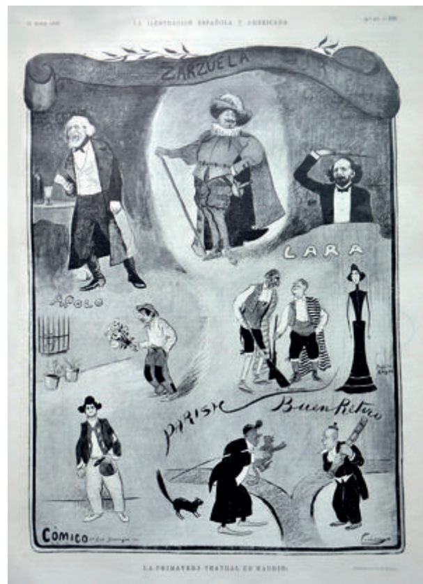
Fig. 4. La Ilustración Española y Americana , n.º 15, 22/4/1903, p. 253. La primavera teatral en Madrid .

No será hasta 1903 cuando se contemple de nuevo en España el trabajo de Tomás, casi simultáneamente a sus mayores éxitos en Francia con sus colaboraciones para L'Assiette au Beurre (fig. 3). En La Ilustración Española y Americana firma la página titulada La primavera teatral en Madrid . La longeva publicación (1869-1921), continuadora de El Museo Universal (1857-1869), cimentó su notorio éxito de público en la calidad de sus firmas, resaltadas por una edición impecable que se beneficiaba además del gran formato de sus páginas (40 x 28 cm.). En la ilustración de Tomás se trata de exponer gráficamente los hitos de la temporada teatral en Madrid, aportando nombres de teatros (Apolo / Lara / Parish / Buen Retiro / Cómico) y de obras ( La tronada , Pepita Reyes , Los granujas ), completándose en páginas interiores con una explicación del ínclito Carlos Luis de Cuenca, gracias al cual sabemos de las distintas compañías y actores. Aunque hoy resulten extrañas dichas composiciones sobre los estrenos teatrales, eran prácticamente un género dentro de la ilustración de la época (fig. 4). A pesar de la excepcional reproducción, que ocupa toda la página, se han perdido las matizaciones del original de tinta