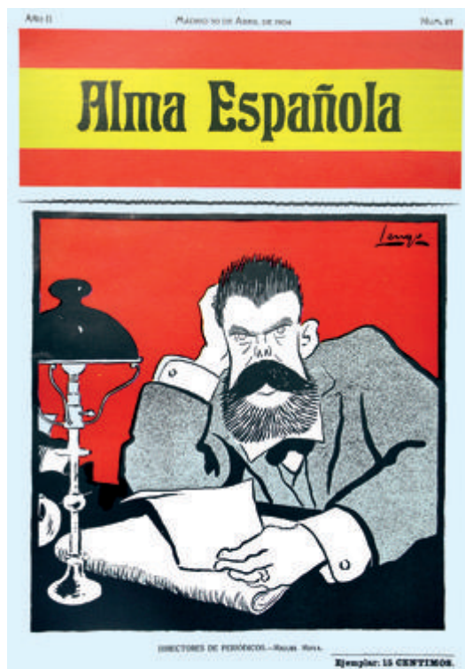
Figura 10. Alma Española , n.º 23, 30/4/1904, Directores de periódicos: Miguel Moya . Col. BNE

La segunda portada realizada por Tomás es un dibujo de depurados blancos y negros con un impactante fondo amarillo que aprovecha el color de la bandera