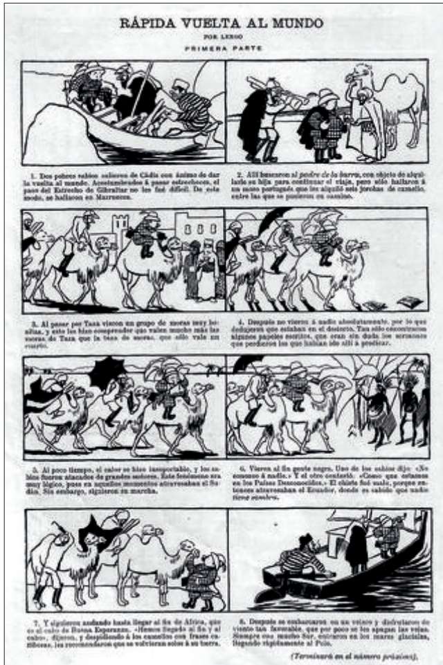
Figura 13. Blanco y Negro, n.º 725, 25/3/1905, p. 17. Rápida vuelta al mundo 1ª parte.