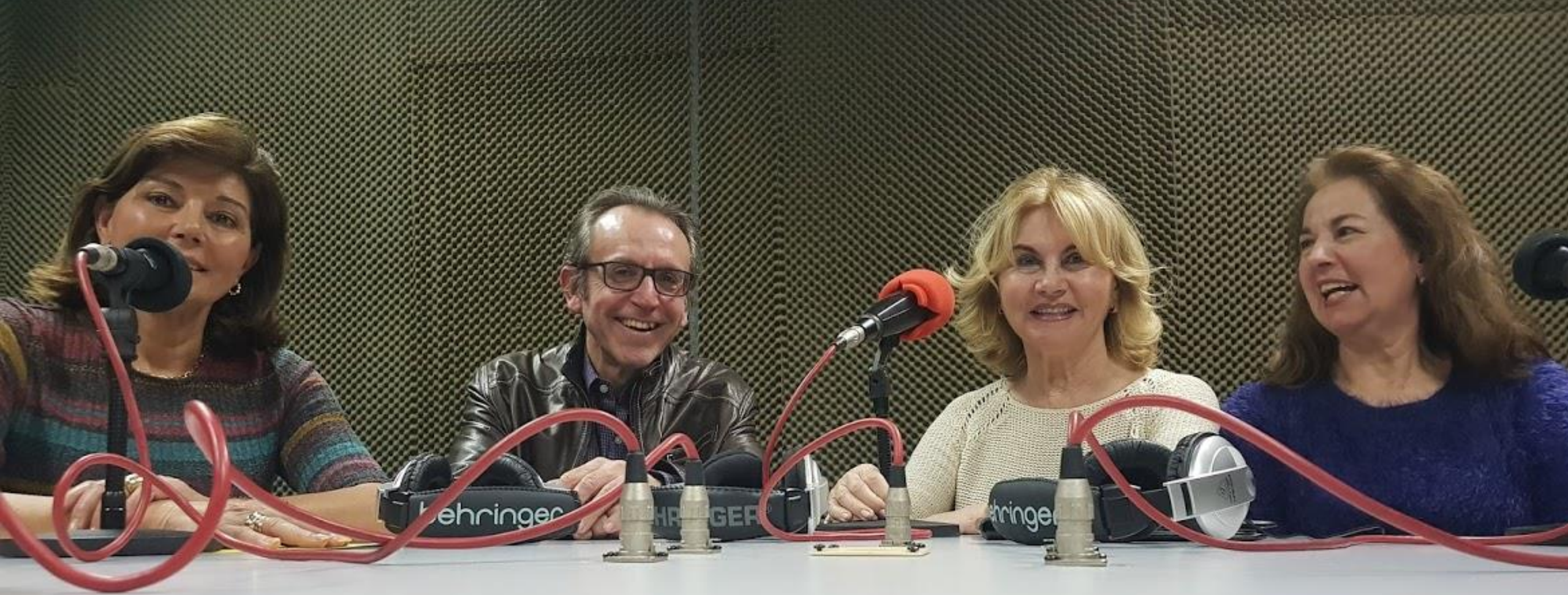
Alumnado taller radio Aula Mayores +55