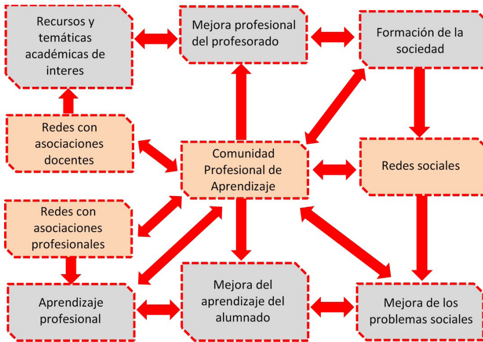
Figura 1 Esquema de relación y resultados de aprendizaje de las comunidades de aprendizaje profesional abiertas y con compromiso social

A partir de una metodología basada en una revisión bibliográfica de textos y de páginas web, el artículo define el modelo de forma general en el apartado 2, mientras que en el apartado 3 se analiza su desarrollo para el ámbito docente del urbanismo. Inicialmente, se revisa la situación docente en España y, posteriormente, se analizan los tres aspectos básicos de su implementación: el fortalecimiento de las redes a diferentes escalas con la incorporación de la sociedad, los nuevos escenarios docentes que debe gestionar este modelo con la incorporación de la universidad abierta y, finalmente, los cambios que se introducen en la metodología docente del aprendizaje basado en proyectos (ABP).