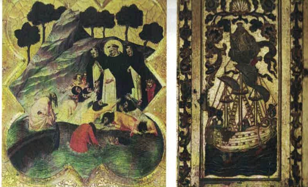
Figura 5. Francisco Alonso de Castro, Retablo-relicario, 1735, San Telmo rescata a la dotación de un navío . Catedral, Tui [derecha] y Francesco Traini, Trittico di San Domenico, 1344-45, Santo Domingo salva a un grupo de peregrinos ingleses en el río Garona . Museo Nazionale di San Matteo, Pisa [izquierda].