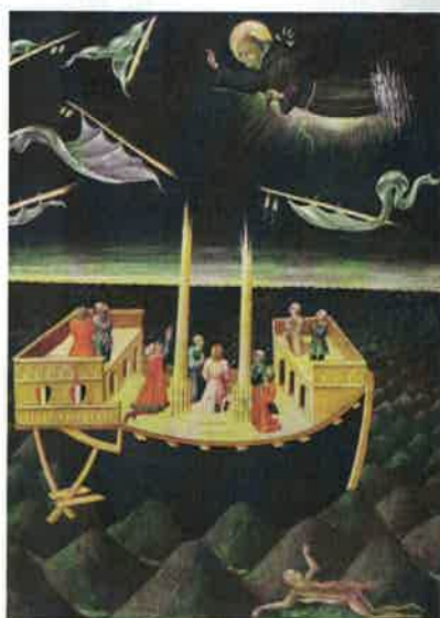
Figura 6. Paul, Herman y Johan Limbourg, Belles Heures du duc de Berry , ca. 1405-09, San Nicolás de Bari acude a la llamada de los miembros de una embarcación . The Metropolitan Museum of Art, New York [izquierda] y Giovanni di Paolo, Saint Nicholas of Tolentino saving a shipwreck , 1457. Philadelphia Museum of Art, Philadelphia [derecha].