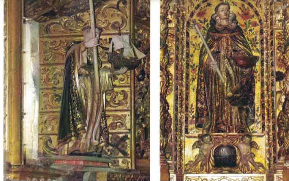
Figura 7. San Telmo como patrón de mareantes , de Francisco Alonso de Castro, Retablo-relicario, 1735 y Francisco de Castro Canseco, Sillería del coro, 1699 [izquierda y derecha]. Catedral, Tui.