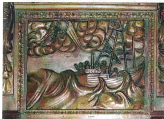
Figura 4. Francisco de Castro Canseco, Sillería del coro, 1699, San Telmo rescata a un náufrago [arriba] y San Telmo ayuda a la tripulación de un barco [abajo]. Catedral, Tui.