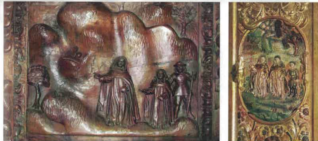
Figura 3. Milagro de los alimentos en el viaje a Baiona , de Francisco de Castro Canseco, Sillería del coro, 1699, y Francisco Alonso de Castro, Retablo-relicario, 1735 [izquierda y derecha]. Catedral, Tui.