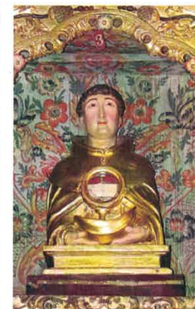
Figura 8. San Teotonio y San Telmo, Sacristía capitular, anterior a 1617 [izquierda] y Busto con reliquias de San Telmo, Retablo mayor de la capilla de San Telmo, posterior a 1735 [derecha]. Catedral, Tui.