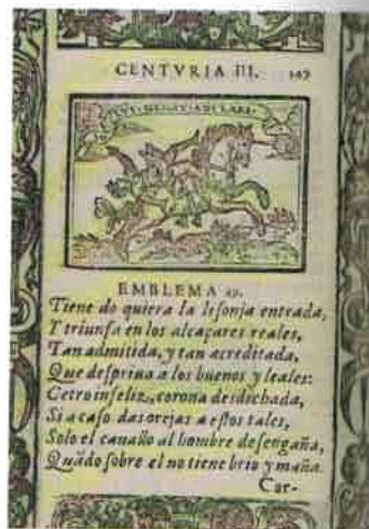
Figura 2. Pedro Ángel, San Pablo camino de Damasco , en Alonso de Villegas: Flos sanctorum , Toledo, Por la viuda de Iuán Rodríguez, 1591, p. [103] [izquierda] y Solus nescit adulari , en Sebastián de Cobarrubias Orozco: Emblemas morales , Madrid, Por Luis Sánchez, 1610, emblema 45 de la centuria tercera [derecha].