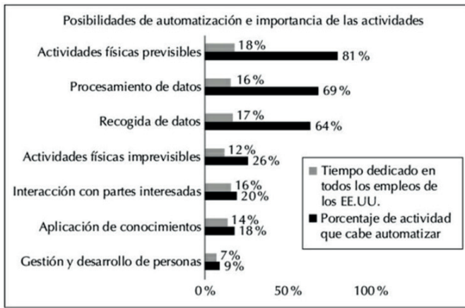
Figura 1. Posibilidades de automatización de actividades en el ámbito laboral y su importancia en el trabajo