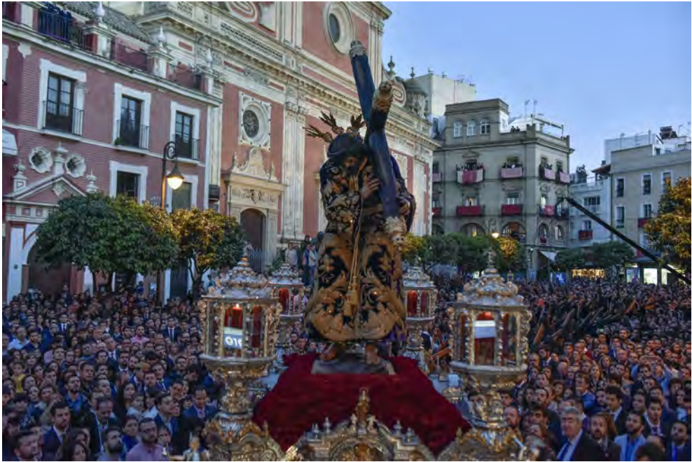
Fig. 1. En pleno siglo XXI, la Semana Santa en Andalucía sigue siendo un fenómeno multitudinario. Perspectiva de la Plaza del Salvador de Sevilla a la salida de Jesús de la Pasión, la tarde del Jueves Santo