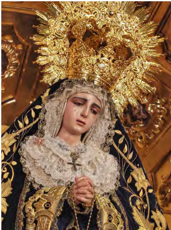
Fig. 5. La suntuosidad del ornato complementa la expresividad y la belleza de las imágenes vestidas. Antonio Asensio de la Cerda (atribución). Virgen del Amor Doloroso (1771). Iglesia de los Santos Mártires, Málaga