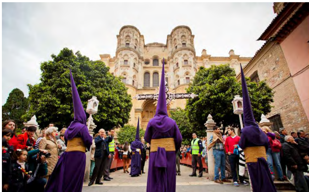
Fig. 6. La estación de penitencia es la meta sagrada y la razón de ser del itinerario procesional. Nazarenos de la Archicofradía Sacramental de Pasión a su llegada a la Catedral de Málaga

De lo anterior se extraen una serie de interesantes conclusiones aplicadas a la estación de las hermandades andaluzas. De entrada, aquilata la solemnidad y disciplina «militar» de la liturgia estacional romana al inaugurar y clausurar el rito procesional en el mismo enclave. El cortejo penitencial verifica un recorrido cíclico perfecto, cerrado y completo al salir del templo que hace las veces de sede, dirigirse a la Catedral u otra iglesia estacional, verificar allí la statio y retornar al punto de partida (Fig. 6). Este rasgo jerarquiza y atempera, al tiempo que equilibra, el componente emocional de la statio al haberse alcanzado el clímax dramático en el punto intermedio de la celebración. Semejante aspecto diferencia la estación de penitencia de la costumbre hierosolimitana de ir pasando por sucesivas stationes que conducen a los fieles de unos lugares a otros a través de un denso itinerario, pero quizás dando la sensación de un camino sin retorno.