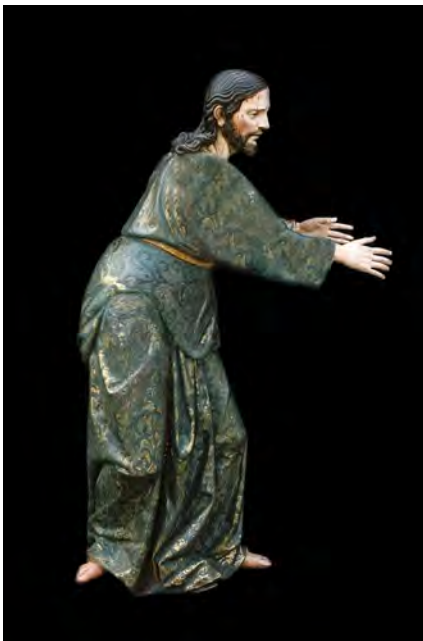
Fig. 3. A partir de las interpretaciones de Pablo de Rojas se consolida la iconografía procesional del Nazareno en Andalucía, a través de obras como el ejecutado hacia 1592, conservado en la antigua Iglesia conventual de San Francisco, en Priego de Córdoba

Como vemos, al Crucificado le surgía en el siglo XVII una dura competencia y, en definitiva, una sólida alternativa devocional personificada en el Nazareno y las hermandades erigidas en torno a su carisma. No puede olvidarse que su prestancia iconográfica terminaría haciendo del mismo la representación por excelencia de la escultura procesional andaluza, hasta el punto de poder afirmarse que no existirá ciudad, población, pueblo o villa, por pequeña que sea, que no lo cuente entre las advocaciones de su imaginario religioso (Fig. 3).