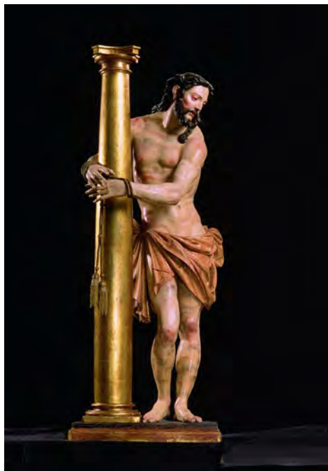
Fig. 2. La escultura de Cristo atado a la columna adquirió una dimensión artística sin precedentes a partir del Naturalismo quinientista. Pablo de Rojas (atribución). Cristo de la Paciencia (c. 1600). Iglesia Imperial de San Matías, Granada

Un rasgo idiosincrásico de las cofradías penitenciales frente a otras sodalitates católicas fue asumir la flagelación como conducto ideal para la imitación de Cristo sufriente. Bajo esa óptica, la disciplina era un método tan válido como la oración para venerarlo y rendirle culto a través de un episodio emblemático de los misterios de la Redención (Fig. 2). En este punto conviene recordar cómo, bajo la mirada moderna, la flagelación continúa inmersa en la discusión, la controversia y el debate sobre la filosofía del mysterium doloris 14 y el sentido sociológico determinante de la construcción cultural del cuerpo 15 . Semejante gama de matices viene condicionando, pues, su consideración historiográfica actual ya sea como acto piadoso, ejercicio masoquista o expresión de histeria religiosa, coexistiendo con otras visiones aportadas desde la perspectiva teológica y psicoanalítica 16 .