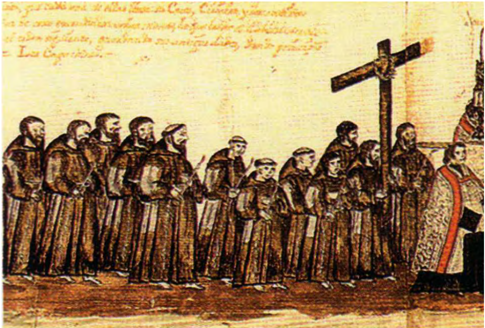
Fig. 7. Nicolás de León. Cortejo de los frailes franciscanos en la procesión del Corpus de Sevilla (1747)

nizado por el Cabildo Catedral de Sevilla en la festividad del Corpus Christi 71 . Según el protocolo establecido, tras el paso del Niño Jesús se abría el desfile de las órdenes religiosas encabezado por los hijos de San Francisco, asentados en Sevilla desde el mismo instante de su conquista en 1248 por Fernando III. Los frailes no marchan detrás de una cruz alzada convencional de tipo parroquial, sino de una sobria Cruz de Guía de madera confeccionada con dos tablones, en cuyo crucero se sitúa la corona de espinas (Fig. 7). Su envergadura considerable suscribe una tipología idéntica a la consagrada por el uso en el seno de las cofradías de nazarenos en sus estaciones de penitencia desde finales del XVII hasta hoy.