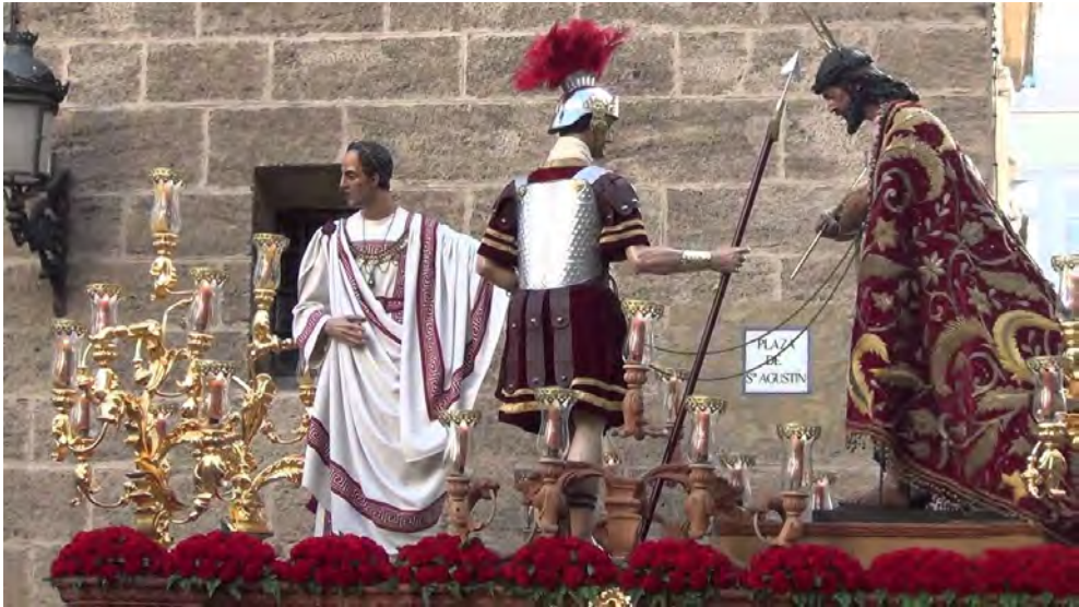
Fig. 4. El paso del misterio interactúa con los paisajes urbanos, otorgando un carácter metamórfico a los escenarios de la Semana Santa. Conjunto procesional de Jesús del Ecce-Homo ante la Iglesia de San Agustín, en Cádiz