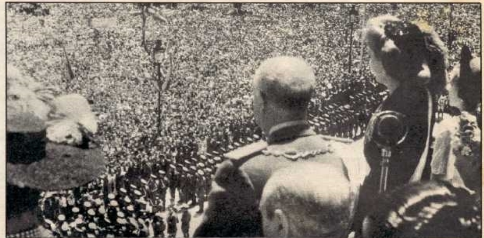
Más de medio millón de personas aclamaron, en la mañana del 9 de junio, a la esposa de Perón, a la cual había impuesto el Jefe del Estado la Gran Cruz de Isabel la Católica en un acto de emotiva gratitud.