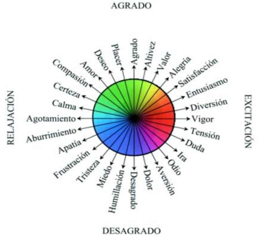
Figura 1. Modelo circular del sistema afectivo. En un plano cartesiano definido por dos variables ortogonales, una horizontal de activación (excitación a la derecha, relajación a la izquierda) y otra vertical de valor hedónico (agrado arriba y desagrado abajo) se ubican catorce ejes polares de emociones antónimas (de signo afectivo contrario). En el centro del diagrama se acomodó el círculo de los colores que se elaboró con un criterio similar de oposición entre complementarios.