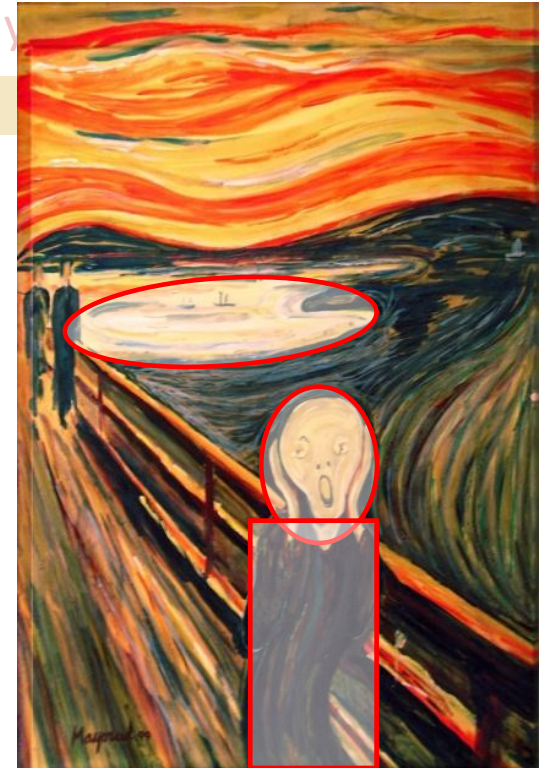
El grito. MUNCH. 1893