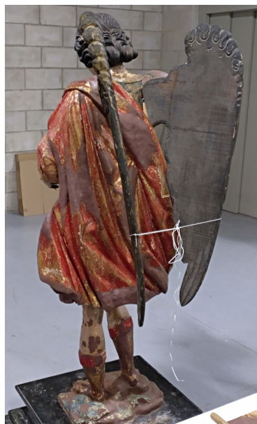
FIG. 6. Reintegración de pérdidas matéricas en la trasera escultórica.