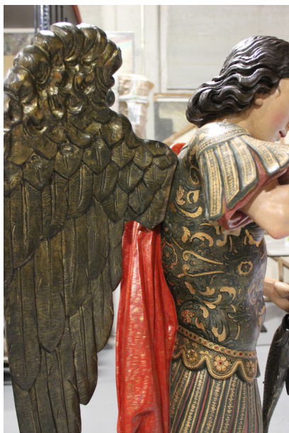
FIG. 9. Vista lateral de la escultura en su estado final.