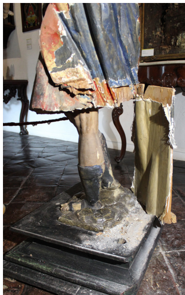
FIG. 3. Desmonte de la falsa capa que actuó como tercer soporte sobre la peana.