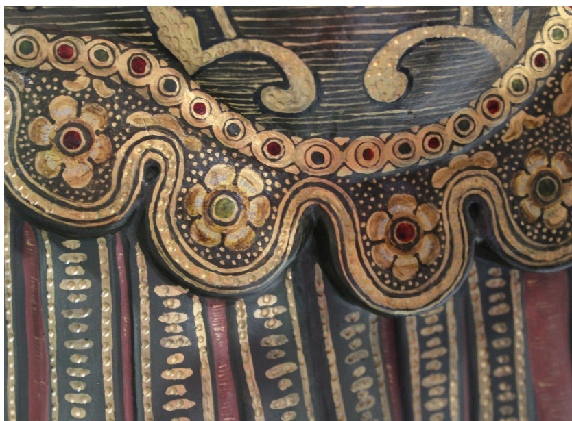
FIG. 10. Detalle de la coraza con la aplicación de esmaltes.