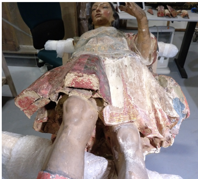
FIG. 4. Perspectiva del faldellín en el proceso de retirada de los añadidos.