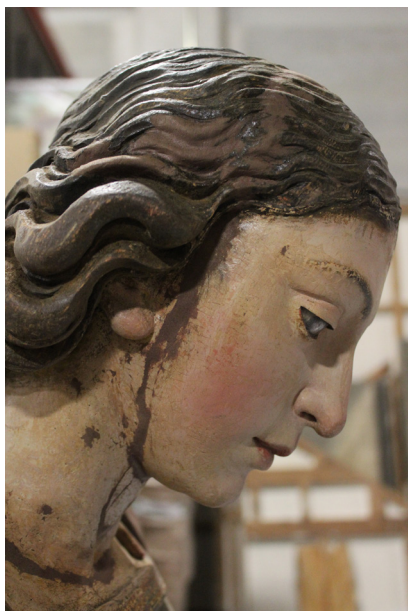
FIG. 7. Reintegración volumétrica en la unión de la mascarilla.

–dedos, parte del faldellín, etc.– corrió en paralelo al tratamiento por independiente de complementos como el pez, la vara de asta larga con cruz y calabaza –que no es la original y se recortó por su excesiva extensión–, y las alas recolocadas –tras despojar la escultura de la falsa capa– con una disposición más cerrada ideal para consolidar la armonía de la pieza (FIGS. 6 Y 7). El barnizado preparó las superficies para acometer la reintegración cromática final con pigmentos al barniz y oro en polvo disuelto en resina, para las zonas doradas, en tanto se unificaban brillos mediante la aplicación de barniz en spray bajo un aspecto satinado general.