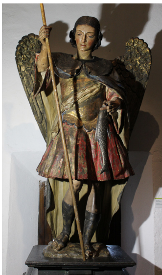
FIG. 1. Torcuato Ruiz del Peral (atribución), San Rafael arcángel antes de la restauración, mediados del siglo XVIII, Museo Unicaja de Artes y Costumbres Populares de Málaga.