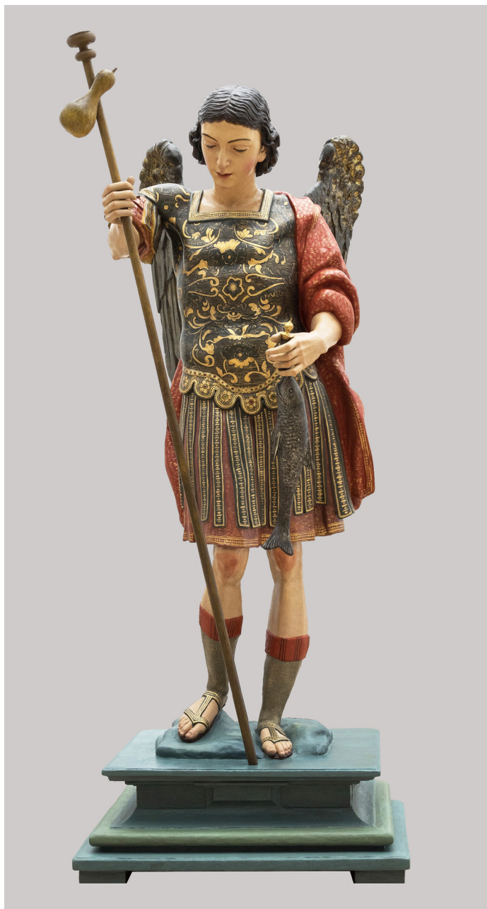
FIG. 8. Aspecto final de la escultura de San Rafael una vez finalizada la restauración.