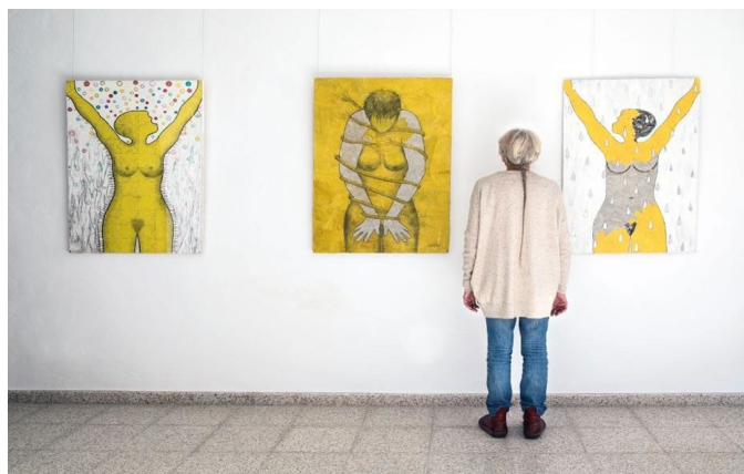
Fig. 1. Madeleine Edberg.

Madeleine Edberg es una artista multidisciplinar, nacida en Boden, Suecia, en 1938, que llegó a Málaga en la década de los años 70. La obra de Edberg se fundamenta en el compromiso con las condiciones sociales de las mujeres, como sujetos políticos y como artistas, y en la preocupación por lo considerado residual en nuestra sociedad [Fig. 1]. Además de su labor artística y docente, ha estado involucrada en una intensa gestión cultural en el centro de creación contemporánea UKaMa en Torremolinos, fundado por ella y su hija, la también artista Karolina Kinnander.