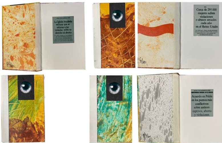
Fig. 4. Libro de artista: El cuento de nunca acabar , 2003. Técnica mixta, papel artesano, electrografía

El formato del libro de artista permite el tratamiento de la idea o el concepto trabajado. En este caso la denuncia de situaciones de violencia, violaciones, abusos y asesinatos de mujeres por el hecho de ser mujeres. La artista recurre a un título polisémico o con doble sentido. Por un lado, la referencia a los cuentos como creaciones literarias infantiles. El formato no hace pensar en el horror que contienen. La ilusión infantil se desvanece cuando se abre la cubierta y nos enfrentamos a los mensajes expuestos de forma lapidaria: negro sobre gris. El cuento de nunca acabar proyecta en el tiempo y en el espacio la denuncia de los crímenes feminicidas.