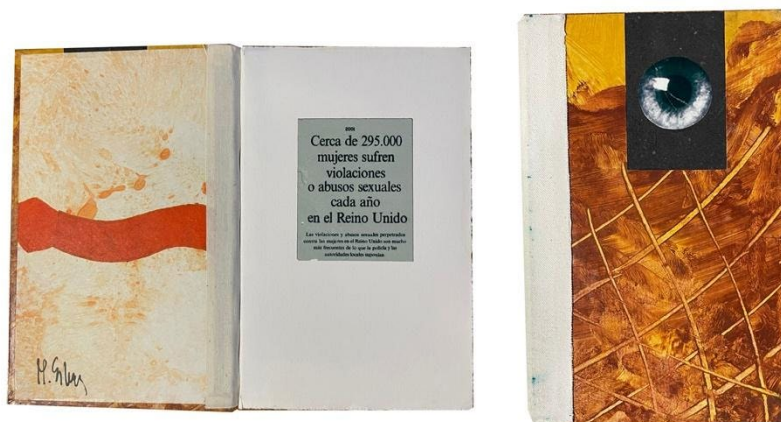
Fig. 5. Libro de artista: El cuento de nunca acabar , 2003. Técnica mixta, papel artesano, electrografía

“disminución”, es decir la reproducción de un solo órgano, libran