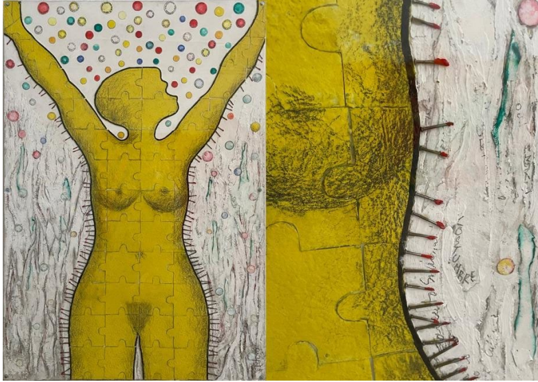
Fig. 3. Tú y tus circunstancias , 2014. Técnica mixta, pintura y papel artesanal o reciclado, 100x70cm

alfileres, son objetos habituales de las piezas más reivindicativas de la autora. Además de estas puntas ensangrentadas que parecen querer mantener a raya cualquier acercamiento a este cuerpo que es un puzle, al que se le han dedicado muchas horas y aparece finalmente acabado, flotan en el fondo burbujas de colores; oxígeno lingüístico de palabras como autovalor, talento, tolerancia, respeto, resistencia, futuro, solidaridad, cultura, etcétera. Situaciones, estados, y espacios, a los que el acceso sólo parece posible cerrando el camino a los afectos y emociones que pueden conllevar, en su lado más oscuro, la violencia y la falta de libertad.