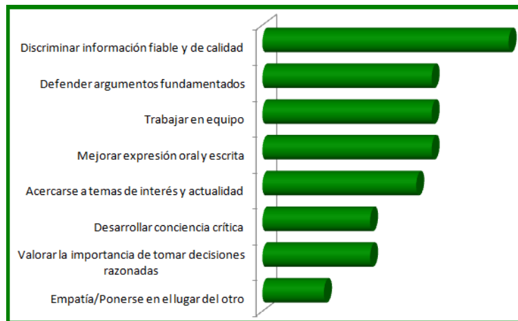
Gráfica 2. Percepciones del alumnado: aportaciones de la actividad de juego de rol y dramatización a la vida cotidiana