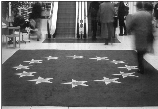
[fig. 3. Antoni Muntadas, CEE Project , Kobenhav Hovenbibliotek, Copenhagen, 1994.]