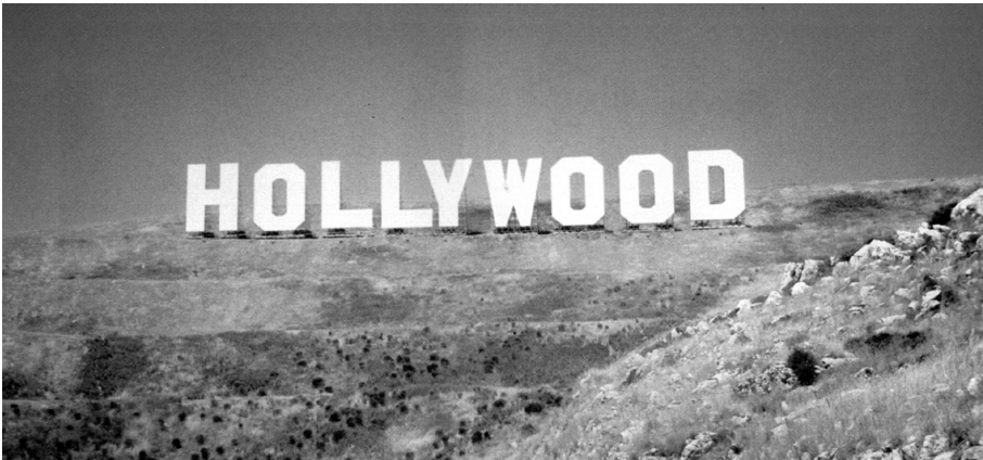
[fig. 2. Maurizio Cattelan, Hollywood . Vertedero de Bellolampo, Palermo, 2000-2001]

La calle es escenario de todo y no lo es de nada. Escenario , espacio para una representación, y también para su contemplación, es el museo. En la casa del arte se sabe que lo que hay es arte. Pero en la calle hay de todo: si nada nos indica que lo que allí vemos es arte (el pedestal de un monumento, la guía turística, una placa identificativa, etc.), simplemente no lo es. Eso es lo que nos ocurre con el arte invisible: que no se ciñe a esa comunidad de representación a la cual lo hacen otras manifestaciones artísticas. Y ello es así a consecuencia de esa modificación que he planteado al principio: la pragmatización del arte que pretenden llevar a cabo estas propuestas modifica su semántica y su sintaxis. Contextualizar la obra en su entorno es aquí disolverla en el mismo; literalmente, hacerla entorno .