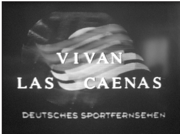
[fig. 6. Rogelio López Cuenca, fotograma de uno de los videopoemas Segundos fuera , serie de insertos televisivos emitidos en la parrilla publicitaria de Canal Sur, 1994.]

análogas que no se consideran creaciones artísticas, un más atento estudio del proceso nos puede hacer ver que la forma de estas obras, como la de tantas otras, simplemente no concluye en la superficie de su imagen. Pues su modo de manifestarse, de hacerse ver, implica una intervención en la realidad en la que actúa, en la memoria de un lugar, físico o mental, social en fin, que es señalado como significativo durante el proceso de recepción de la obra. E implica, entonces, que la formalización de esta operación concluye con la modificación del mirar de quien la interpreta: una transformación de la mirada desde una condición de recepción y goce pasivos a otra de análisis, a una actitud de sospecha y suposición de un encubrimiento detrás de toda evidencia, un acto que desmiente la verosimilitud de nuestro cotidiano imago mundi .