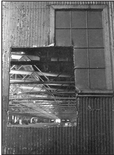
[fig. 5. Gordon Matta-Clark, Pier In/Out , Nueva York, 1973.]