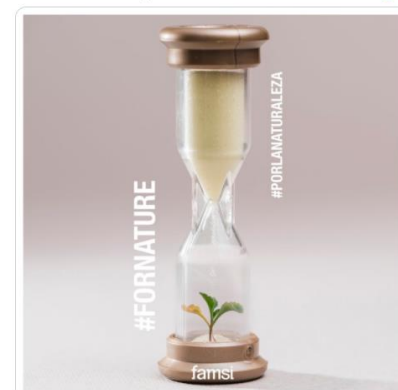
Diputación de Huelva y 9 más 12:43 p. m. · 5 jun. 2020 · Twitter Web App

FAMSI Solidario @FAMSI_Solidario Este 5 de junio #DíaMundialDelMedioAmbiente. Llegó la hora de reaccionar y levantar nuestras voces #PorLaNaturaleza. Por los alimentos, el aire que respiramos, el agua que bebemos y el clima para la vida; para cuidar de nosotros mismos, primero debemos cuidar de ella.