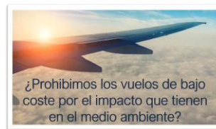
Fig. 3. Ejemplo de dilema ético.

En la Fig. 3 se muestra un simple dilema ético asociado a avances tecnológicos. Aquellas personas que en su moral tengan en alto valor la protección al medioambiente, probablemente pedirán la prohibición de estos vuelos. Pero quienes tengan como valor mayor la democratización del turismo para todas las clases sociales, quizá lleguen a la conclusión contraria. Y puede que ambos grupos tengan realmente los mismos valores, pero con distintos pesos. Solo el diálogo constructivo y el espíritu crítico puede conseguir un consenso final, analizando muchos otros factores que pueden rodear ese problema.