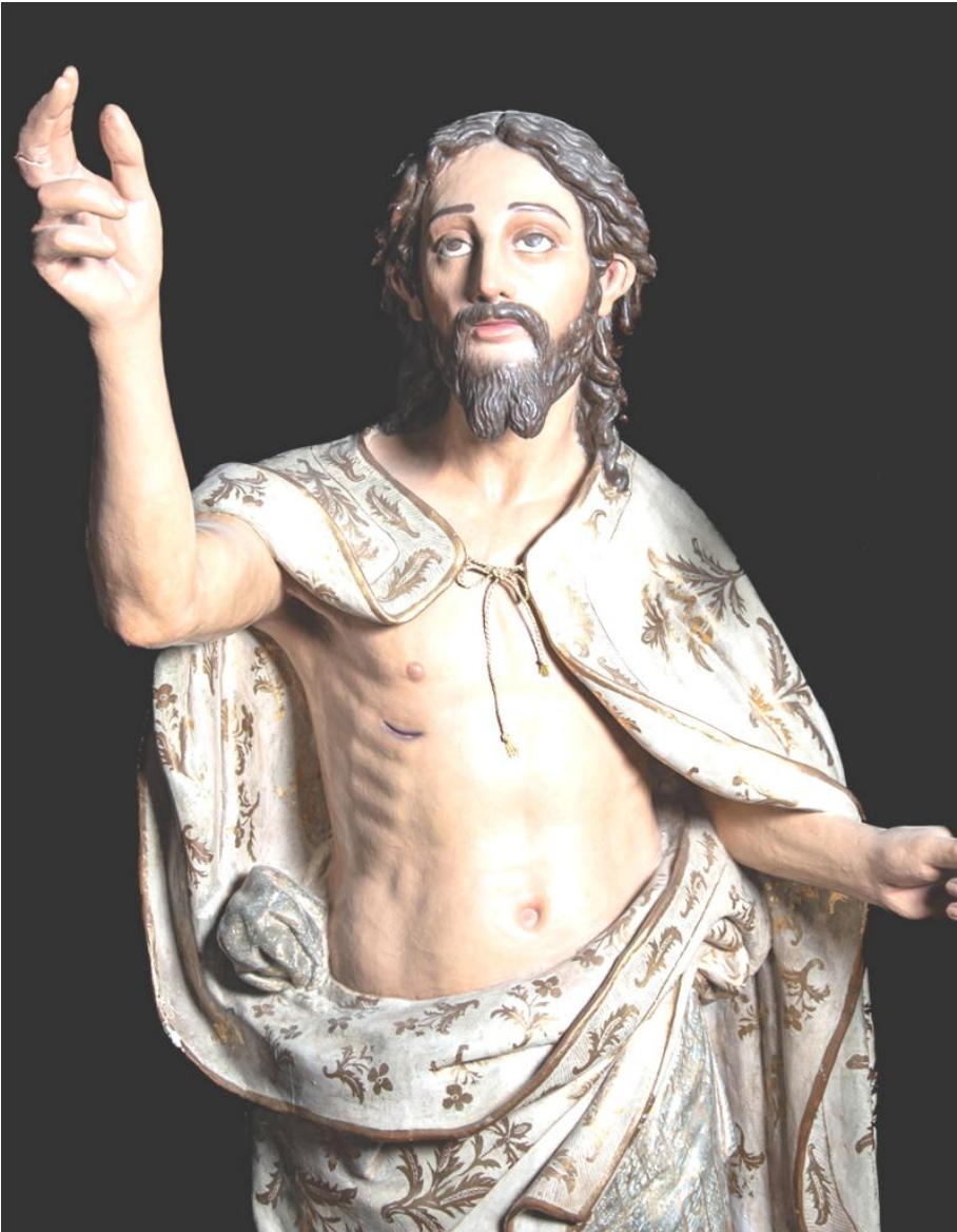
Fig. 7. Anónimo: Cristo Resucitado , principios del siglo XVII. Capilla de la Archicofradía de la Sangre de la iglesia de San Zoilo de Antequera.