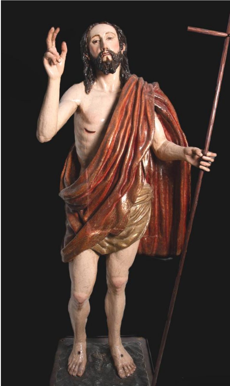
Fig. 8. Anónimo: Cristo Resucitado, finales del siglo XVI-principios del XVII. Iglesia de la Victoria de Antequera.