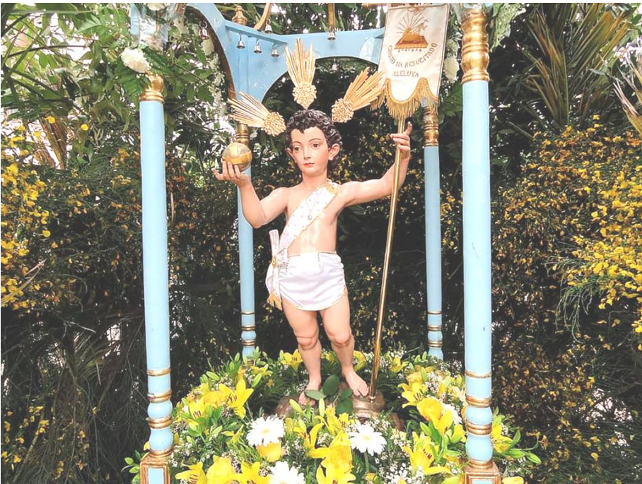
Fig. 2. Francisco Buiza Fernández: Niño Jesús Resucitado , 1965. Iglesia de Nuestra Señora del Rosario, Cartajima.

vez relacionado con la costumbre festiva del «Niño del huerto», bastante común –por haberse mantenido en el tiempo– en la zona de la serranía natural de Ronda, más en concreto en el valle del Genal, aunque hay lugares, como Cartajima, donde se le denominan «Las Cortesías» 21 (Fig. 2). Se trata de una costumbre festiva vinculada a la Resurrección de Cristo y que suele adaptarse en la mayoría de las ocasiones a un patrón muy similar. En realidad, es una representación simbólica del huerto que citan los Evangelios en su cercana disposición al Calvario, donde Jesús fue crucificado, y lugar elegido para ser enterrado 22 .