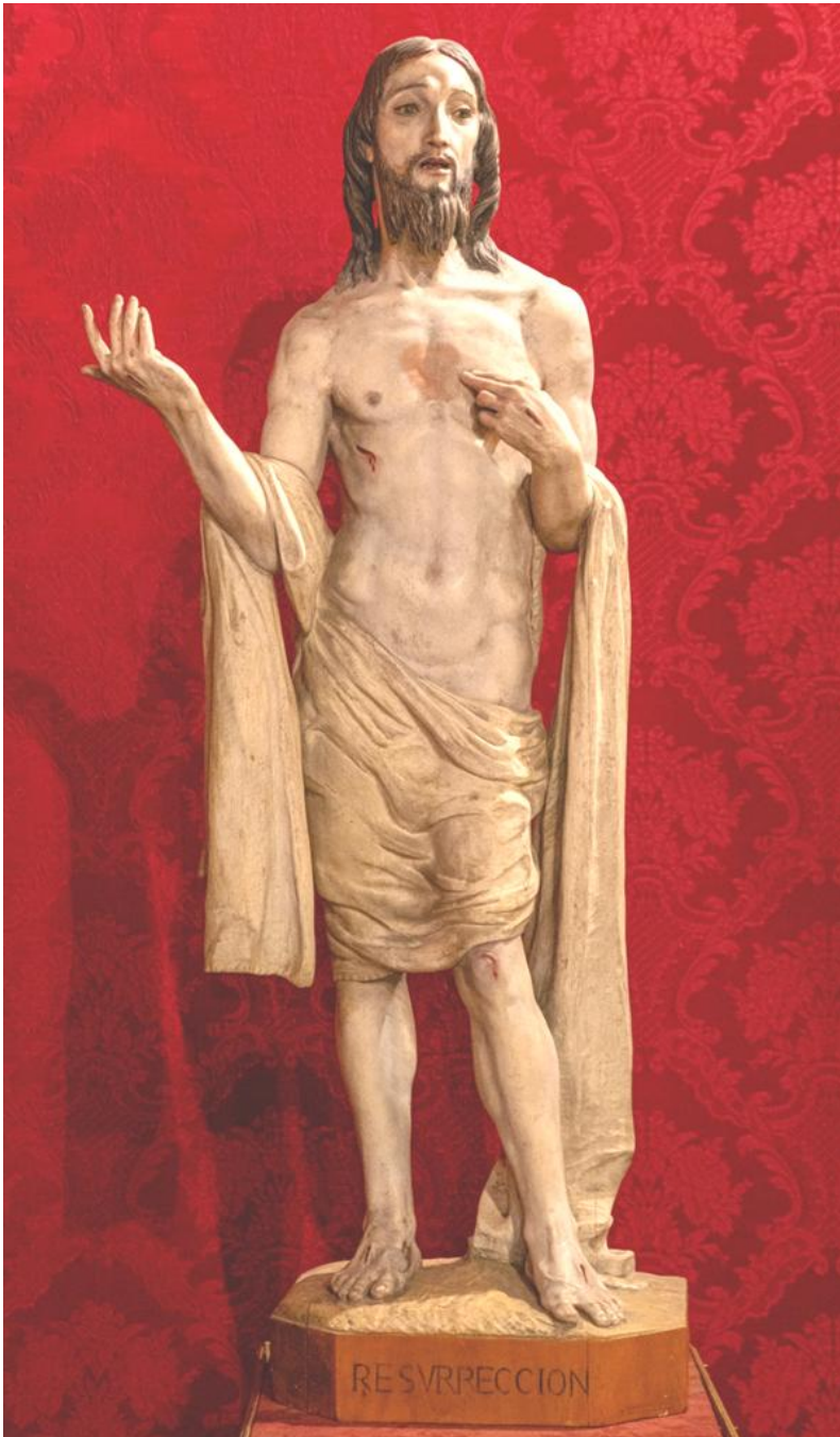
Fig. 11. Enrique Marín Higuero: Cristo Resucitado , 1945. Iglesia de San Juan de Letrán de Arriate.