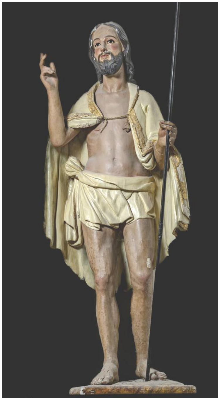
Fig. 9. Anónimo: Cristo Resucitado , siglo XVIII. Iglesia del Carmen de Antequera.