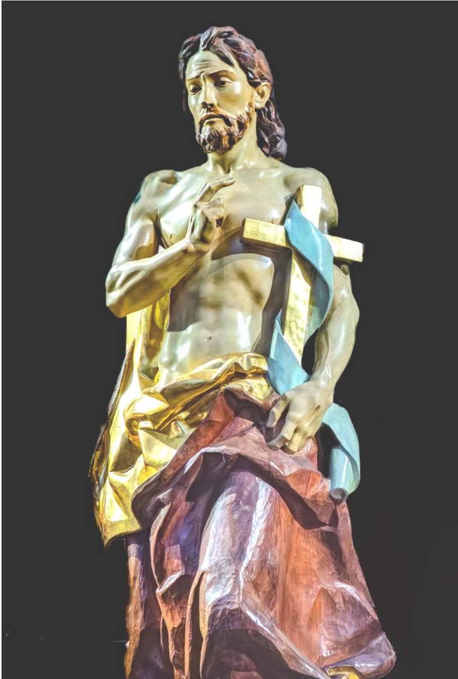
Fig. 1. José Capuz Mamano: Cristo Resucitado , 1946. Iglesia de San Julián, Málaga.