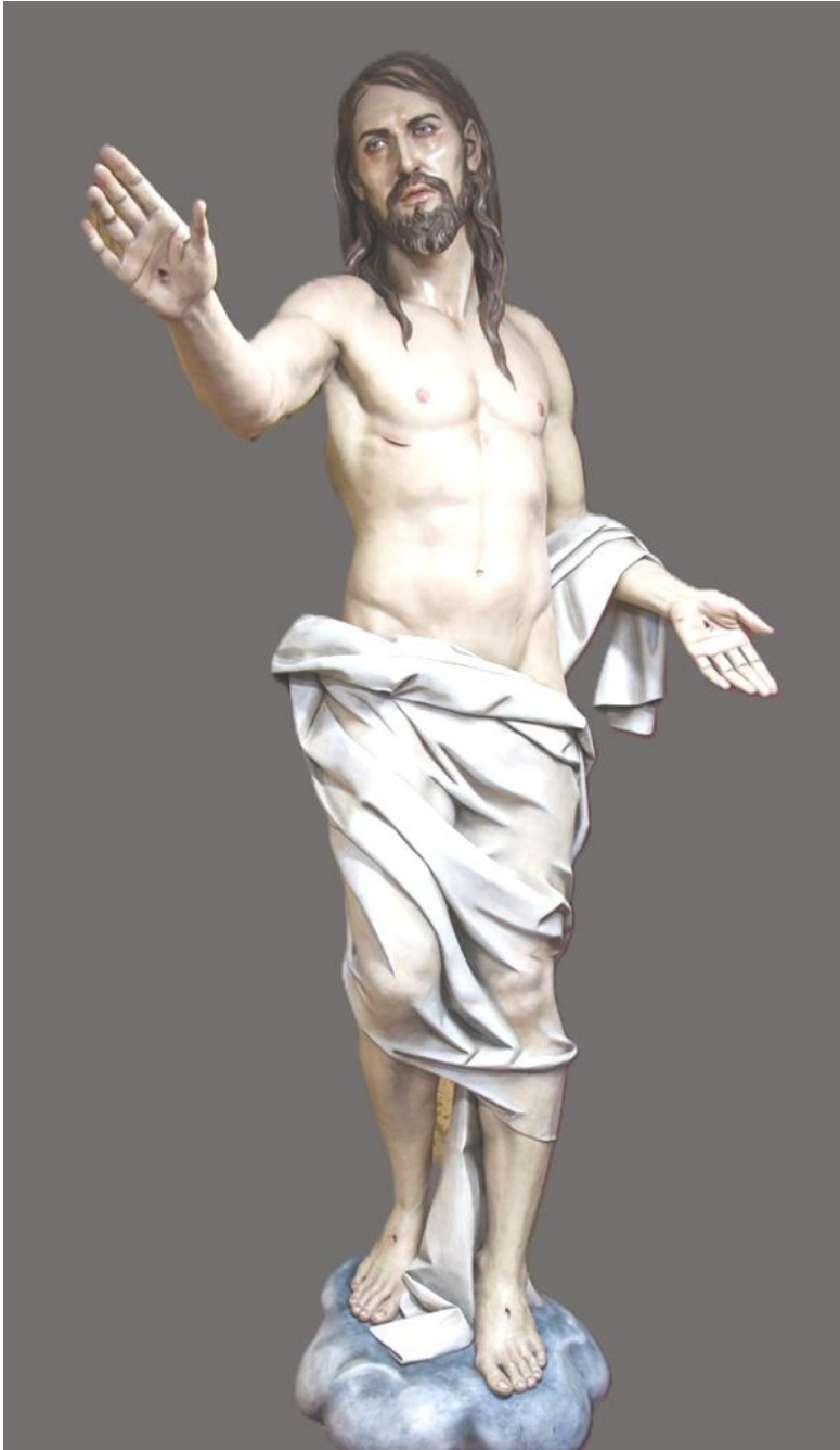
Fig. 14. Juan Vega Ortega: Cristo Resucitado , 2009. Iglesia del Asilo de los Ángeles de Málaga.