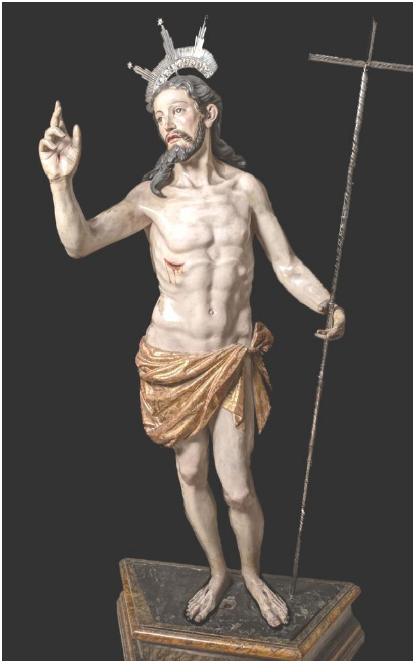
Fig. 10. Anónimo: Cristo Resucitado , primera mitad del siglo XVII. Convento cisterciense de la Encarnación (Atabal) de Málaga.