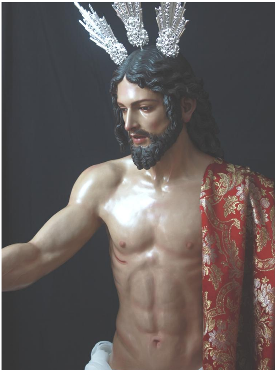
Fig. 12. Israel Cornejo Sánchez: Detalle de Cristo Resucitado , 2017. Iglesia del Espíritu Santo de Ronda.