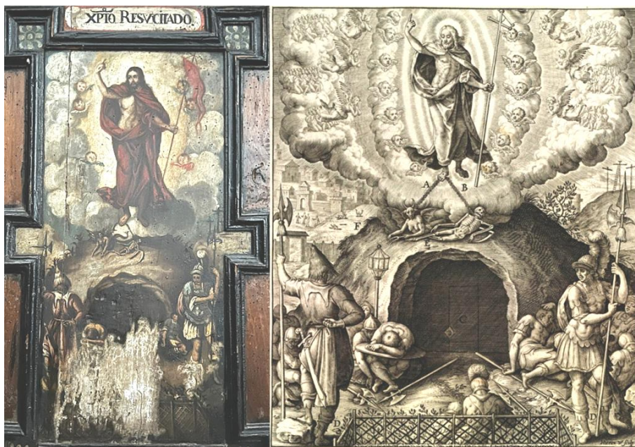
Fig. 3. Anónimo: Cristo Resucitado , h. 1728. Sacristía de la iglesia de San Zoilo, Antequera. Pintura inspirada en el grabado de Hieronymus Wierix (Amberes, 1593)

y, en la parte media, pese a mantener el reflejo de la colina del Calvario, con las tres cruces, obvió la ciudad amurallada de Jerusalén.