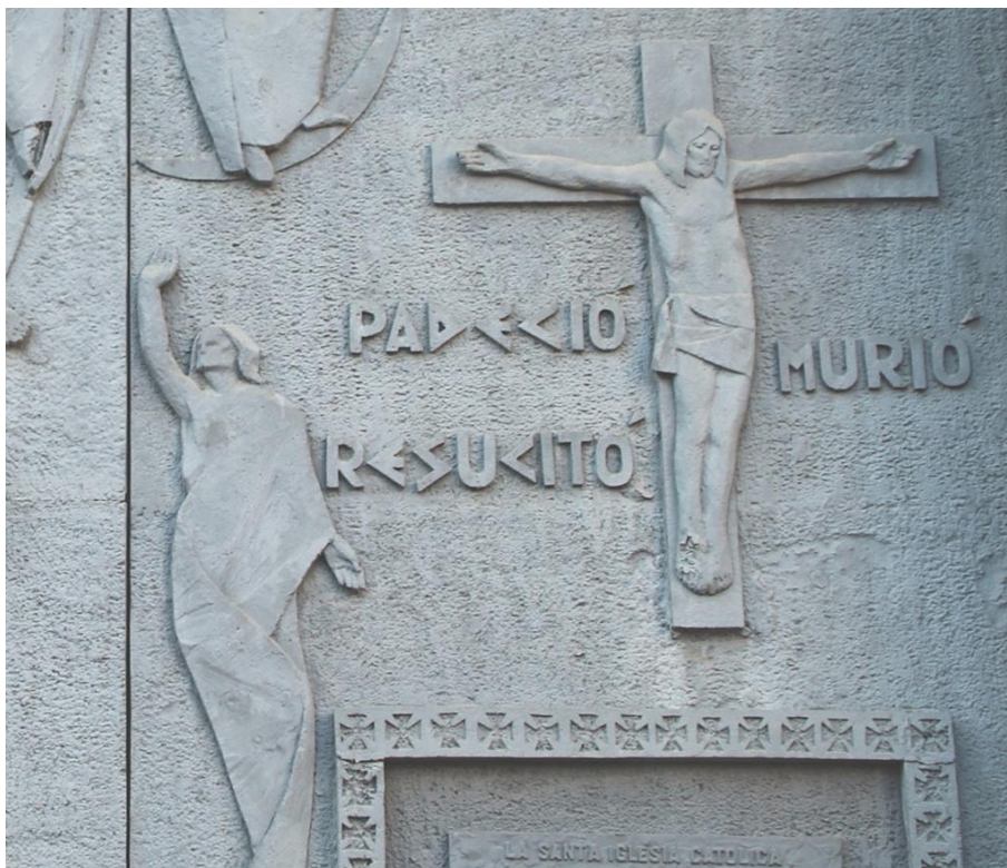
Fig. 6. Hamilton Reed Armstrong: Detalle de Cristo Resucitado , 1975. Puertas de la iglesia de Nuestra Señora del Rosario de Fuengirola.

de narra los artículos del credo desde la palabra y su correspondencia figurativa. Entre ellas, la representación de Cristo Resucitado , como el resto con una poderosa gestualidad y una impronta de manifiesto carácter poético.