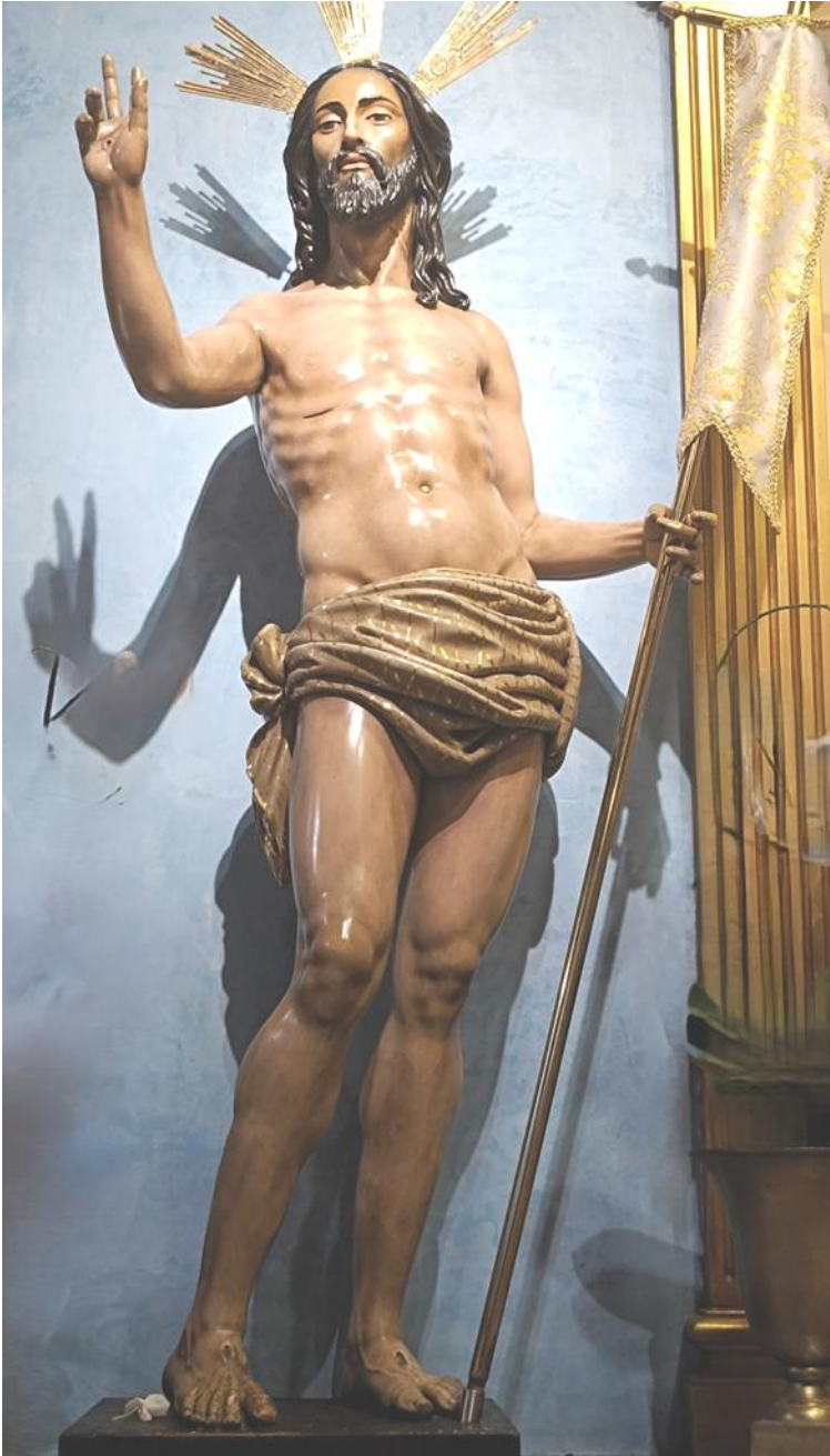
Fig. 13. Antonio Eslava Rubio: Cristo Resucitado , 1972. Iglesia de la Virgen del Carmen y Santa Fe de Los Boliches (Fuengirola).