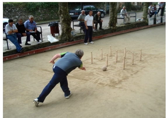
Juego de bolos en Asturias