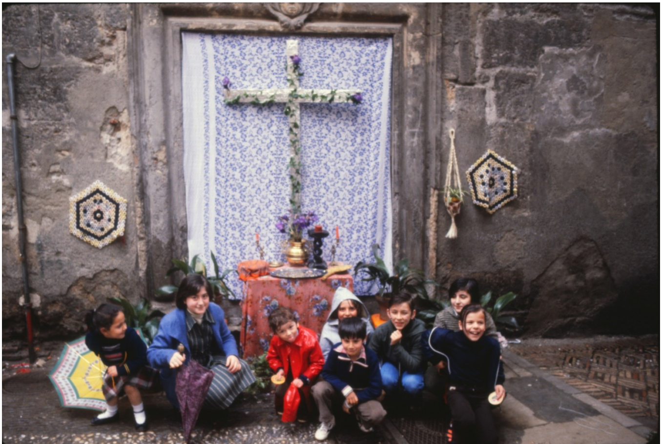
Cruz de Mayo infantil en el Albaicín, 1979