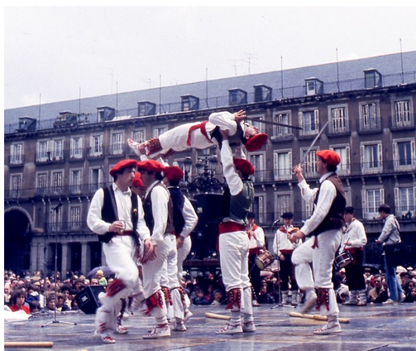
Kaxarranka de Lekeito (en Madrid, 1984)

Y para ello desarrolló una precisa metodología para abordar el conjunto de las variantes de un ritual festivo (en diferentes épocas y espacios geográficos) complementado el análisis comparativo de sus formas materiales (personajes, objetos, acciones) con su ubicación dentro de cadenas histórico-culturales, para detectar modelos, influencias, etapas y transiciones. Y como fuentes, tanto las históricas (archivos, obras literarias y religiosas, relaciones impresas) como las observaciones etnográficas.