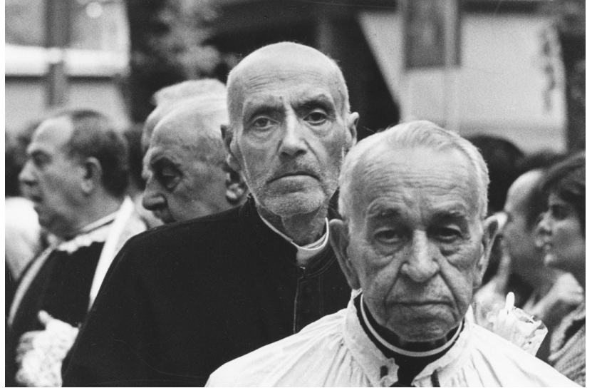
Serios clérigos en la procesión del Corpus de Granada, 1979