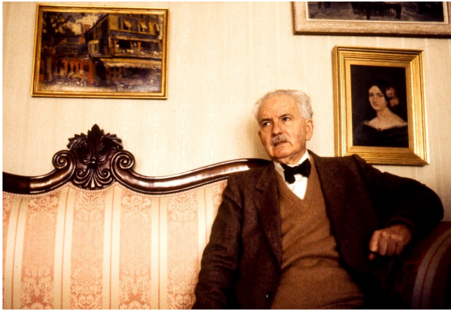
D, Julio en su casa de Madrid, 1982

Julio Caro Baroja fue uno de los intelectuales españoles de mayor prestigio internacional: historiador, antropólogo, etnógrafo, filósofo, sicólogo social, especialista en religiosidad, y en resumen, polifacético erudito con más de 600 publicaciones.