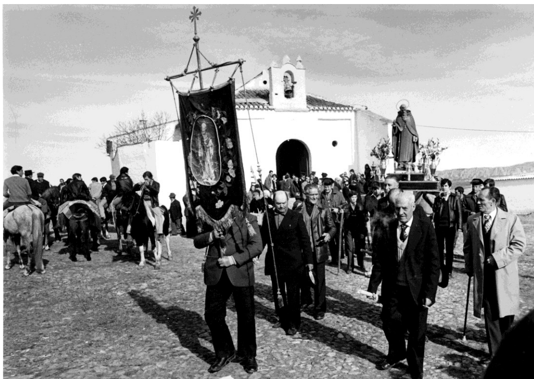
Romería de San Antón en Guadix (Gr), 1981

MORALES, M. Rodrigo Caro: bosquejo de una biografía íntima , Utrera, Ayuntamiento, 1947.