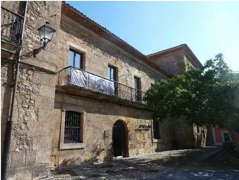
Palacio de García de Jove (siglo XVI) en Gijón, casa natal de Jovellanos en 1744

Designado por Godoy Ministro de Gracia y Justicia en 1797, en ocho meses su gestión reformista aboca a su cese. Intentan envenenarle, regresando desanimado a Asturias, donde se interesa por el bable. Reaccionarios poderosos le encarcelan en 1801 (sin cargos ni proceso), pasando siete años prácticamente incomunicado en Mallorca, donde redacta su Memoria sobre educación pública . Liberado tras el motín de Aranjuez, José I Bonaparte le ofrece el Ministerio del Interior, pero opta por luchar contra los invasores, pero asimismo por la igualdad social. Llamado a la Junta Central, viaja a Cádiz para colaborar en redactar la Constitución. Disuelta la Junta, regresa a su Gijón natal. Al ser ocupada por los franceses, trata de huir por barco a Cádiz, pero fallece de pulmonía en el puerto de Vega en 1811, a los 67 años. El epitafio en su mausoleo le proclama “no menos respetable por las virtudes que adorable por sus talentos; urbano, recto, íntegro, celoso promovedor de la cultura y de todo adelantamiento en su país”.