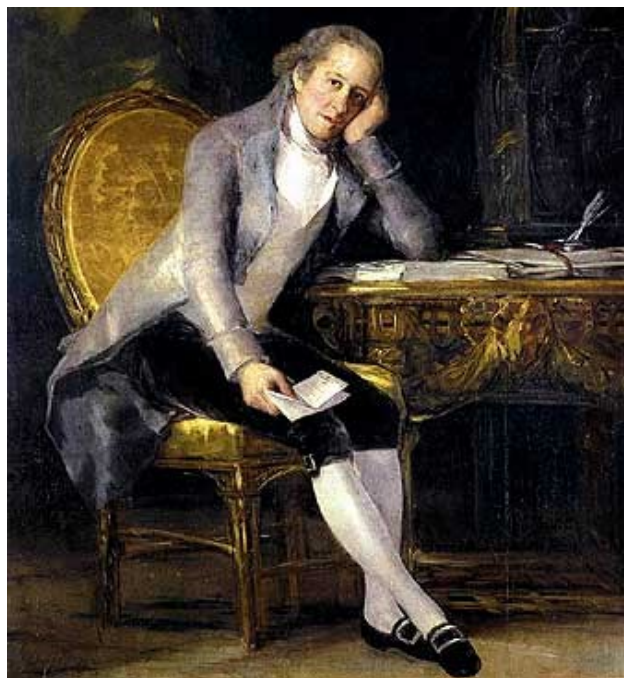
Retratado por Goya en 1781

Uno de nuestros más relevantes pensadores del siglo XVIII fue Gaspar Melchor de Jovellanos, enciclopedista perseguido por la Inquisición, autor de la primera historia de las fiestas hispanas