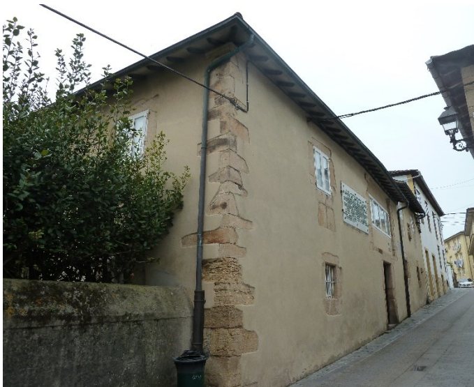
Casa Trelles (S. XVIII) en Puerto de Vega, donde fallecería Jovellanos en 1811 – D.E.Brisset