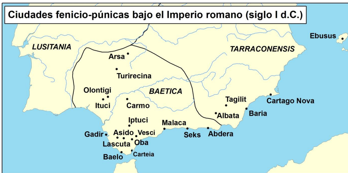
Fig. 1 – Ciudades de tradición fenicio-púnica a mediados del siglo I d.C. (época imperial). Mapa de elaboración propia.