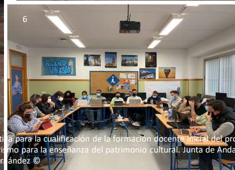
Proyecto Innovación e Investigación Educativa para la cualificación de la formación docente inicial del profesorado de Formación Profesional Hostelería & Turismo para la enseñanza del patrimonio cultural. Junta de Andalucía (2018-2023).

1. Aula específica del Ciclo Formativo Técnico Superior Gestión Alojamientos Turísticos IES La Rosaleda (Málaga) [6/02/2023]