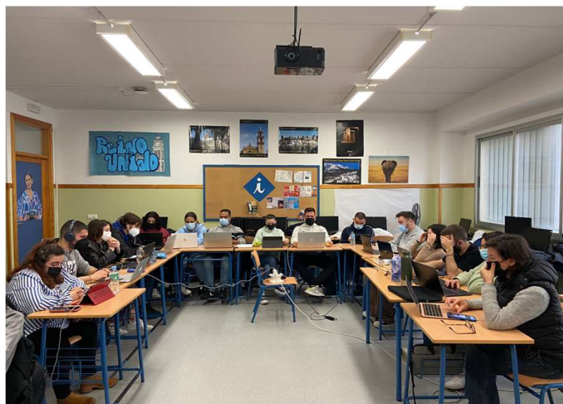
Aula polivalente Ciclo Formativo Técnico Superior Guía Información y Asistencias turísticas IES Vega de Mijas (Málaga) [6/03/2021] Proyecto Innovación e Investigación Educativa para la cualificación de la formación docente inicial del profesorado de Formación Profesional Hostelería & Turismo para la enseñanza del patrimonio cultural. Junta de Andalucía (2018-2023)

Comprender el patrimonio cultural como contenido de enseñanza del currículo vivo desde la perspectiva docente y con un enfoque de turismo sostenible