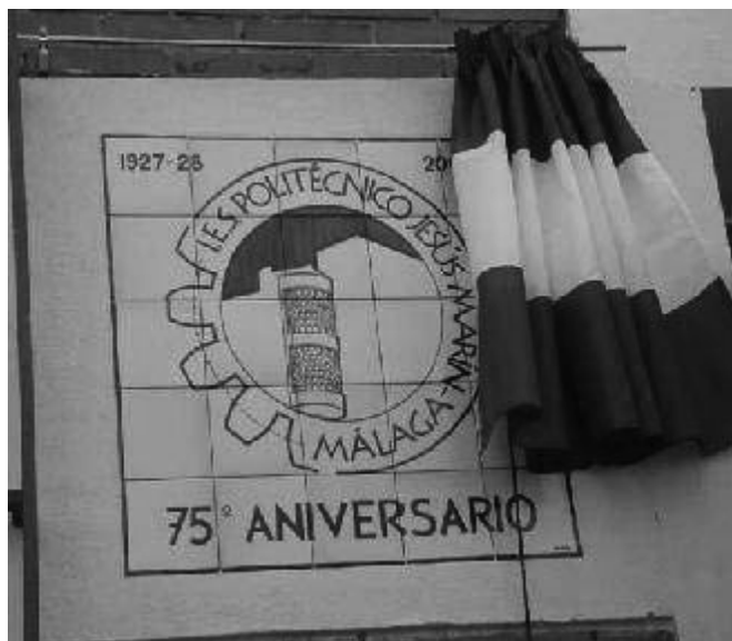
Figura 3. Azulejo conmemorativo del 75º aniversario del IES Politécnico Jesús Marín

En el curso 2002/03 el Instituto Politécnico celebró el 75 Aniversario de su creación con numerosos actos: exposiciones, conferencias, publicación de un libro, encuentros de antiguos alumnos y profesorado, celebraciones y materializaciones diversas. La comunidad educativa celebró las efemérides bajo el lema que hoy como entonces queremos que mejor defina nuestro estilo: Al servicio de la Enseñanza pública (Figura 3).