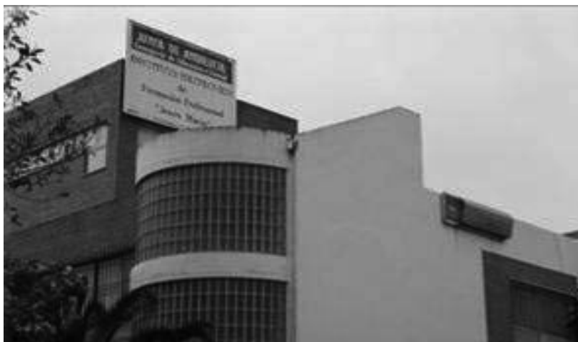
Figura 2: Fachada del Ies Politécnico Jesús Marín

En sus más de 75 años de historia, el centro ha ocupado cinco sedes pasando en 1979 a la barriada de Carranque, al edificio actual (Figura 2).