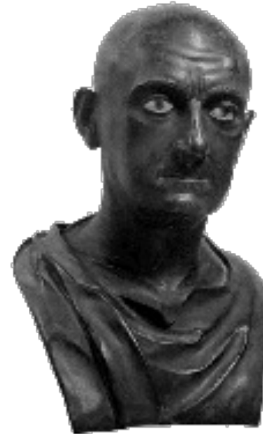
Plubio Cornelio Escipión