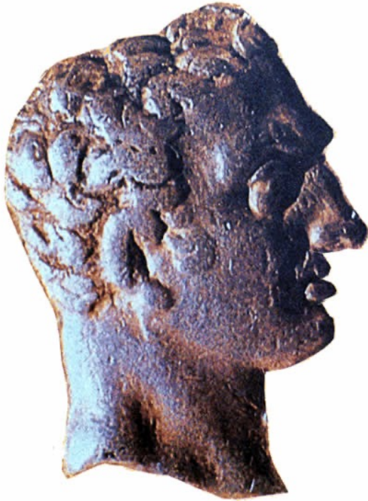
Busto de Aníbal en moneda