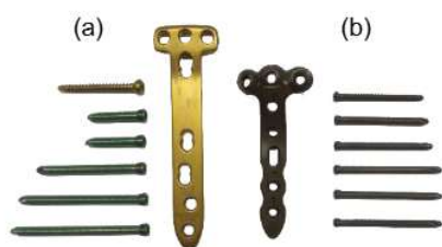
Figura 1: Grupos de estudio (a) TomoFix, (b) AxSOS.

En este estudio piloto se utilizaron 8 especímenes de tibia cadavérica (edad: 33-69 años). Tras practicarles una OTPAI biplanar con apertura de 7mm, fueron asignados aleatoriamente a un grupo de estudio (N=4) según el sistema de fijación (Figura 1): AxSOS (Stryker Iberia) o TomoFix (DePuy Synthes). Todas las placas se sujetaron al hueso con 6 tornillos de bloqueo bicorticales.