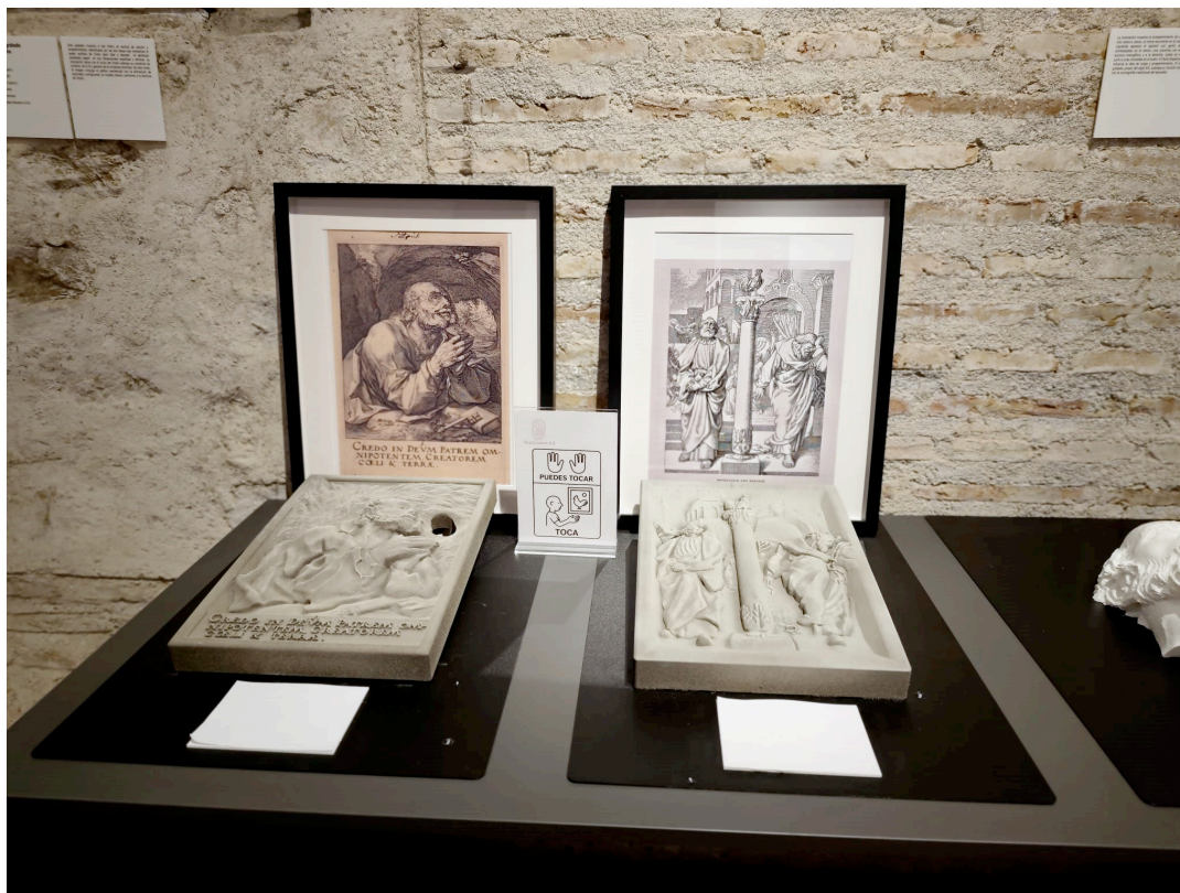
Fig. 4. A la izquierda, Hendrick Goltzius, San Pedro penitente , 1589. Reproducción de grabado, The Metropolitan Museum of Art. A la derecha, Repentance and Remorse , siglo XIX, anónimo. En la parte inferior reproducciones de ambos grabados, en versión táctil por Tifloactiva Innovación S.L., 2025. Esculpido y modelado en 3D. Impresión en PETG.

La sección dedicada al siglo XIX presentó xilografías anónimas de circulación popular, como Pedro niega a Jesús y Repentance and Remorse , en las que la retórica del pathos se simplifica para alcanzar un público amplio. La composición, dominada por la figura de la mujer acusadora y el gallo, condensa la secuencia narrativa en una escena de inmediatez dramática. Estas imágenes, reproducidas en catecismos y manuales de devoción, muestran cómo la iconografía petrina se adaptó a los nuevos medios de difusión gráfica, manteniendo su función didáctica.