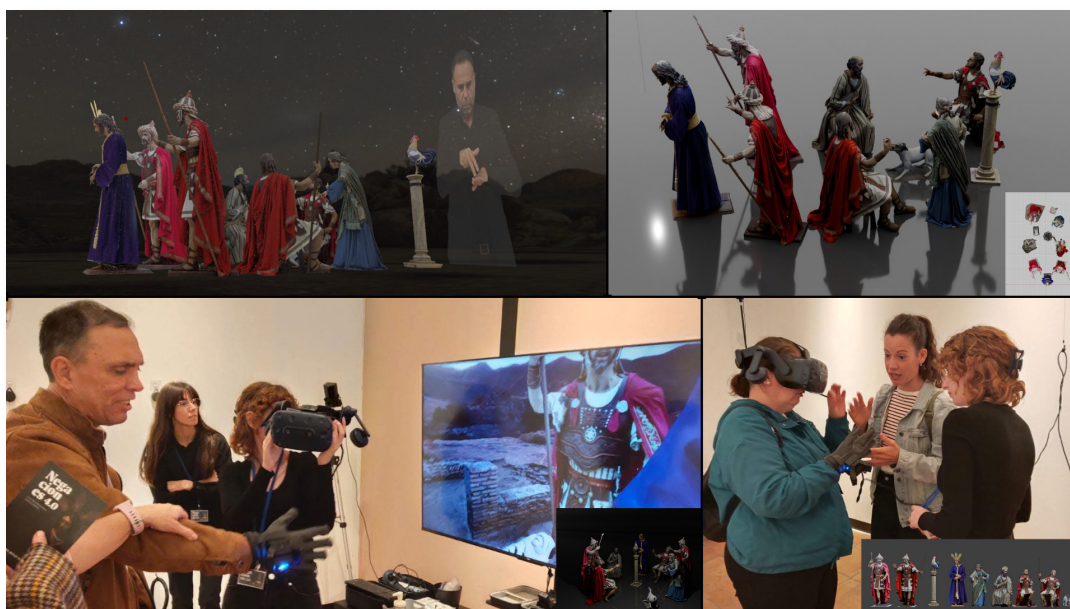
Fig. 2. Modelos tridimensionales obtenidos mediante fotogrametría del conjunto escultórico y experiencia multi-modal háptico-inmersiva. Proyecto Negaciones 4.0 (Universidad de Málaga, 2025).

Se combinó fotogrametría, escaneado tridimensional, modelado digital e impresión aditiva, permitiendo generar réplicas físicas y entornos virtuales de las nueve esculturas que integran el misterio procesional de las Negaciones y Lágrimas de san Pedro (Hermandad del Dulce Nombre, Málaga) [fig. 2]. El proceso de documentación tridimensional se concibió como una prolongación contemporánea del dibujo y del grabado devocional, medios históricos que fijaron el tipo iconográfico petrino (Ortega y Sacrista, 1968). La captura volumétrica y la reconstrucción digital de las figuras permitieron reinterpretar el gesto, la mirada y la expresividad moral de las imágenes, trasladándolas a un espacio de lectura multisensorial y accesible donde el pathos y la emoción se exploran desde nuevas dimensiones táctiles, sonoras y visuales.