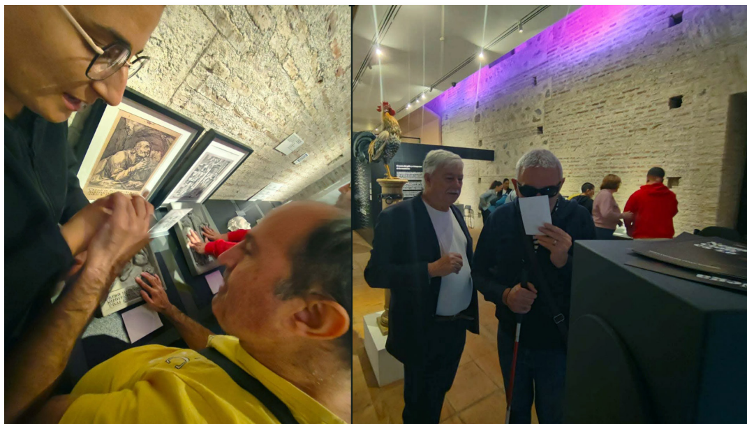
Fig. 3. Vista parcial de la exposición Negaciones 4.0: una muestra para los sentidos . Estaciones olfativas y táctiles del recorrido.