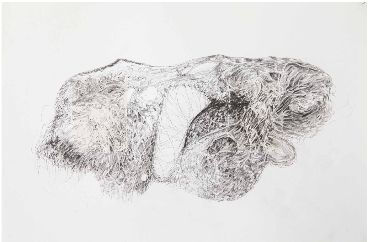
Figura 3. Unrooted (2022). Lápiz y lápiz de óleo sobre papel. 120 x 200 cm.