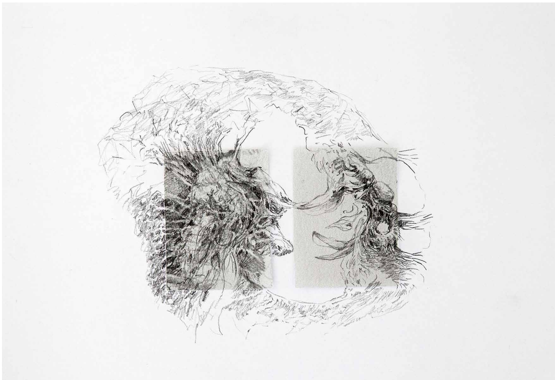
Figura 1. Cinta de Möbius (2022). Lápiz sobre fotocopias, cinta, tiras de madera blanda. 18 x 70 x 58 cm. aprox.