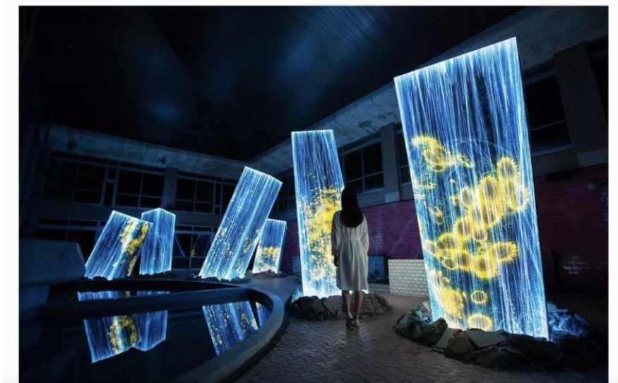
FIGURA 4. Megalitos en las ruinas de la casa de baño de TeamLab

Las piezas instalativas son creadas en tiempo real a través de un programa informático, que no se repite, sino que va mutando para cada espectador que la visita.