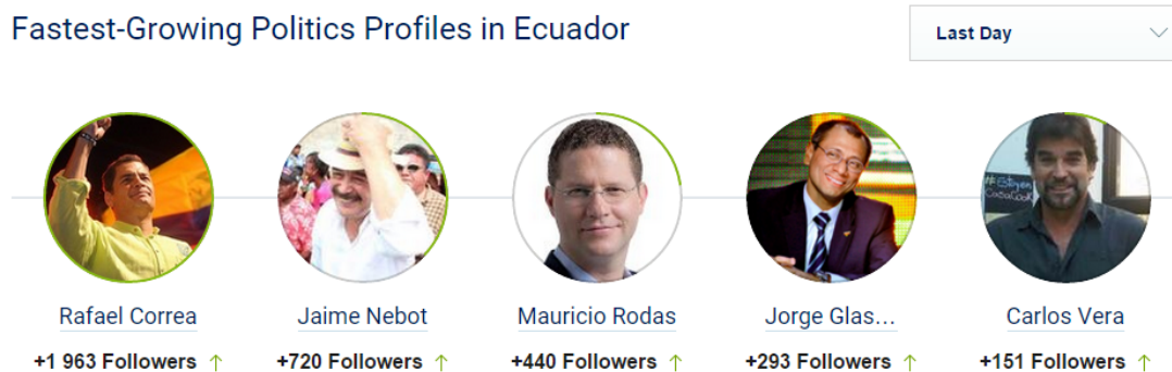
Gráfico N° 1 Crecimiento de figuras políticas en Ecuador

Según el portal Freedom House ( https://freedomhouse.org/report/freedom-net/2014/ecuador ) en Ecuador existe un aproximado de 2.500.000 usuarios en Twitter hasta mayo de 2014. Este mismo portal cita los políticos con mayor crecimiento en redes en Ecuador. Hasta el 19 de febrero de 2015 los cinco más populares en la Red son Rafael Correa (Presidente del Ecuador) con un avance de +1963 seguidores. Le sigue Jaime Nebot (Alcalde de Guayaquil y opositor a Correa) con +720. Posteriormente Mauricio Rodas (Alcalde de Quito y candidato a presidente en 2013) con +440. Luego Jorge Glass (Vicepresidente del Ecuador) con +293 y Carlos Vera (expresidentador de televisión y activista político) con 151 seguidores (SocialBakers, 2015).