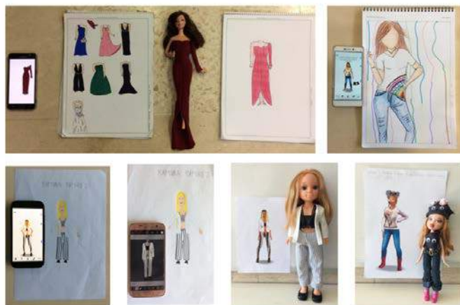
Figura 1 · Proceso del diseño.