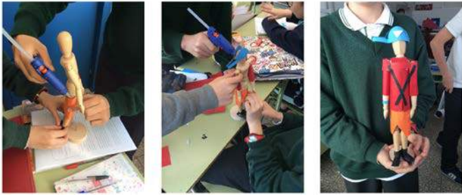
Figura 4 · Proceso del diseño.