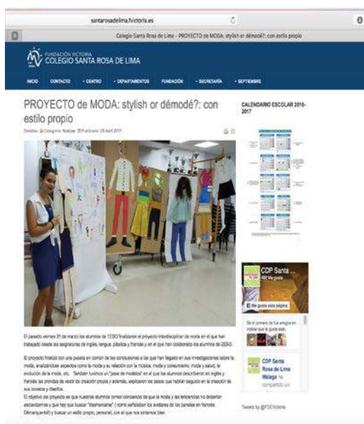
Figura 9 - Trabajo de investigación. Explicación análisis de las entrevistas, Explicación de las temáticas tratadas, En este caso se muestra a anorexia y el consumo.