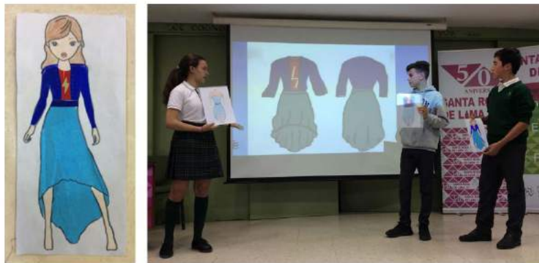
Figura 7 · Elaboración del proceso del diseño y confección final.