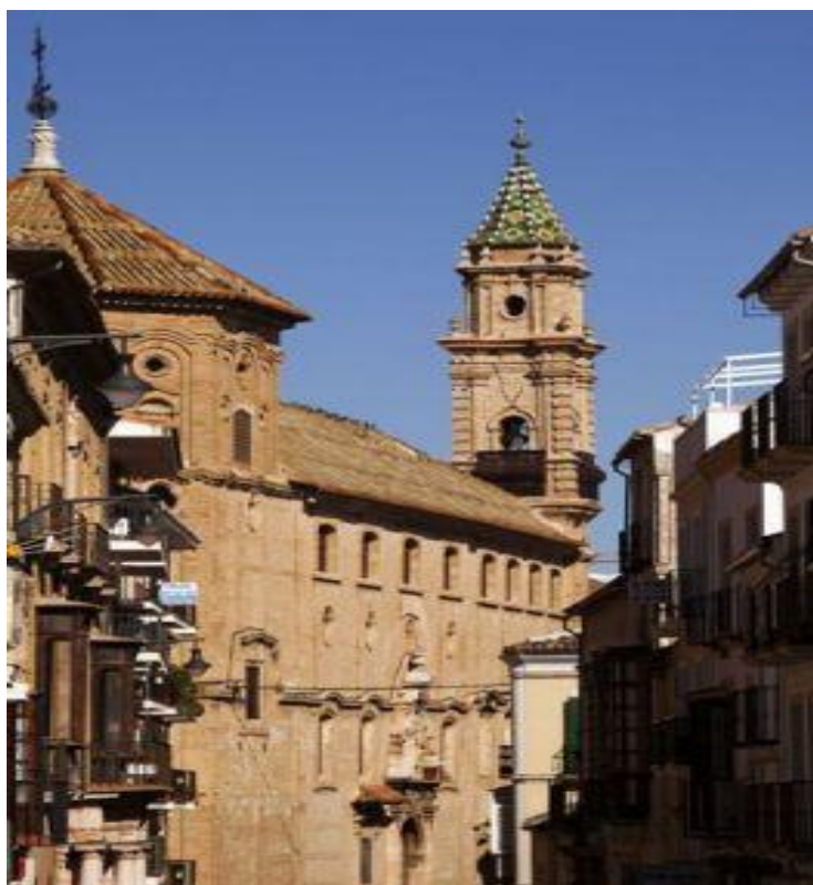
Imagen 12. Convento de Madre de Dios. (Convento de Madre Dios de Monteagudo, 2011)

Otra de las edificaciones religiosas más significativa para el turismo literario es el Convento de Madre de Dios.