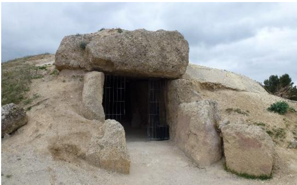
Imagen 10. El Dolmen de Menga. (El misterio del dolmen que mira a un gigante de piedra, 2015)

del Romeral. Sin embargo, la candidatura a pesar de lo que se pueda pensar no incluye solamente los Dólmenes sino que también incluye la ya aludida Peña de los Enamorados y El Torcal de Antequera. El nombre que se usa para englobar los tres espacios es Sitio de Los Dólmenes de Antequera. (Candidatura Piedra a Piedra)