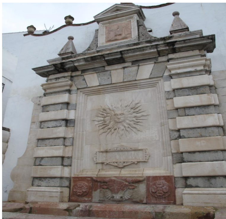
Imagen 6. La Fuente del Toro. (Alcazaba de Antequera)

En 1850 se le encargó a Lady Louisa Tenison que escribiera un libro de viajes sobre Andalucía y Castilla con el objetivo de que los británicos consiguieran enamorarse de sus lugares y sus calles. En su recorrido llegó hasta Antequera, una de sus misiones allí fue ver el “templo druida” descrito por Rafael Mitjana.