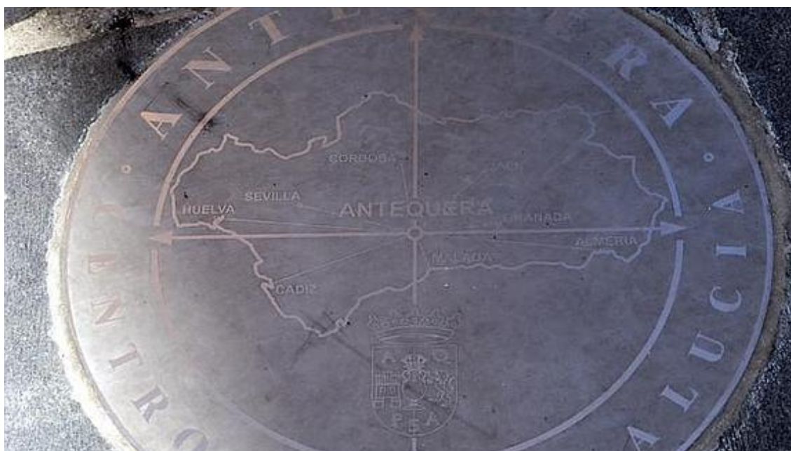
Imagen 4. Placa de un mapa de Andalucía situado en la Plaza San Sebastián. (Lara, 2016)

Antequera, antes llamada Antikaria por los romanos y Antaqira por los árabes, es una ciudad andaluza situada en el centro de la Comunidad Autónoma y por lo tanto es su principal cruce de caminos con Córdoba, Granada y Sevilla. Además, es la cabeza del municipio de Antequera integrado por Antequera, Alameda, Mollina, Casabermeja, Fuente de Piedra, Humilladero y Villanueva de la Concepción (El Municipio); es el mayor municipio malagueño en cuanto a extensión y el quinto municipio de España con una extensión de 749.3 km 2 y una población de 41.141 habitantes según SIMA (Andalucía pueblo a pueblo-Fichas Municipales, 2016).