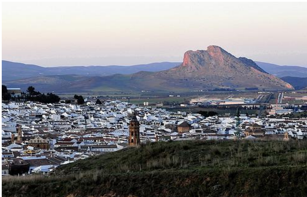
Imagen 9. La Peña de los Enamorados.