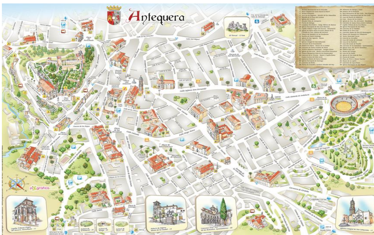
Imagen 8. Mapa Turístico de Antequera. (16Ju)

Existen, por tanto, una serie de lugares que pueden aprovecharse desde el punto de vista literario y contar su historia a través de los pensamientos de un escrito o lo plasmado en un libro.