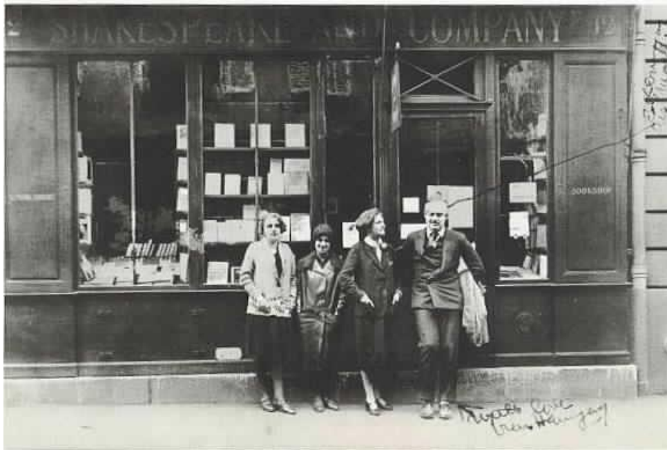
Imagen 3. Hemingway junto a Silvie Beach, una de los propietarios del establecimiento. (Boix, 2014)