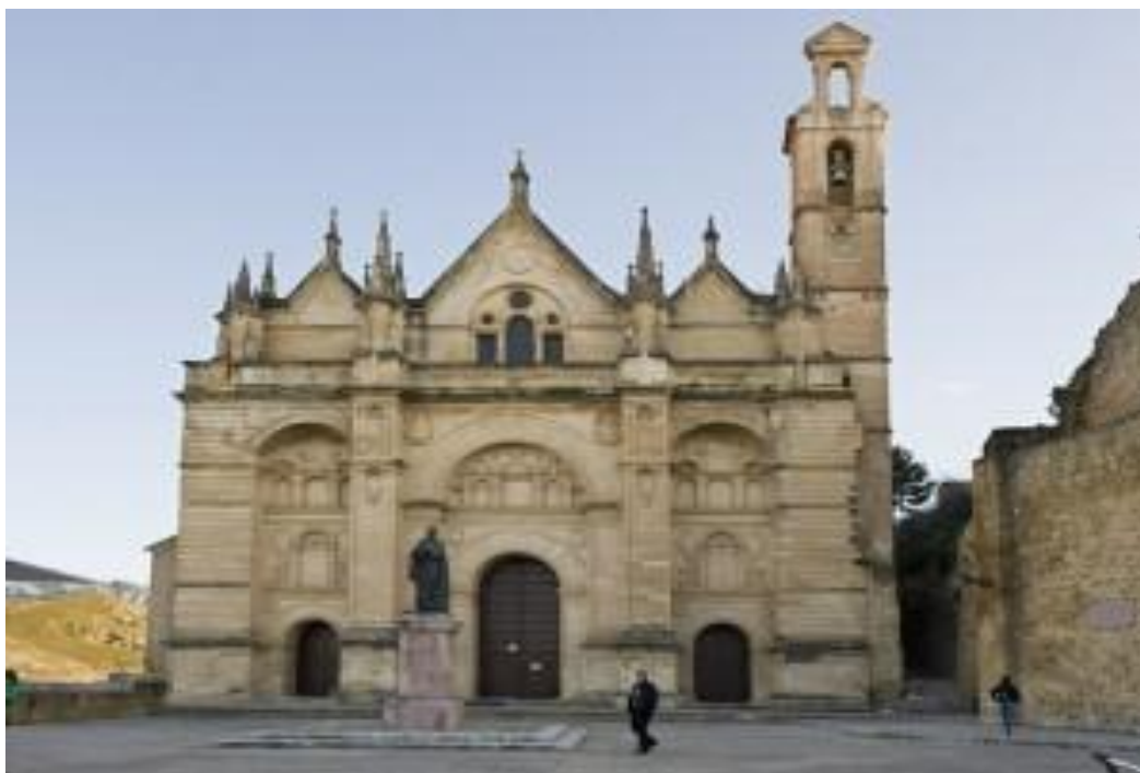
Imagen 13. Real Colegiata de Santa María. (Lugares de Interés en Antequera)

Aunque tanto el Arco de los Gigantes y la Alcazaba están incluidas en numerosos libros de viajes y en obras más actuales, lo que de verdad tiene importancia turístico-literaria es la Real Colegiata de Santa María.