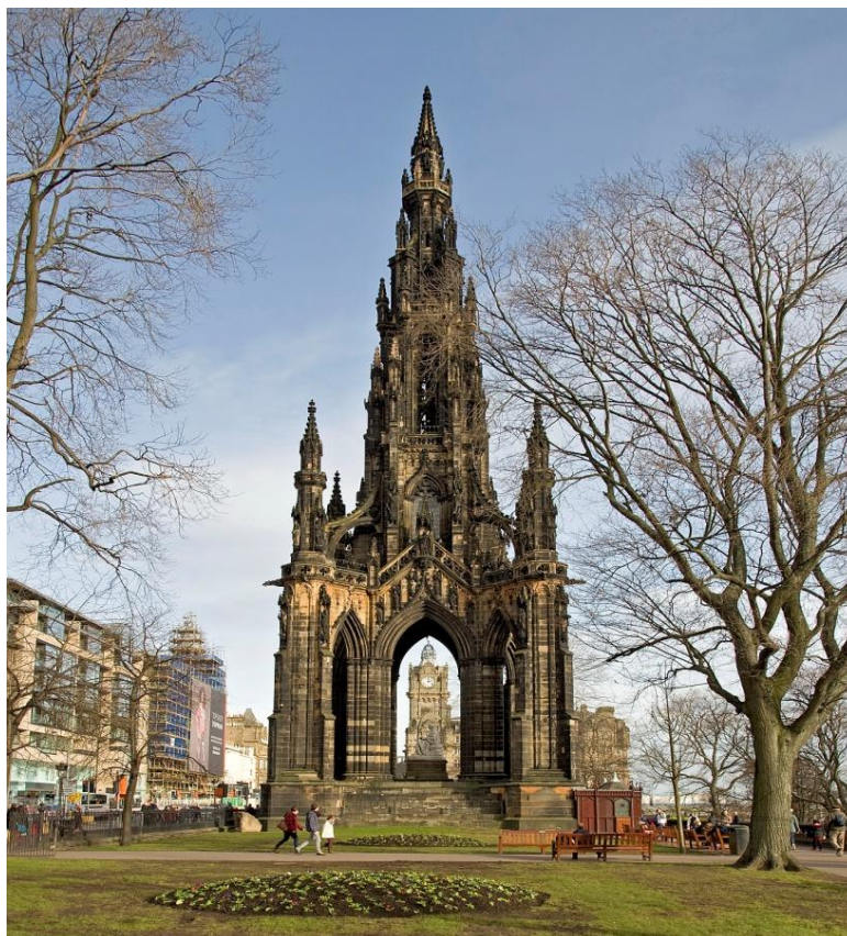
Imagen 2. Scott Monument. (Make room for Scott Monument in your trip to Edinburgh)

Los últimos componentes con los que consiguió el honor de ser nombrada la primera Ciudad Literaria dentro de la Red de Ciudades Creativas son, en primer lugar, el Man Booker International Prize es uno de los premios literarios más importantes de la literatura inglesa, celebrado anualmente en Edimburgo. Y, en segundo lugar, el Festival Internacional del Libro de Edimburgo, el mayor festivales literario del mundo. Tiene lugar todos los años en Agosto y tiene una duración de dos semanas en las que unos 800 autores y más de 225.000 visitantes se dan cita. (Edinburgh Book Festivals)