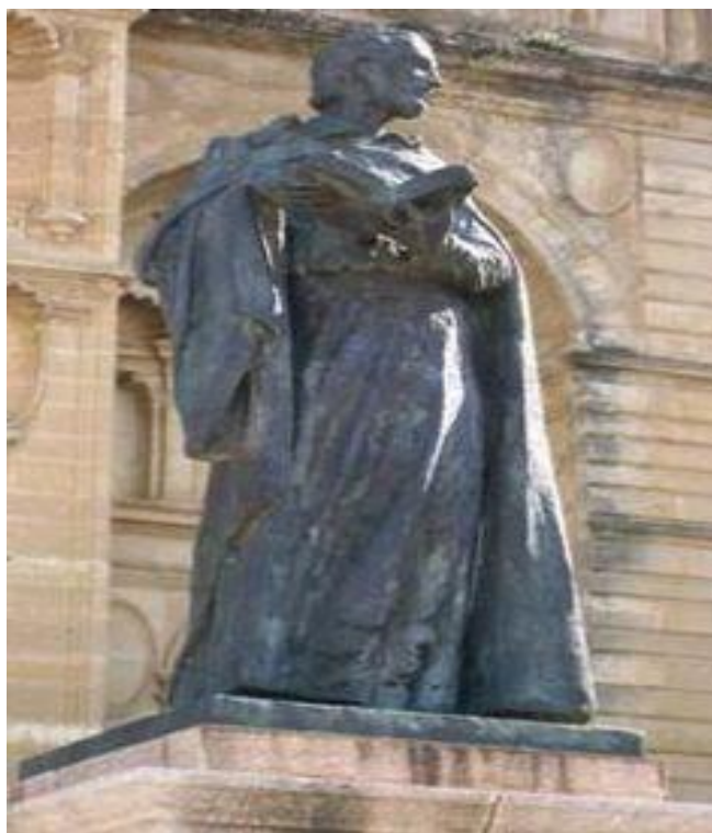
Imagen 7. Estatua del escritor Pedro Espinosa frente a la Real Colegiata.