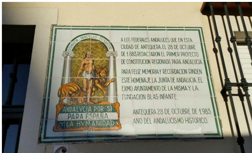
Imagen 5. Placa conmemorativa de la creación del primer proyecto de la Constitución Federal de Andalucía. (Tamara García Carmona, 2016)

Antequera es muy visitada por muchos españoles e incluso por muchos extranjeros gracias a que tiene una gran riqueza patrimonial y turística, y eso se refleja en las cifras de los visitantes que encuentran un hueco en sus vacaciones para visitar la ciudad. En 2015 se batió el récord de visitas con un total de 308.756 de los cuales 69.75% fueron de procedencia nacional. Por su parte los extranjeros que decidieron ir fueron en su mayoría británicos, franceses y alemanes. Estos datos son recogidos a la entrada de los ocho principales lugares turísticos como los ya mencionados Dólmenes de Antequera, la Alcazaba, la Real Colegiata de Santa María y el Torcal de Antequera (Antequera, récord de visitas turísticas el pasado año 2015, 2016); su creación se remonta a hace 200 millones de años y, además, es uno de los parajes kársticos más impresionantes de Europa. (Acerca de El Torcal)