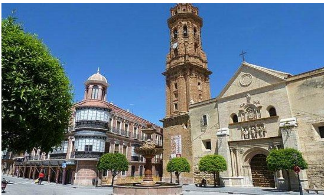
Imagen 11. Iglesia de San Sebastián. (Plaza San Sebastián)

La Iglesia de San Sebastián fue incluida en el libro de Manuel de Lope titulado La Puerta Iluminada como uno de los edificios que más llamó su atención por encima de los más conocidos por los visitantes (Pérez Mateo, 2015).