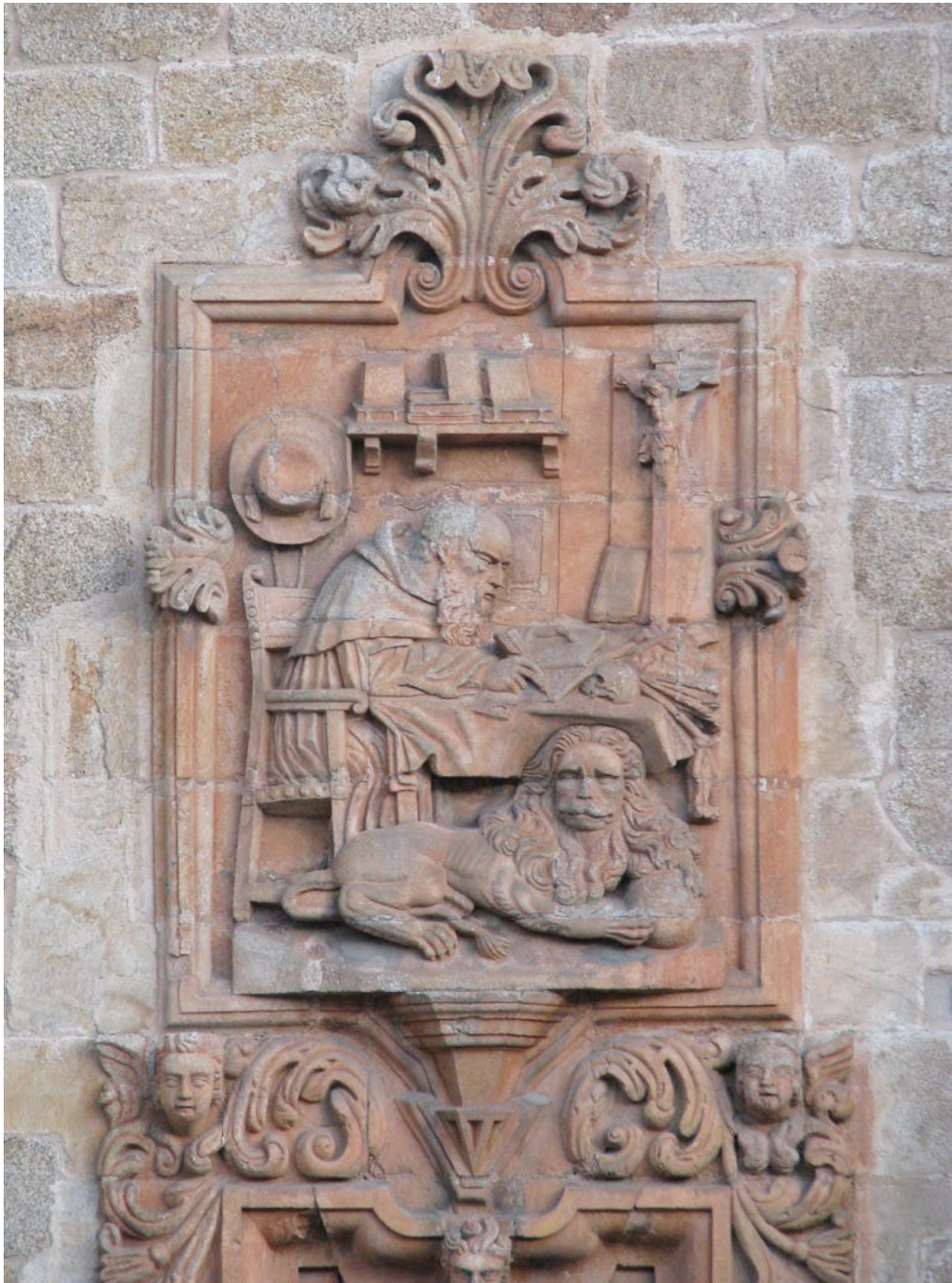
Figura nº 2.- Imagen relivaria de San Jerónimo en su celda, situada en el sector izquierdo de la fachada