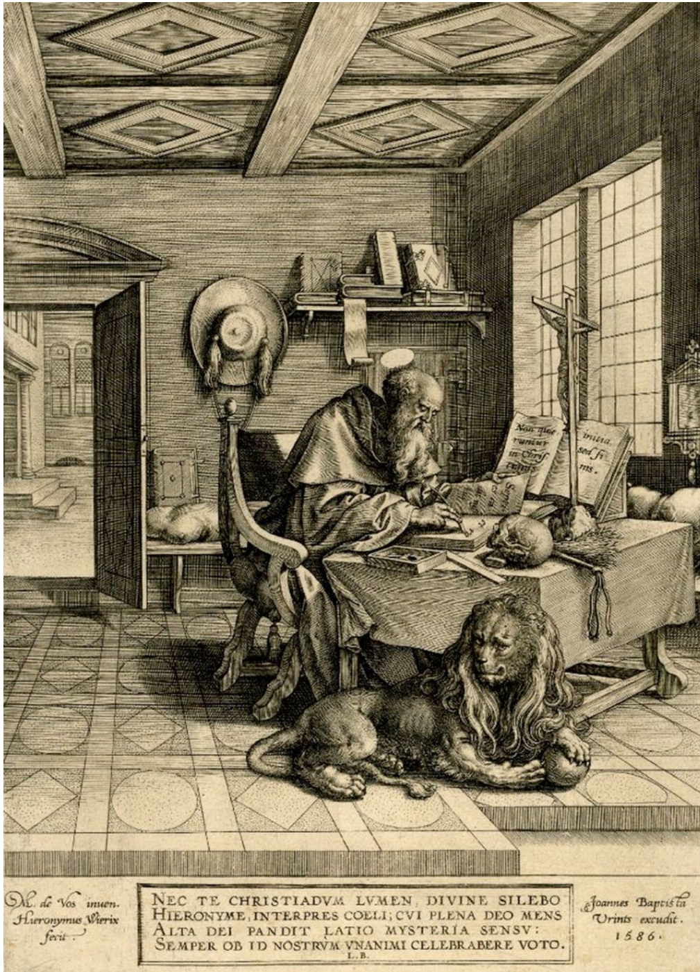
Figura nº 3.- Maarten de Vos. San Jerónimo. c. 1586.