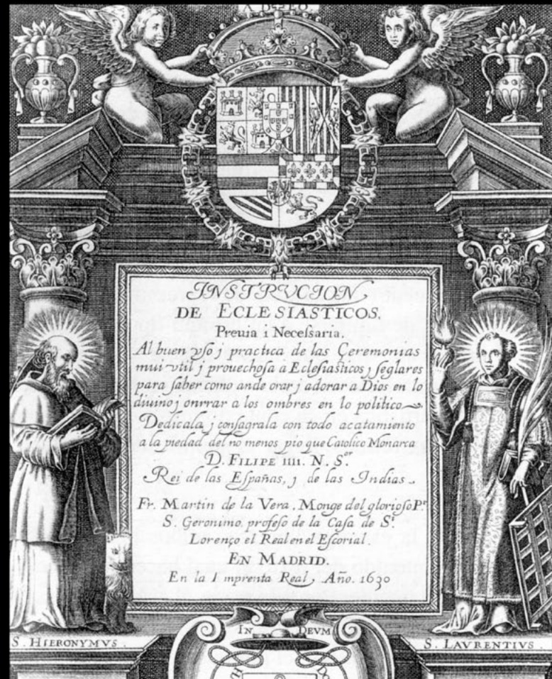
Figura nº 4.- Figura de San Lorenzo, diácono y mártir, emplazada en el lado derecho de la fachada, y frontispicio grabado por Jean de Courbes para la Instrucción de eclesiásticos de fray Martín de la Vera (Madrid, 1630). Montaje infográfico realizado por Roberto Novo Sánchez ( www.novodesenho.net ).