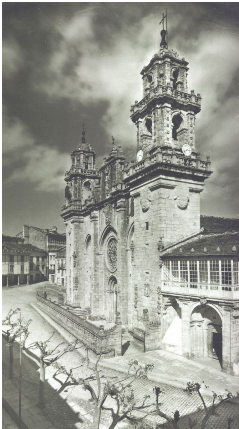
Figura nº 1.- Fachada occidental y atrio de la catedral de Mondoñedo antes de la reurbanización de la plaza mayor. Traza de fray Agustín de Otero. 1717