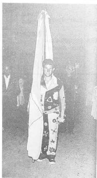
Foto 3.- Cascaborras de Guadix-Baza (Granada).