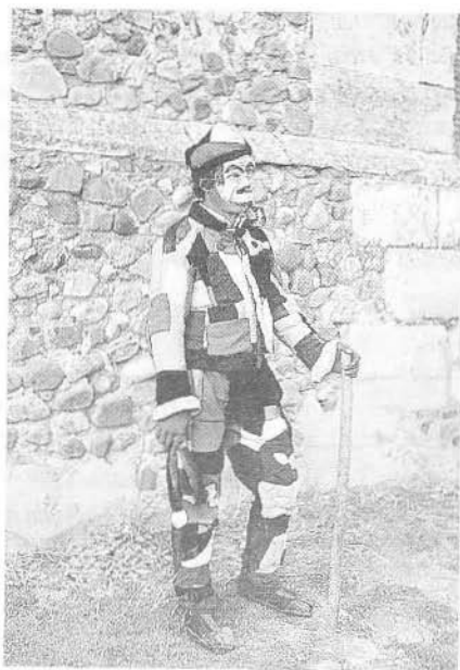
Foto 1.- Botarga de Valdeñuño-Fernández (Guadalajara).