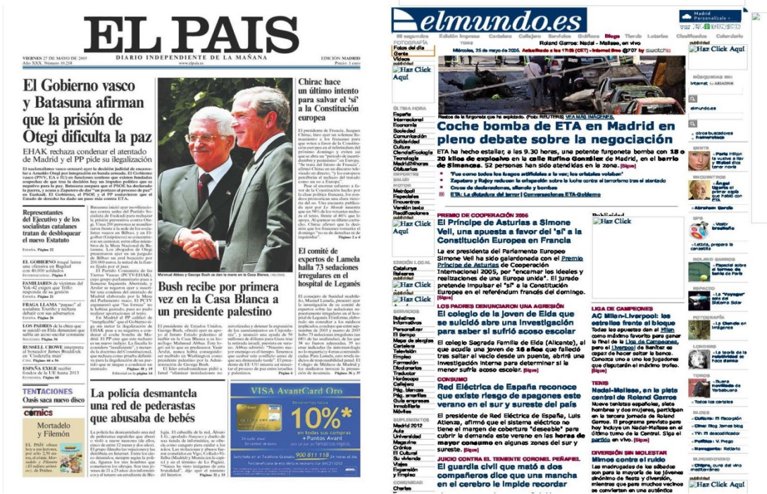
Imagen 2: Portadas en papel y digital de El País y El Mundo tras la muerte de Cristina.

La muerte de Cristina se publicó el mismo día de autos en los periódicos digitales y en las fechas siguientes en los diarios impresos, aunque tuvo más repercusión en los medios audiovisuales que en la prensa, pese a que solo habían transcurrido unos meses desde la muerte de otro menor que había sufrido bullying (Jokin). Aquel 26 de mayo, un juez encarceló al líder de la ilegalizada Batasuna Arnaldo Otegi por un delito de integración en la banda terrorista ETA, que reaccionó explotando un coche bomba en Madrid que dejó cinco heridos leves en pleno debate sobre la negociación del proceso de paz. La policía desmanteló una red de violadores de bebés que distribuían las imágenes entre pedófilos a través de Internet. En clave internacional, Bush recibía por primera vez en la Casa Blanca a un presidente palestino.