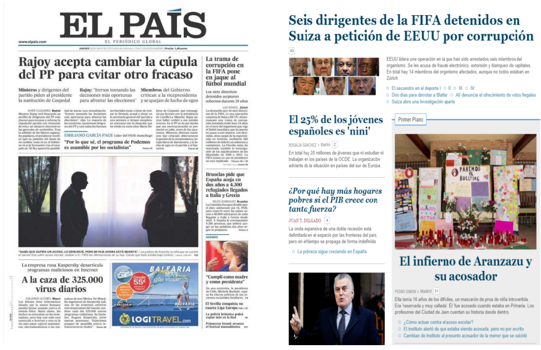
Imagen 5: Portadas en papel y digital de El País y El Mundo tras la muerte de Arancha.

como noticia nacional destacable, una madre acabó con la vida de su hijo de 5 años. En el plano internacional, Grecia se negaba a pagar al FMI los 1.600 millones del rescate argumentando que el dinero “ya no está” y las detenciones de seis dirigentes de la FIFA.