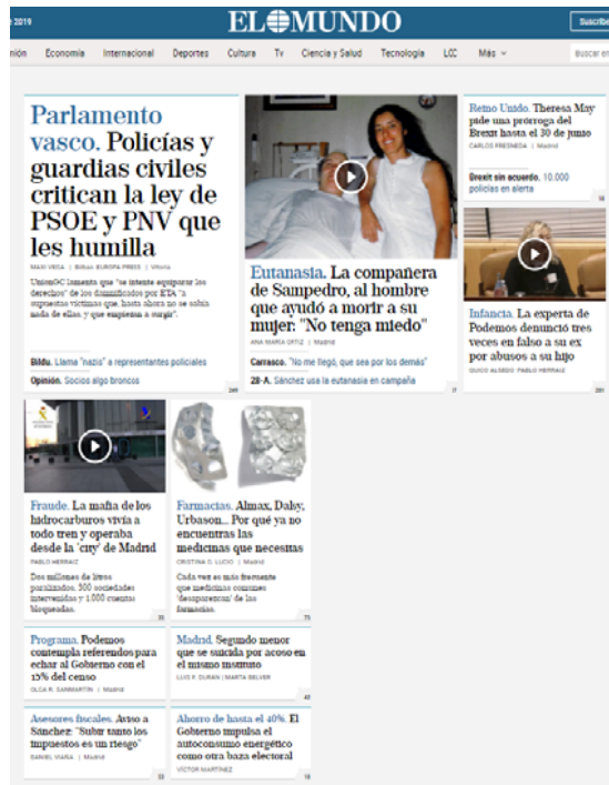
Imagen 8: Portadas en papel y digital de El País y El Mundo tras la muerte de Andrés.