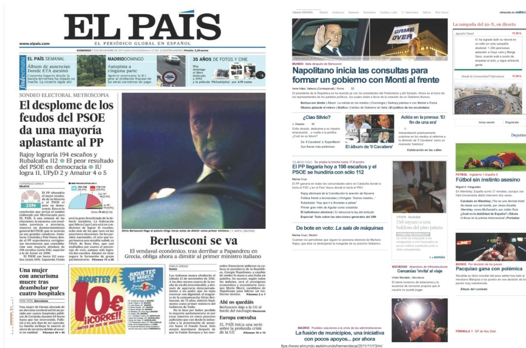
Imagen 3: Portadas en papel y digital de El País y El Mundo tras la muerte de Mónica.

El contexto informativo estuvo marcado por los sondeos y la campaña electoral previa a los comicios del 20-N, en los que Mariano Rajoy (PP) fue elegido presidente del Gobierno. En el panorama internacional, la principal noticia en esas fechas era la dimisión del primer ministro Silvio Berlusconi y sus efectos en el gobierno de Italia. El País (2011) habla en su editorial de una Europa en crisis por la recesión económica que comenzó en el año 2008.