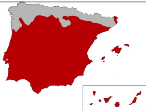
Superficie con clima mediterráneo de la península Ibérica, Canarias y Baleares.