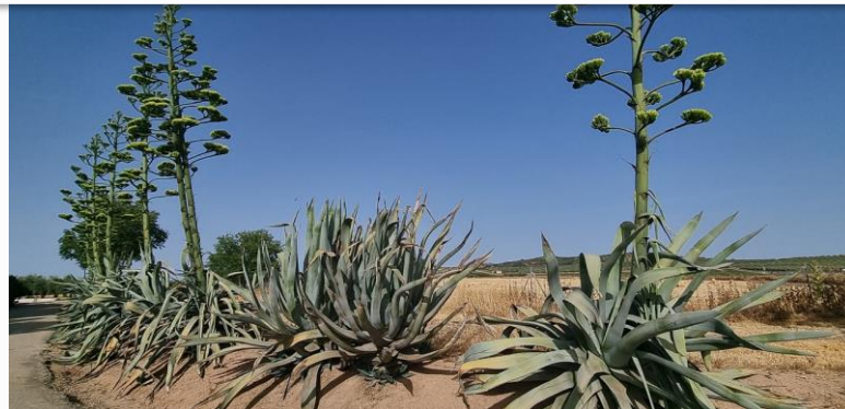
Ejemplares de Agave americana en Torredonjimeno (Jaén).