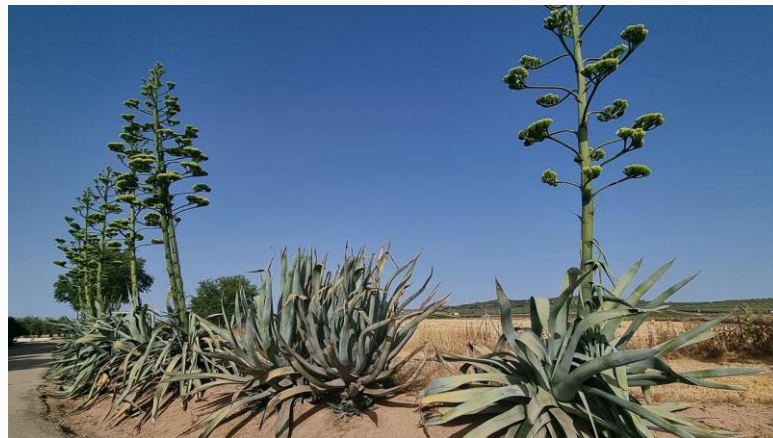
Ejemplares de Agave americana en Torredonjimeno (Jaén).