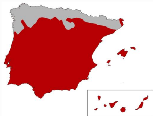
Superficie con clima mediterráneo de la península Ibérica, Canarias y Baleares.