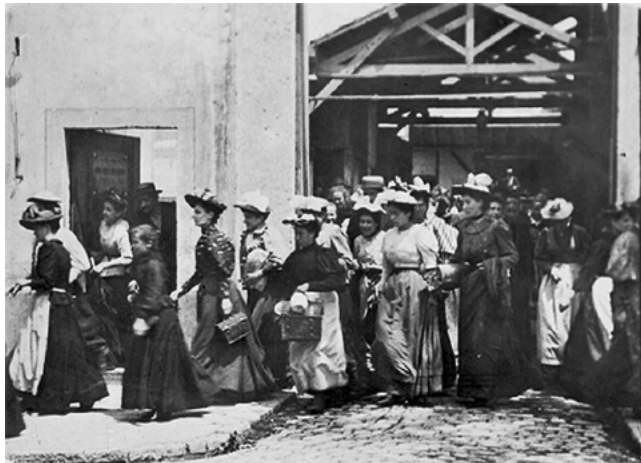
Louis y Auguste Lumière, "La sortie des ouvriers des usines Lumière à Lyon Monplaisir"