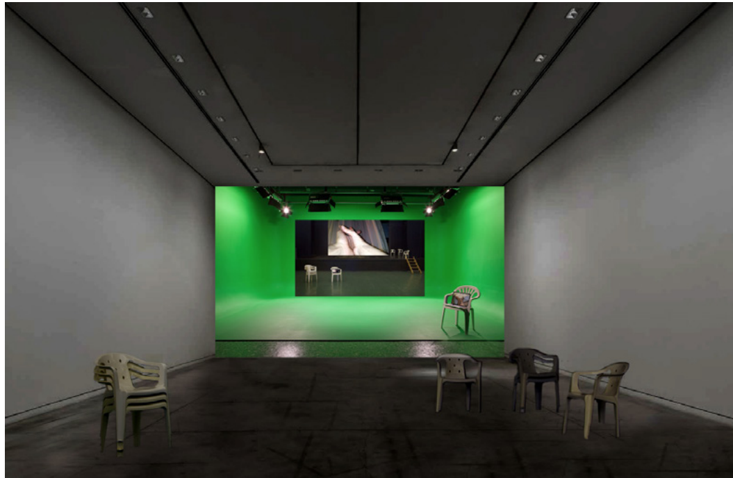
Boceto de la instalación en sala