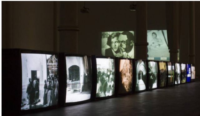
Harun Farocki, "Arbeiter verlassen die Fabrik"

En 1895 los hermanos Louis y Auguste Lumière mostraron en París su película "La sortie des ouvriers des usines Lumière à Lyon Monplaisir" (Salida de los obreros de la fábrica Lumière en Lyon Monplaisir). La importancia de esta grabación es capital por constituir uno de los orígenes del cine. Asimismo como documental, aunque breve, es interesante por la carga de connotaciones políticas, históricas, además de cuestiones formales como el encuadre y punto de vista frontal de la salida de unos obreros ordenados y alineados de forma predeterminada por quien pretende capturar la imagen.