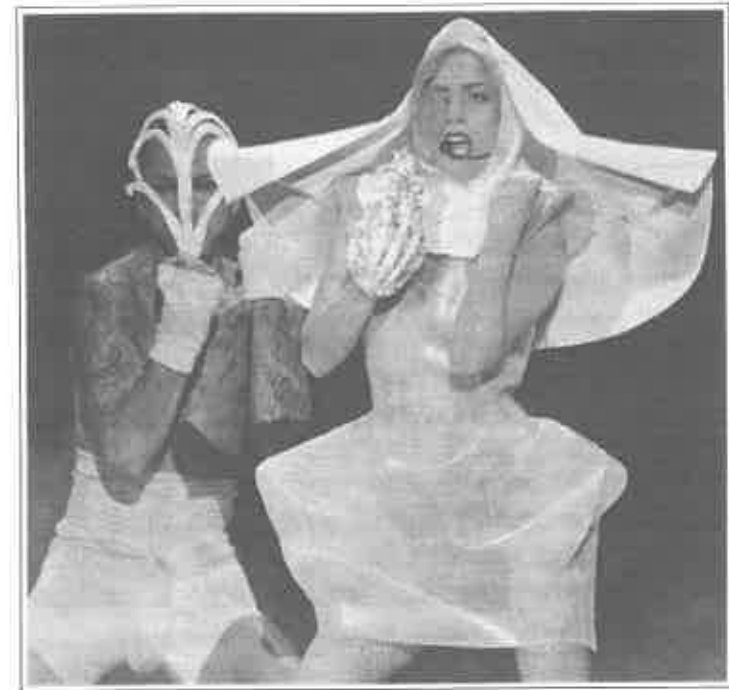
Figura 3. Lady Gaga en concierto.

“La característica más prominente de la sociedad de consumidores —por cuidadosamente que haya sido escondida o encubierta— es su capacidad de transformar a los consumidores en productos consumibles” (Bauman, 2007a: 25-26). Es decir, transformarse en un producto deseable y deseado. Se viene hablando de la extimidad , entendida como hacer externa la intimidad, enseñando lo que se quiere de aspectos de la vida de las personas que hasta hace poco quedaban relegados a la propia intimidad y a los más cercanos. El ejemplo extremo fue una concursante del reality show Gran Hermano , en su versión inglesa, Jade Goody que triunfó, se enamoró, casó y agonizó ante el mundo. En este sentido, los iconos de esta sociedad (actores y actrices de éxito, futbolistas y modelos que están en el candelero) se están convirtiendo en productos no sólo en el sentido de creaciones de marketing para el espectáculo y las cuantiosas sumas de dinero que le ofrecen por ello, sino que se venden como productos que incluso se exponen en los escaparates de las llamadas ‘redes sociales’.