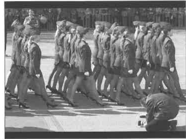
Figura 2. "Gratificación y represión. La doble instancia".

dad...) y la identidad individualizada propia de las estructuras modernas (Hernando, 2000: 122).