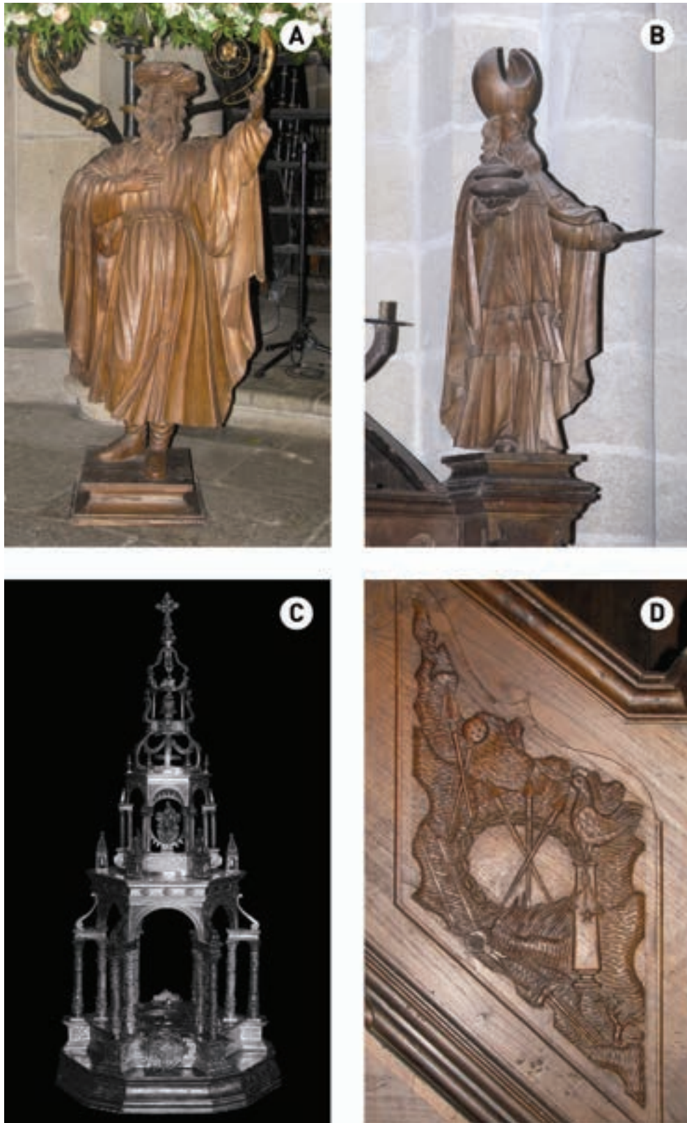
Fig. 3. Imágenes de Abraham (A) y Melquisedec (B). Custodia procesional de la catedral de Tui. Juan de Nápoles, Miguel de Mojados y Marcelo de Montanos. 1602 (C). Relieve con Arma Christi (D).