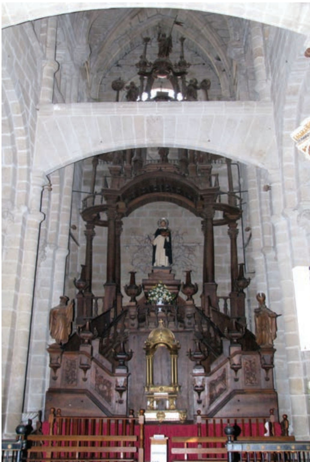
Fig. I. Catedral de Tui. Monumento de Semana Santa. Juan Luis Pereira. 1775.