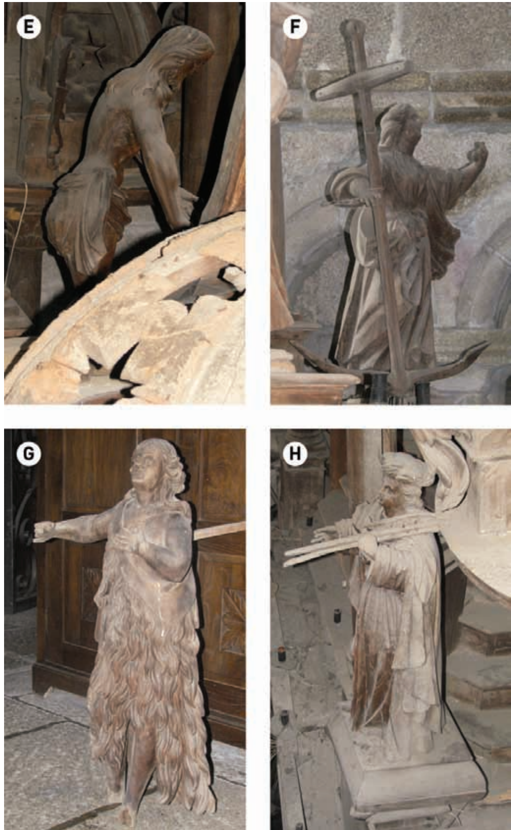
Fig. 4. Figuras del Ecce Homo (E), la Esperanza (F), Abel (G) e Isaac (H).