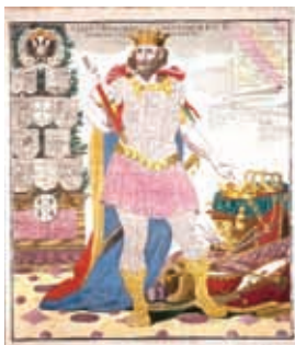
IMAGEN DE PORTADA: Mathäus Seutter, Europäische Monarchien Statua Regum Europaeorum , hacia 1755, grabado calcográfico coloreado, 58,9 x 50,2 cm. Deutsches Historisches Museum, Berlín.