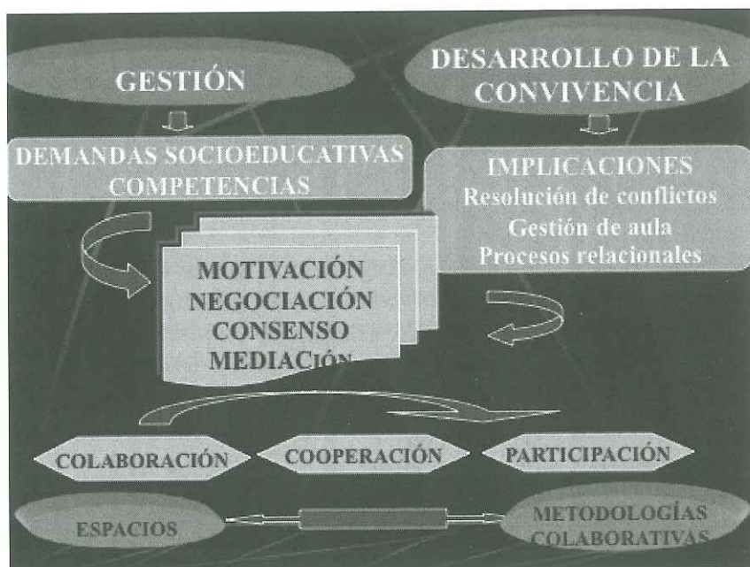
Figura 1. Dimensiones para la gestión y desarrollo de la convivencia (elaboración propia).

Ambos ejes confluyen en cuatro dimensiones que delimitan las propuestas metodológicas que se generan en las situaciones de afrontamiento de las situaciones conflictivas en los centros educativos, en las instituciones y organizaciones: la motivación, la negociación, el consenso y la mediación. Dado que la descripción de estas cuatro dimensiones haría demasiado extenso este capítulo, tan solo se aludirá a aquella que se precisa inexorablemente cuando alguna de las tres anteriores han tenido un leve efecto en la resolución de las situaciones y que evidencia la necesidad de incorporar la cultura de la mediación en los procesos de mejora de la convivencia en el ámbito escolar, precisamente para promover la provención y prevención de los conflictos en los centros y aportar herramientas y dimensiones para su resolución.