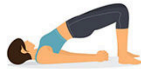
6.- Medio Puente