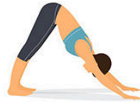
3.- Perro boca abajo