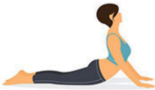
4.- La Cobra