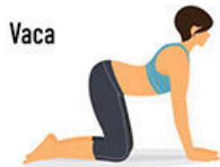
2.- Gato / Vaca