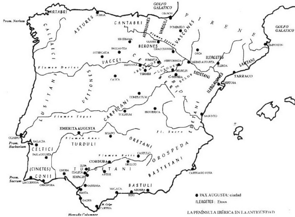
Fig. 1 Mapa de Iberia (de P. Ciprés, en G. Cruz Andreotti, coord., Estrabón e Iberia: Nuevas perspectivas de estudio , Málaga, 1999, p. 211)