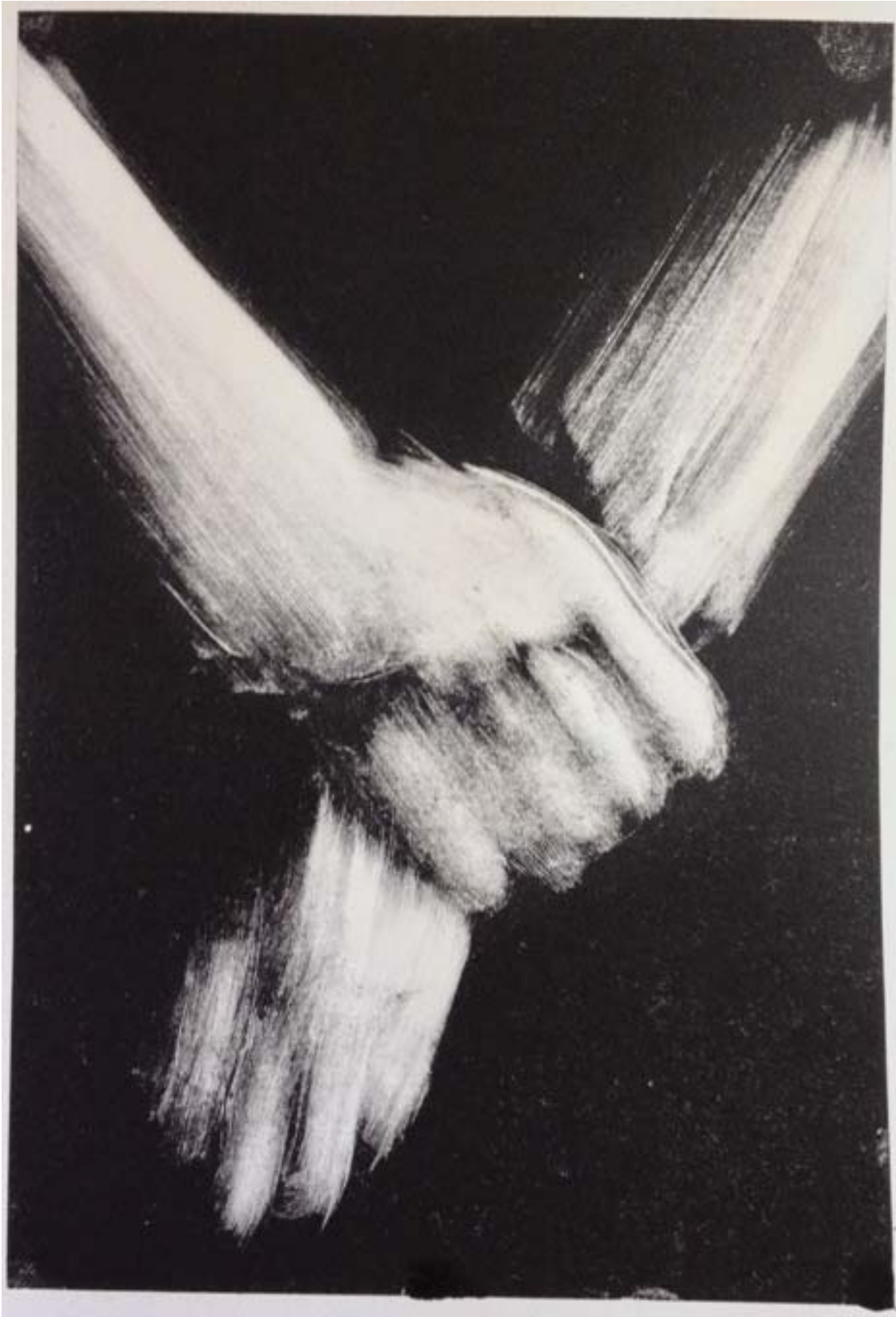
Monotipo, Carlos Casado Arroyo.