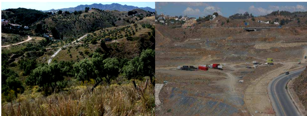
Figura 9. Colinas del Limonar, antes y durante su urbanización.

Los que podemos denominar como paisajes picassianos malagueños no se han beneficiado, por el escaso conocimiento de estas obras, del reconocimiento como escenarios de manifestaciones culturales de un autor de importancia universal como Picasso. Al contrario, tanto la bahía de Málaga como los Montes de Málaga están siendo objeto de drásticas transformaciones territoriales, bien de forma generalizada o bien de forma puntual, según cada caso.