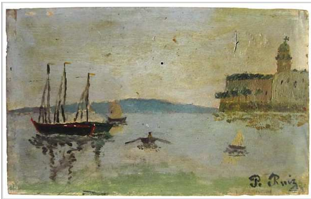
Figura 6. Crepúsculo en el puerto de Málaga, Pablo Ruiz Picasso. 1889. Colección particular

Las obras de Picasso genéricamente tituladas Montañas de Málaga proceden de una etapa de su formación algo más avanzada. Durante su estancia familiar en 1896 en los Montes de Málaga, en el lagar de Llanes, Picasso realizó diversas obras de temática paisajística, reproduciendo los paisajes montañosos del entorno del lagar, un “exhaustivo reportaje de los alrededores de Málaga” (Ocaña, 1994: 68). Aunque en total suponen unas 20 obras, las dos más importantes recibían la denominación (Picasso no solía poner títulos a sus obras) de Paisaje Montañoso y Paisaje con matorrales, aunque actualmente han sido ambas denominadas, con algo más de criterio, como Montañas de Málaga, aunque una denominación más afinada