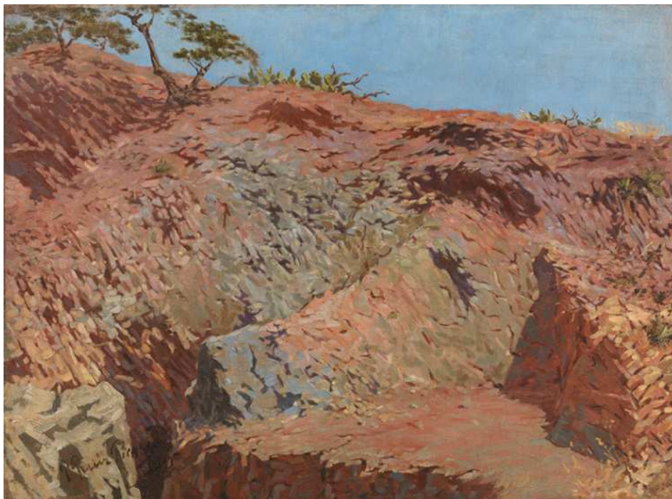
Figura 7. Montañas de Málaga. Pablo Ruiz Picasso. 1896. Óleo sobre lienzo. Museo Picasso Barcelona

La elección del espacio reproducido en estas obras nos habla, además del interés puramente pictórico que le generara, de una atracción del autor por los paisajes de su estacional entorno vital, y que contrasta con una aproximación más distante que los percibiría como laderas erosionadas y con escasa cubierta vegetal. Esa relación afectiva con este espacio montañoso se encuentra relativamente extendida entre numerosos habitantes de la ciudad, antiguos moradores de estos terrenos tradicionalmente humanizados en los que desde antiguo se cultivaban sus laderas, existía un considerable grado de poblamiento y generaron importantes manifestaciones culturales, como los cantes y bailes de verdiales. Unos valores culturales interiorizados por la población pero que no se han traducido en protección para el territorio que ocupan o del que surgen. En este sentido, el que se haya protegido la parte de los Montes de Málaga repobladas con pinares, ha desempeñado un efecto contrario sobre el resto de esta unidad fisiográfica, precisamente la que concentra mayores contenidos culturales.