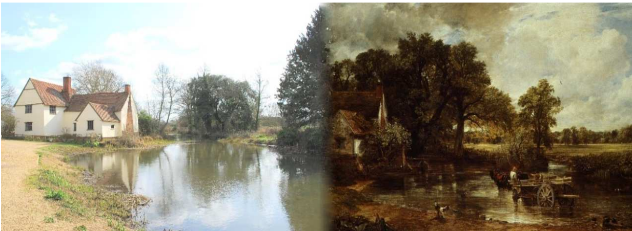
Figura 2. Flatford hill en la actualidad Figura 3. El carro de Heno. 1821. National Gallery Londres