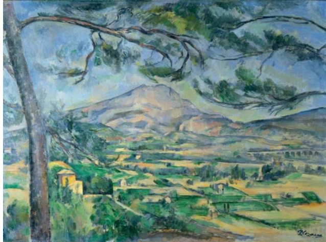
Figura 4. Paul Cezanne: La Montagne Sainte-Victoire au grand pin . 1887

Sin embargo, a pesar de este valor, que se traduce en numerosos beneficios económicos para las localidades de su entorno, en 2009 las vistas a la montaña estuvieron bajo la amenaza de un trazado ferroviario de la línea de alta velocidad que conectaría, directamente, Aix con Niza, y que discurriría precisamente por el entorno meridional de la montaña, es decir, atravesando las vistas reflejadas en los cuadros de Cézanne. La polémica y el consiguiente movimiento de rechazo generado condujeron, finalmente, a abandonar esta alternativa de trazado y a elegir el trazado sur, más largo pero que pasaría por localidades como Toulon o Cannes. Más que el valor de la montaña, protegida desde 2004, fueron sus representaciones en la obra de Cézanne las que detuvieron la transformación de su entorno. Se da la circunstancia de que la propia obra de Cézanne, de alguna manera, entró, premonitoriamente, en la polémica ferroviaria. Furioso por la construcción de una línea férrea en las cercanías de su casa, pintó de nuevo a la montaña, pero situándola en plano lejano, y resaltando el talud que provocaba el trazado ferroviario, en la obra La Tranchée avec la Montagne Saint-Victoire , de 1887 (fig.5). Como recoge Arnau (2011), Cezanne entendía el paisaje como expresión de su emoción, su petitesensation .