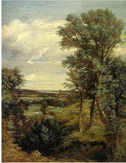
Figura.1. El Valle de Dedham. 1802. Óleo sobre lienzo. Victoria and Albert Museum, Londres