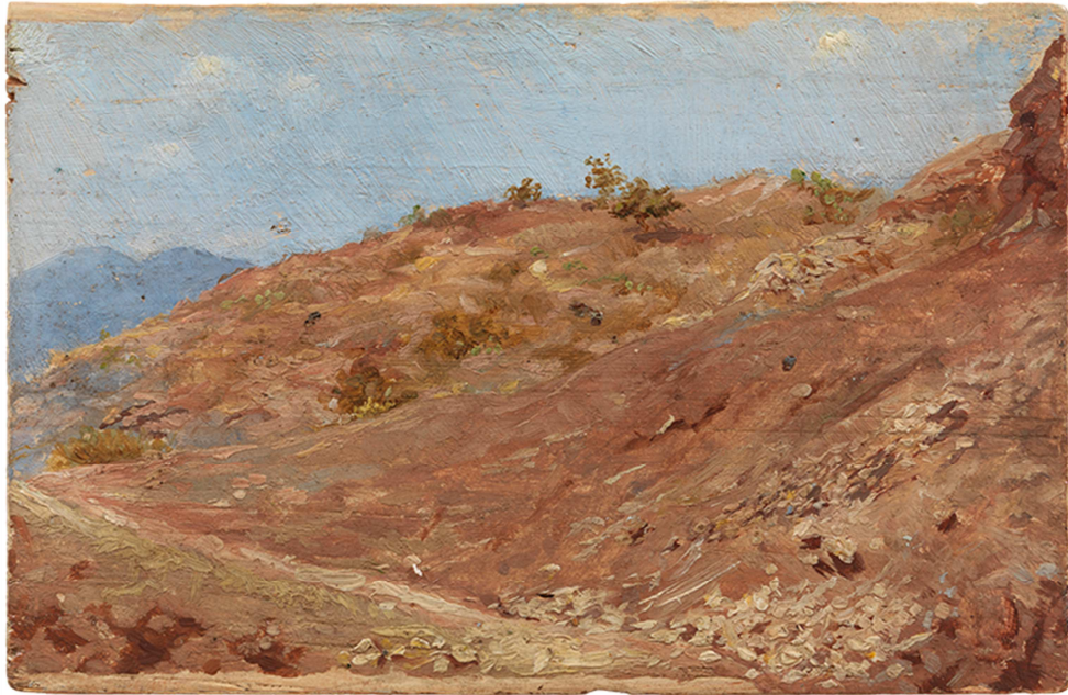
Figura 8. Montañas de Málaga. Pablo Ruiz Picasso. 1896. Óleo sobre tabla. Museo Picasso Barcelona