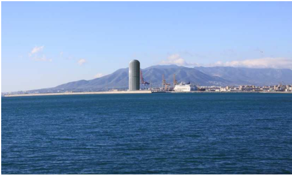
Figura 11. Simulación fotográfica a escala del rascacielos previsto en el puerto de Málaga. Foto: Matías Mérida. Fisonomía edificio tomada de A. Cappa.

paisaje, como las numerosas vistas de la ciudad desde el mar o, más particularmente, las realizadas desde la propia bahía, como la obra de Picasso que exponemos en este trabajo.