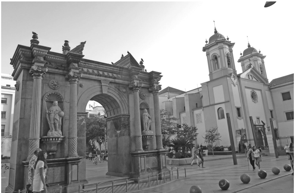
Fig. 1. Vista actual de la zona donde estuvo enclavado el hospital real de Ceuta, con la reconstrucción de la portada y la iglesia de San Francisco al fondo.

Pero si volvemos, de nuevo, a los inicios constructivos del hospital real debe considerarse de antemano que no conocemos al autor del proyecto original. Pese a ello, es bastante probable que estuviera relacionado con la intervención del prestigioso ingeniero militar Pedro Borrás, en Ceuta desde agosto de 1697 encargado de diseñar numerosas iniciativas arquitectónicas (Bravo Nieto 2013: