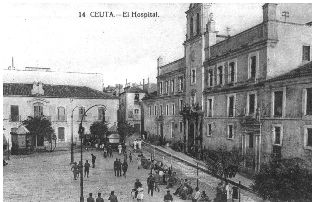
Fig. 2. El hospital real de Ceuta en una postal de principios del siglo XX

No solo no llegaron a fraguarse tales iniciativas, sino que el hospital real continuó su desarrollo institucional con nuevo ímpetu. Tanto es así, que, para definir mejor las actuaciones institucionales, en junio de 1737 se aprueban en Aranjuez, por parte de Casimiro de Ustariz, secretario de Estado y de Guerra, los reglamentos a poner en práctica según el mandato dictado por el rey. Un total de nueve capítulos donde se vislumbra el papel capital desempeñado por la Iglesia y el clero, tanto en la administración de sacramentos como en cuestiones fiduciarias. Por ejemplo, se hace hincapié en el hecho de que los enfermos debían ser confesados en el mismo momento del ingreso en el hospital y antes, incluso, de que fueran examinados por médicos y cirujanos 16 . Según discurriera la enfermedad podrían recibir la comunión por viático a cargo de los capellanes, es decir, los hermanos franciscanos que residían en el convento alledaño. Además, tales frailes serían los encargados de controlar todo lo referente a los legados de aquellos que fallecían dentro del inmueble sanitario. De ahí, que si no poseían testamento los instaban a hacerlo ante el escribano real, actuando al mismo tiempo de apoderados para avisar del deceso a los interventores y administradores a la hora de reunir sus alhajas y distribuirlas conforme a su deseo. En el caso de dejar bienes libres quedarían en poder de los capellanes, a no ser que fueran de mucha