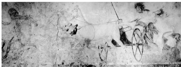
(Fig. 5) Perséfone raptada por Hades, s. IV a.C., Tumba de Vergina