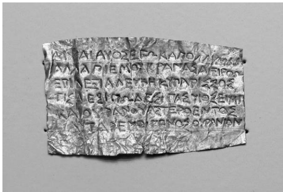
(Fig. 8) Lámina de la necrópolis de Hiponion, en Calabria, ca. 400 a.C.