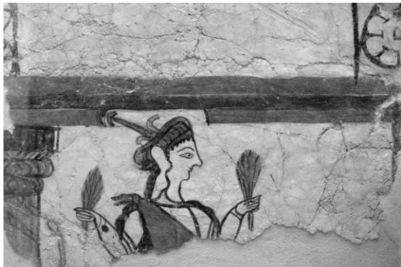
(Fig. 1) Fresco de Micenas, 1250-1180 a. C.