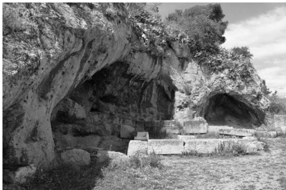
(Fig. 3) Plutonion , Eleusis