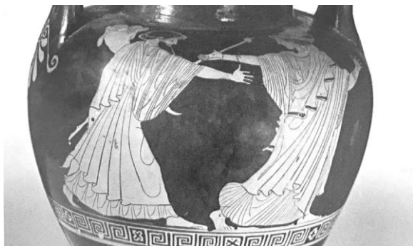
(Fig. 4) Ánfora ática de figuras rojas, ca. 475-425, Museo Arqueológico de Nápoles (H3091)