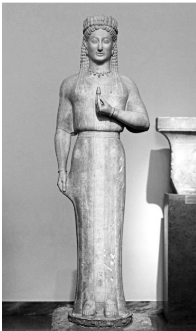
(Fig. 7) Frasiclea, Museo Arqueológico de Atenas n. 4889