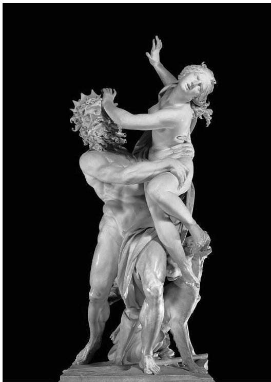
(Fig. 6) Rapto de Propserpina, Bernini