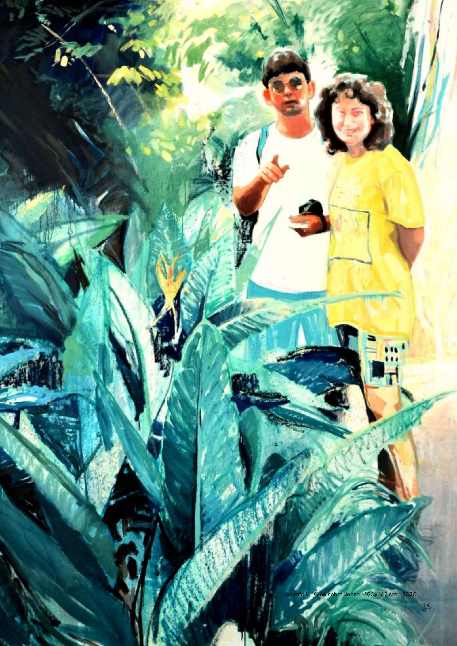
Tenerife II · Óleo sobre lienzo · 190x 162 cm · 2020