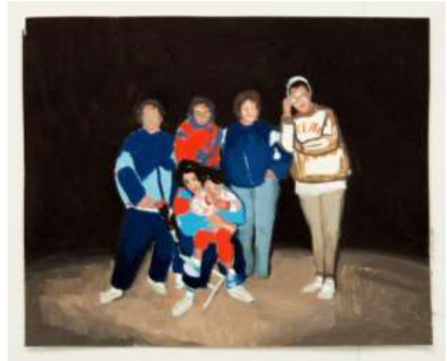
Matalascañas II · Boceto · 2019

Esta pieza fue pensada inicialmente para llevarla al mural pero, al final, decidí hacerla en una tela sobre bastidor. Me surgió la oportunidad de participar en una exposición colectiva con una obra de grandes dimensiones y comprendí que el boceto que tenía hecho de esta imagen era el idóneo para la ocasión. La fotografía original la encontré en un álbum de mi familia y son mi madre, mis tías y mi prima en una noche de pesca en Matalascañas.