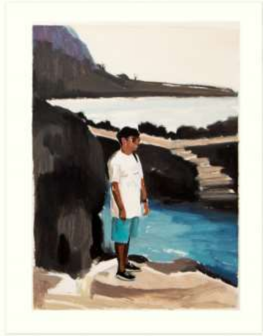
Tenerife III · Óleo sobre papel · 25 x 40 cm · 2020