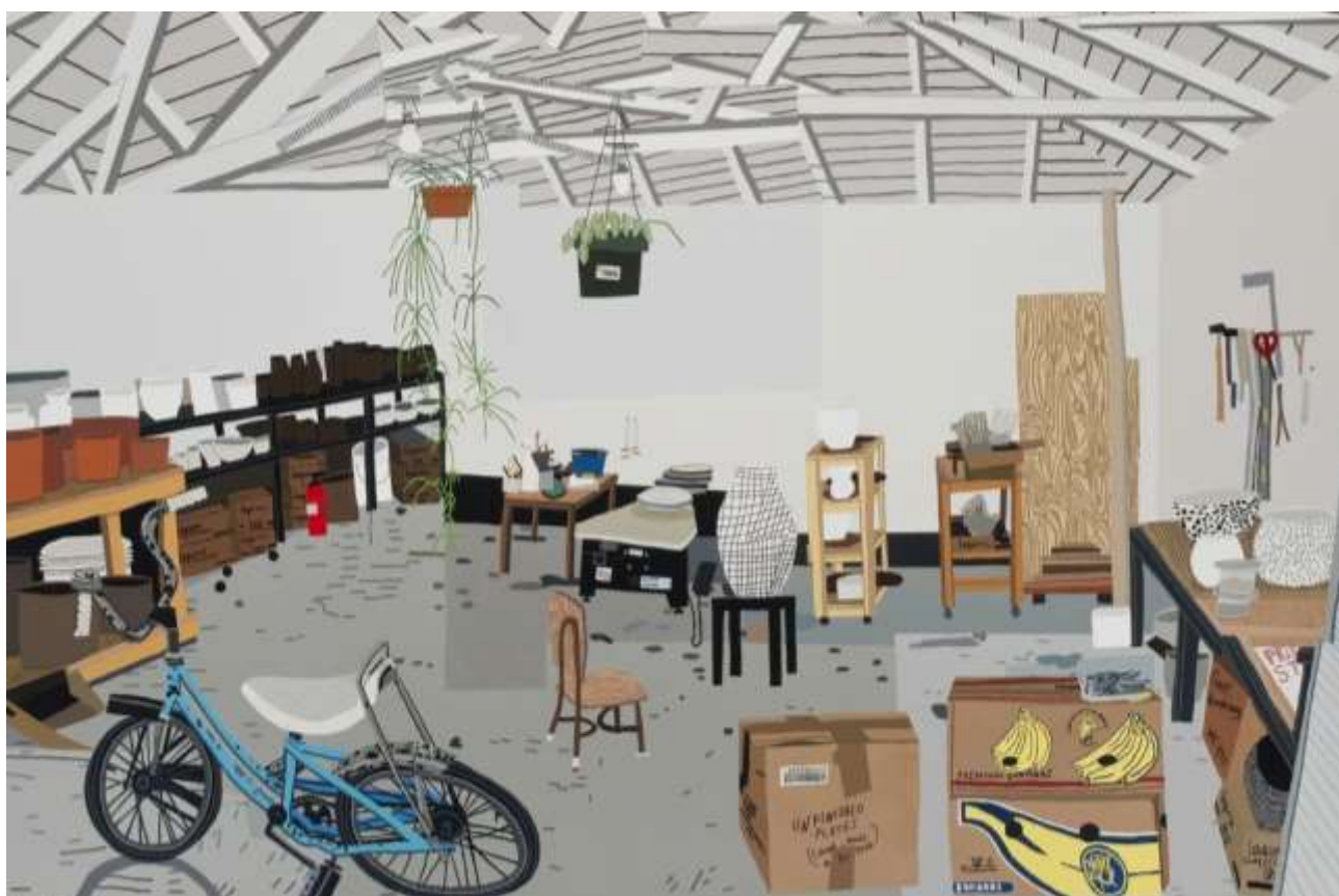
Jonas Wood · Shio's Studio on Palms · 2015

Descubrí la obra de Jonas Wood recientemente, tras su exposición de 2019 en la Gagosian de Nueva York. Su trabajo me enseñó otros enfoques de la figuración; desde entonces estoy probando a jugar con las manchas planas de colores vivos, añadiendo códigos diferentes a mi lenguaje pictórico. Su representación de la cotidianidad y los espacios que habita, impregnándolos de personalidad y vida, me resulta enormemente inspirador. Su tratamiento de la pintura, a veces cercana al diseño o la ilustración, propone formas menos serias de entender el arte contemporáneo.