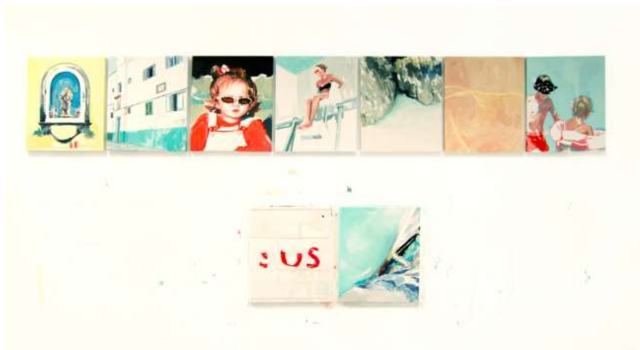
Verano · Óleo sobre lienzo · 41 x 33 cm c/u · 2020