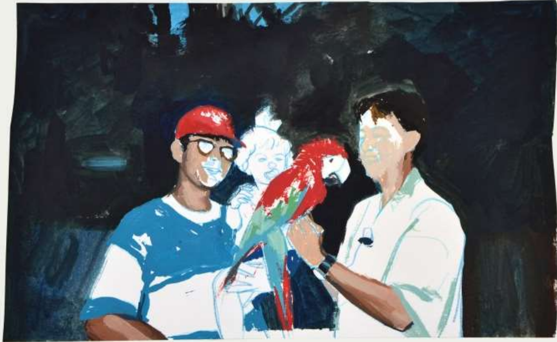
BCN · Óleo y lápices sobre papel · 15 x 25 cm · 2019