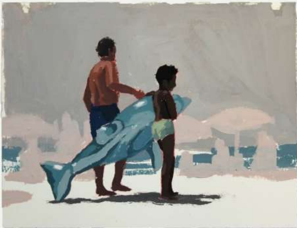
Delfín · Óleo sobre papel · 15 x 20 cm · 2019