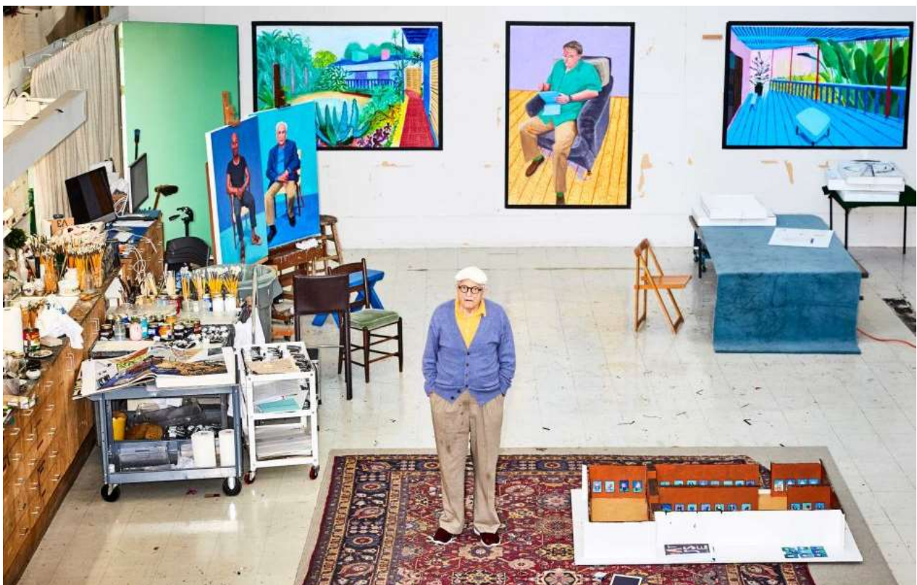
David Hockney en su estudio de Los Ángeles

Como mencioné anteriormente Hockney se convirtió en un gran referente en mi obra desde que descubrí su trabajo. En ese momento, me di cuenta que no todos los artistas tienen por qué tener un gran tema crítico al que dedicar su carrera. Existía un hueco para aquellos que quisieran reflejar algo muy pequeño, muy personal y a la vez muy valioso. Él retoma la figura humana y la expone realizando tareas propias de la clase acomodada californiana como nadar en una piscina, tomar el sol o simplemente posar para el artista. En la década de los años 50 comienza su carrera artística realizando cuadros con colores muy apagados y con una leve influencia cubista, que rápidamente deja atrás creando pinturas de colores muy vivos y planos, respetando siempre un dibujo de cierta simplicidad en las formas.