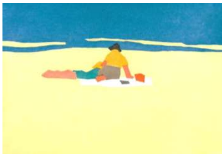
Alex Katz · Figures on beach · 2008