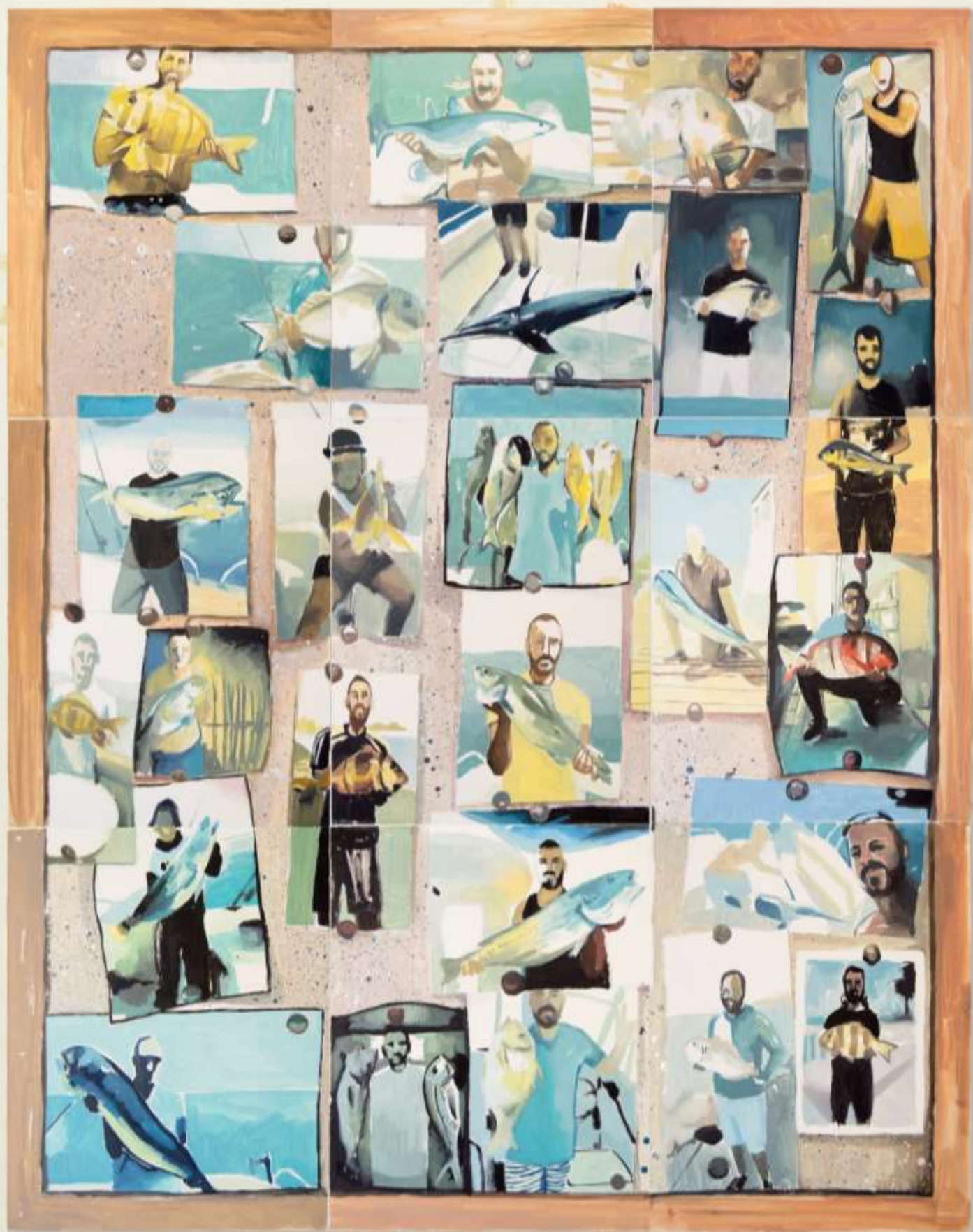
Cádiz · Óleo sobre papel · 123 x 99 cm · 2020