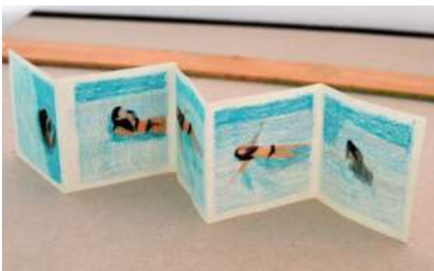
Boceto · Lápices sobre papel · 7 x 35 cm · 2019

Como se puede observar en los siguientes bocetos, esta pieza, inicialmente, iba a ser un libro de artista en forma de acordeón que mostraría una secuencia por cada lado del papel. La idea era mostrarlo abierto. Expuesto en una mesa o una peana y que se pudieran contemplar ambos lados pero finalmente, al llevarlo a cabo, decidí que funcionaba mejor sin darle la forma de acordeón y usando solo un lado del papel.