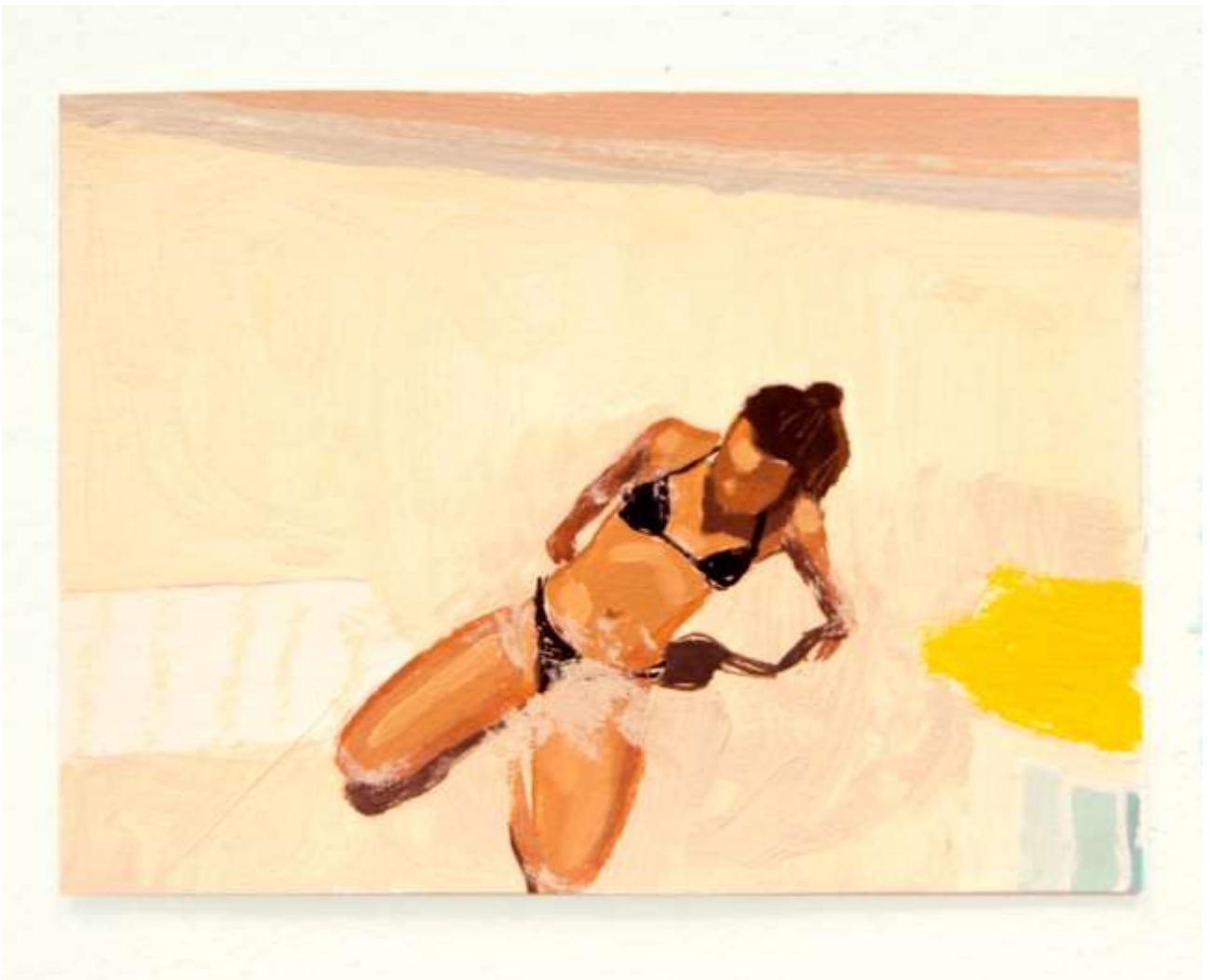
Venga va, sal · Detalle · 2019