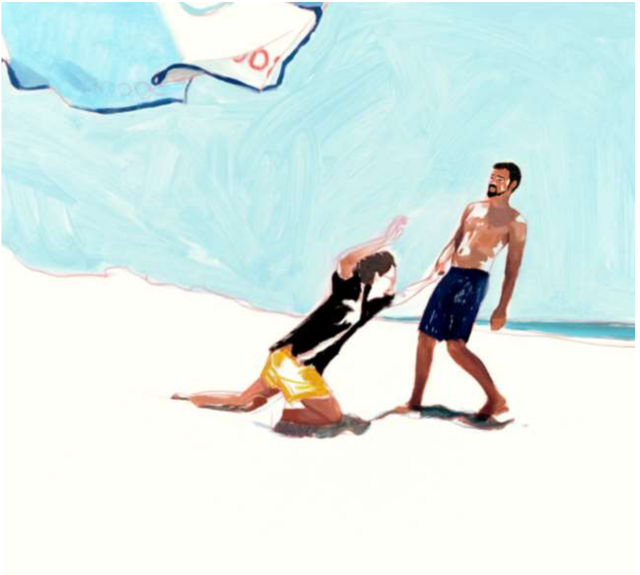
S/T · Detalle · 2020