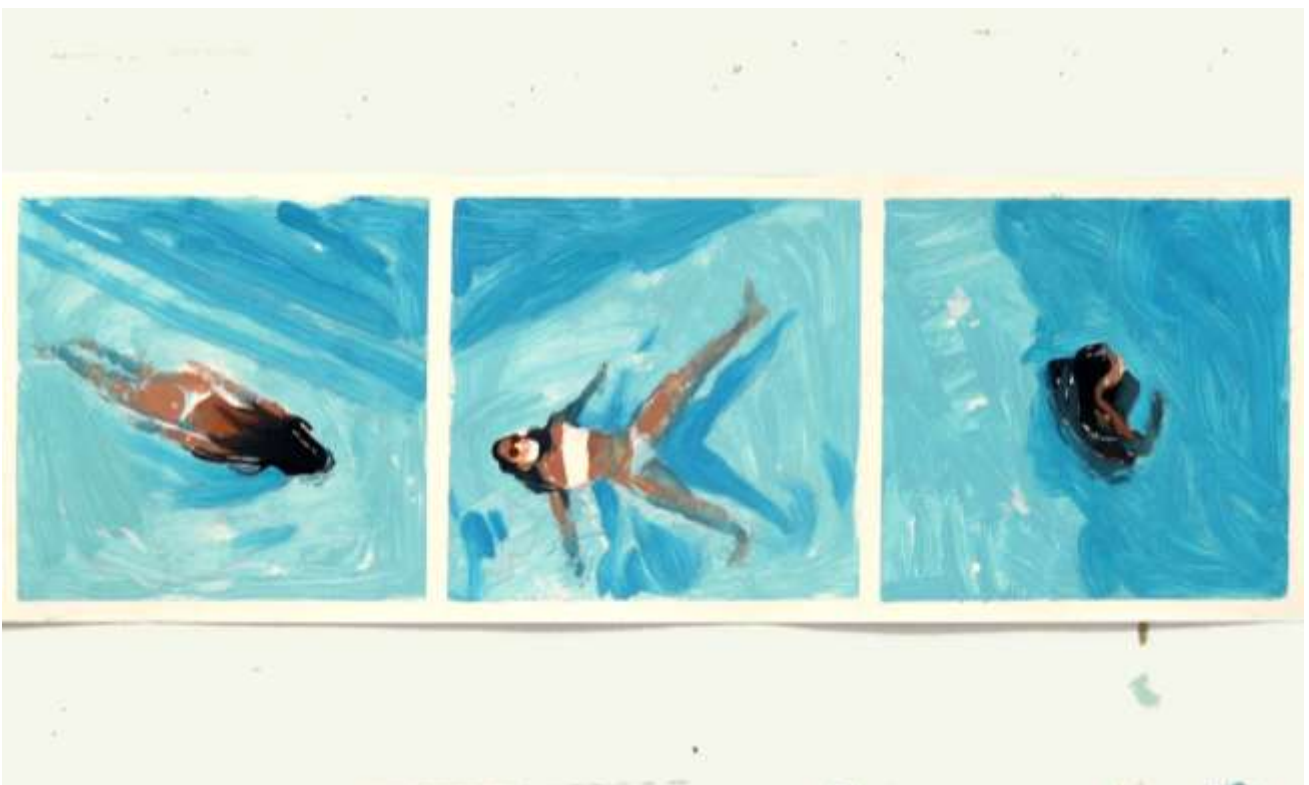
S/T · Detalle · 2019