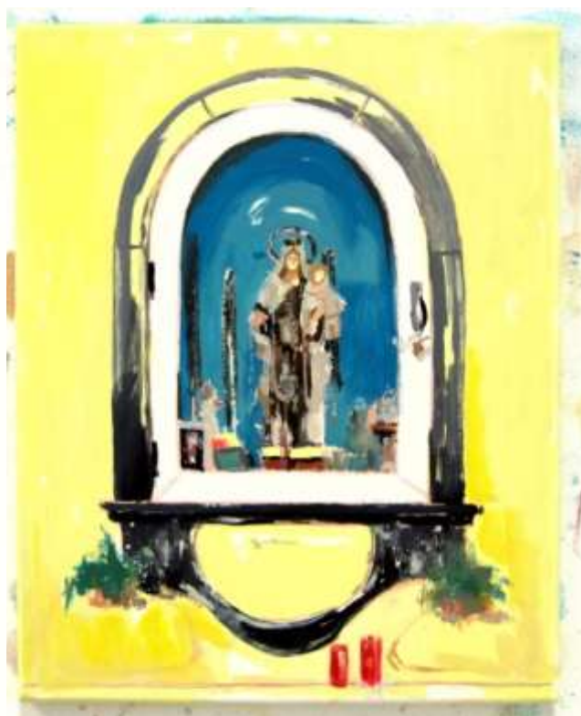
VII · Óleo y lápices sobre lienzo · 41 x 33 cm · 2020