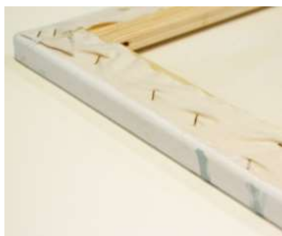
Fotografías del proceso de imprimación y montaje sobre bastidor