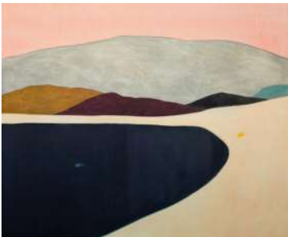
Guim Tió · Swimmer · 2018