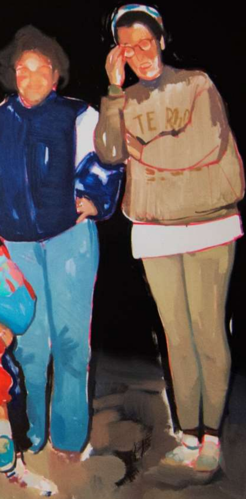
Matalascañas II · Óleo sobre lienzo · 162 x 190 cm · 2020