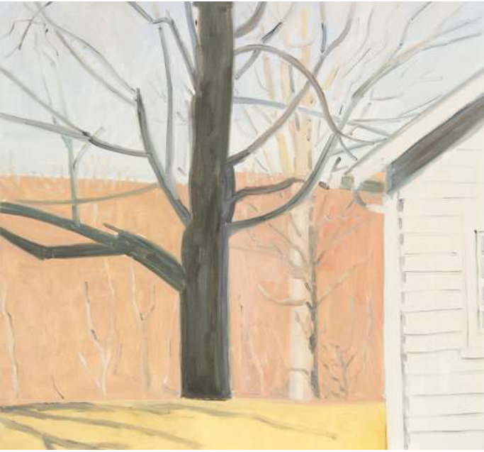
Lois Dodd · Corner of bakery and tree · 2002