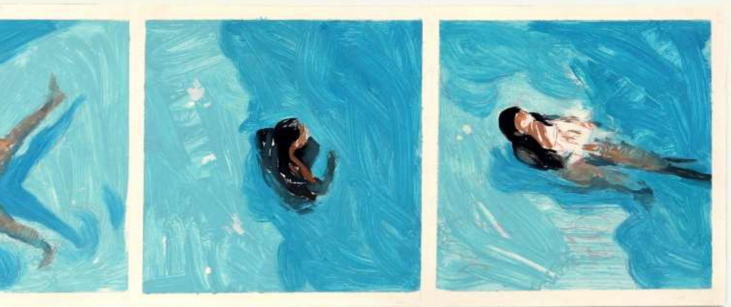
S/T · Óleo y lápices sobre papel · 20 x 100 cm · 2019