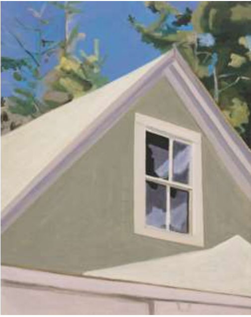
Lois Dodd · Window in peak of garage · 1975