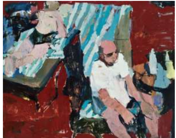
Jennifer Pochinski · Winter sun · 2019