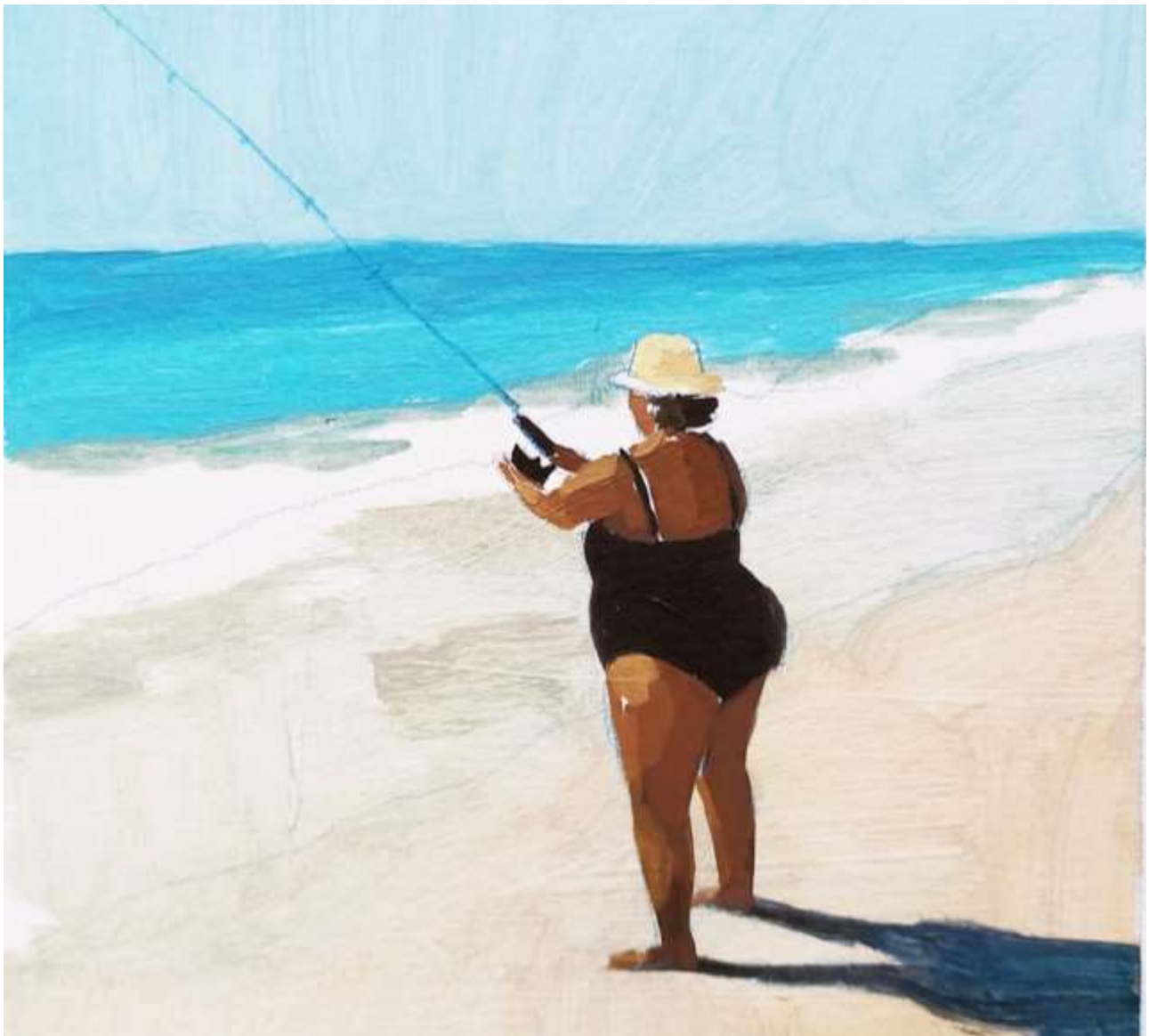
Matalascañas · Detalle · 2020