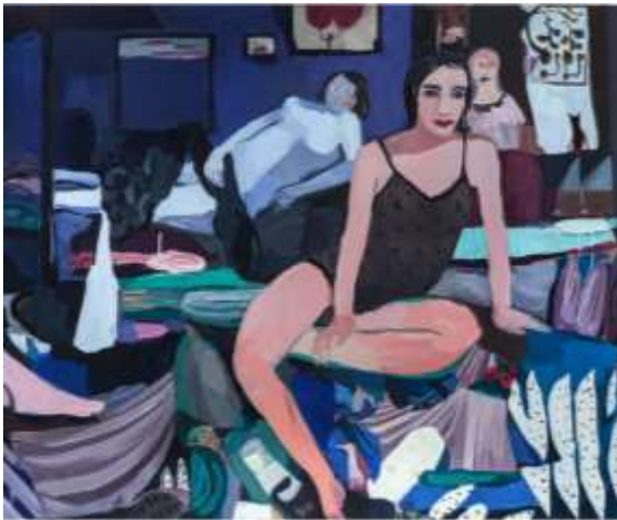
Helen Verhoeven · Libby - feet · 2016

En este apartado me centraré en reflexionar acerca de la obra de distintos artistas plásticos contemporáneos, algunos han alcanzado el éxito en los últimos años y otros son, aún, muy emergentes. En cualquier caso, todos ellos son una gran fuente de inspiración en mi trabajo y crean el entorno artístico idóneo en el que me gustaría situarme. Es bien sabido que en la actualidad no existen corrientes artísticas como tal y cada creador realiza su obra con un estilo personal, sin la necesidad de crear un grupo artístico o colectivo que comparta una misma idea. Por lo tanto, los artistas que mencionaré a continuación comparten el mismo tiempo, pero cada uno tiene su propia manera de entender el arte y la pintura.