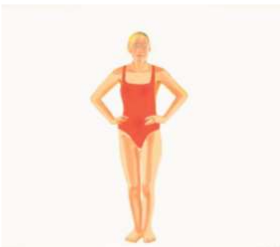
Alex Katz · Swimmer · 1990

Los personajes de Katz son actores que intervienen en dramas mudos dirigidos por él mismo. Unas veces se encaran con nosotros y otras, a lo que parece, se dirigen a nosotros como si quisieran que interviniéramos con ellos en un juego organizado casualmente durante una fiesta o en un grupo pequeño y más íntimo acomodado en los sofás de la sala de estar. 2