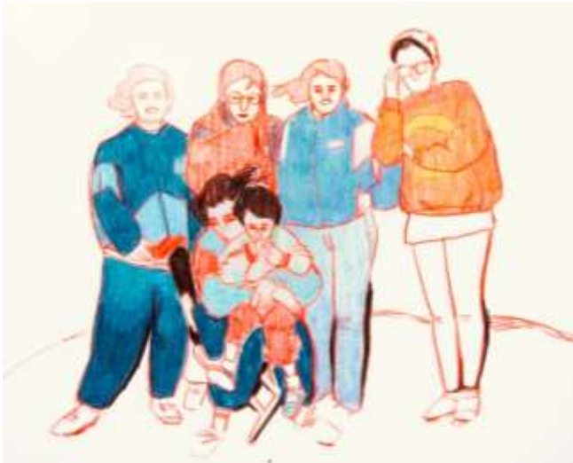
Matalascañas II · Boceto · 2019