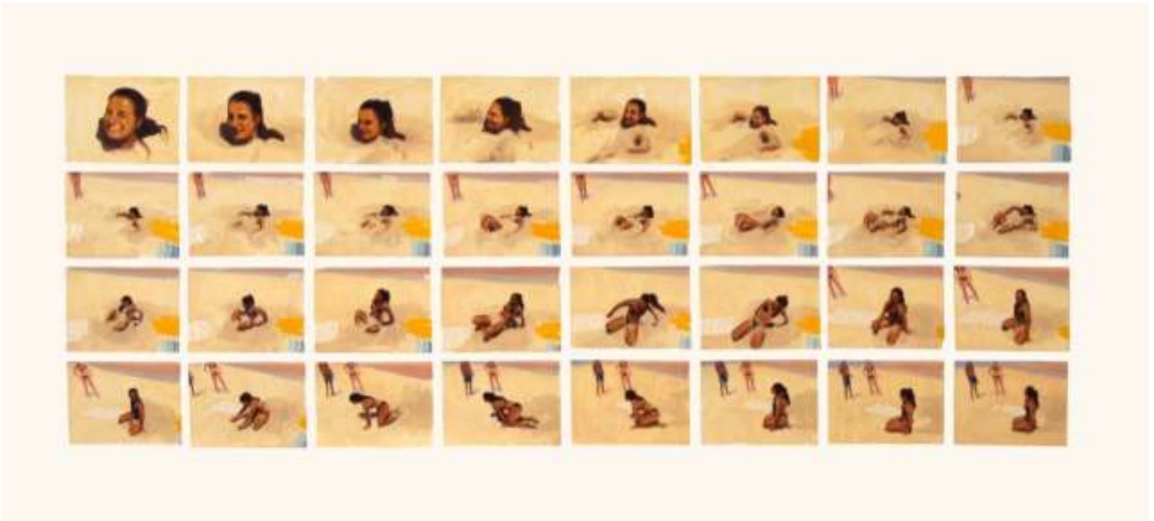
Venga va, sal · Óleo y lápices sobre papel · 52 x 135 cm · 2019