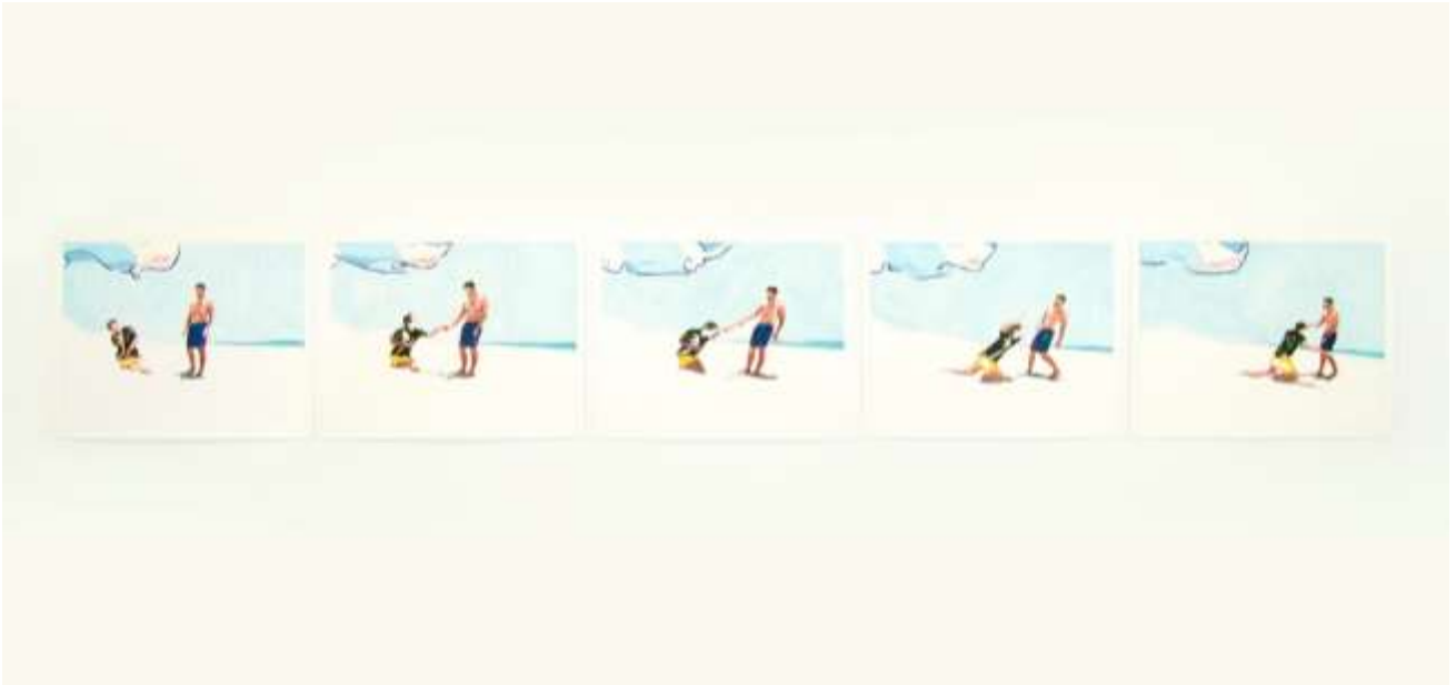
S/T · Óleo y lápices sobre papel · 50 x 300 cm · 2020