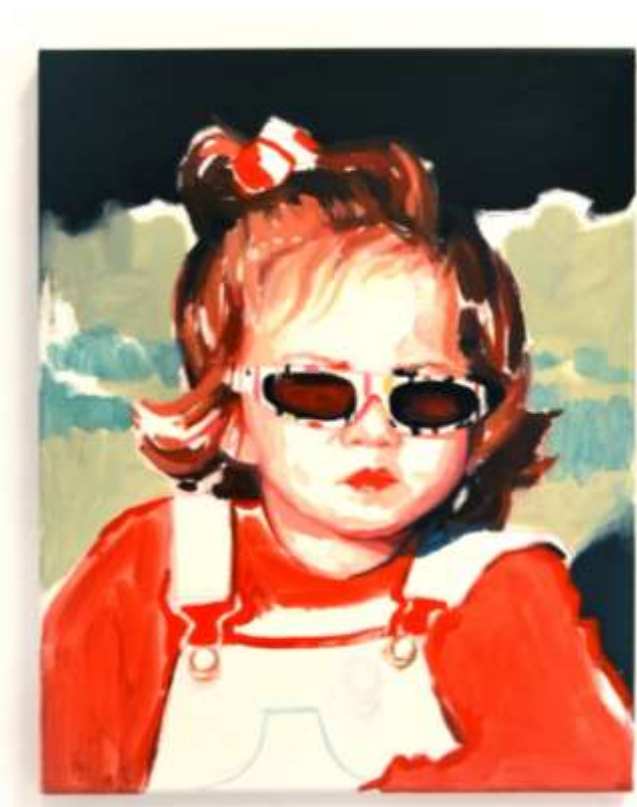
V · Óleo y lápices sobre lienzo · 41 x 33cm · 2020