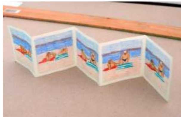
Boceto · Lápices sobre papel · 7 x 35 cm · 2019