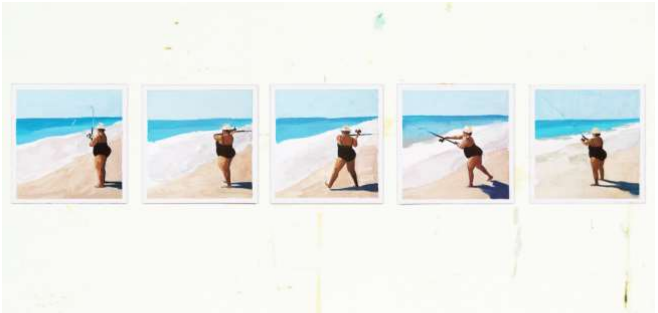
Matalascañas · Óleo y lápices sobre papel · 19 x 95 cm · 2020