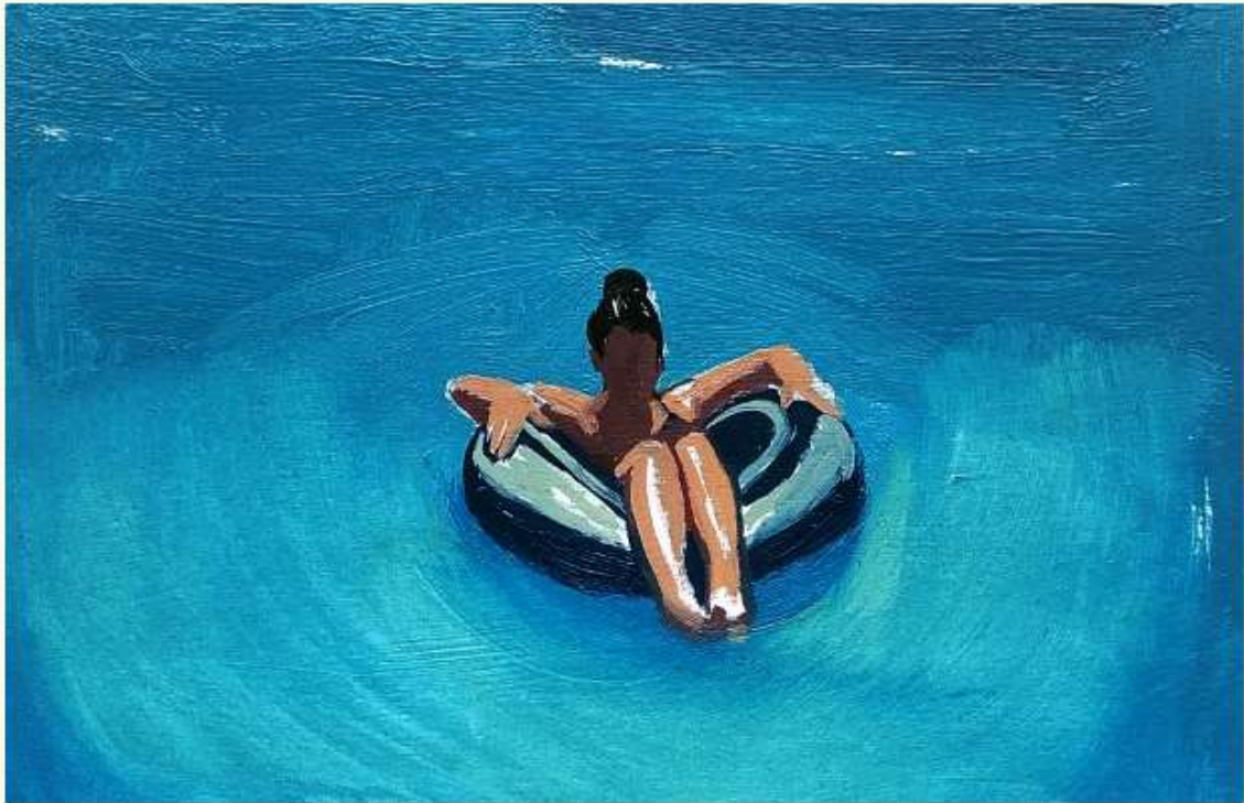
Platja Fonda II · Óleo sobre papel · 15 x 20 cm · 2020