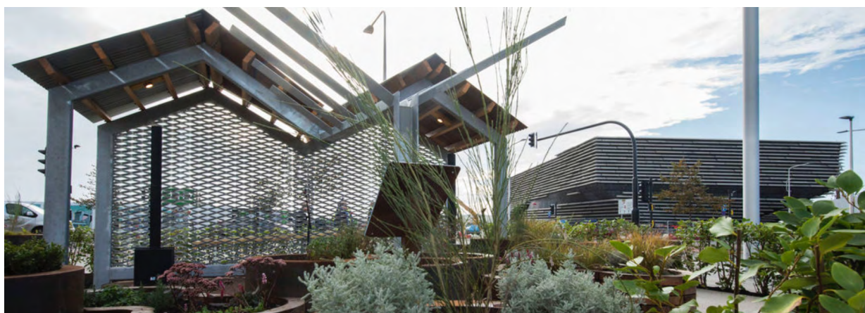
3. The V&A Dundee Community Garden

de un proceso colaborativo de investigación, se han realizado cambios pequeños pero importantes en la narrativa de las galerías, especialmente en lo que respecta al papel de Escocia en la construcción y mantenimiento de la ideología colonial del Imperio Británico y, consecuentemente, el impacto devastador que esto ha tenido en las personas colonizadas de todo el mundo.