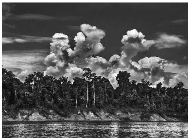
1. Sebastião Salgado, Voces de la Amazonia , 2017. Panorámica del río Ituí, en el Valle del Javari, la segunda mayor reserva indígena de Brasil