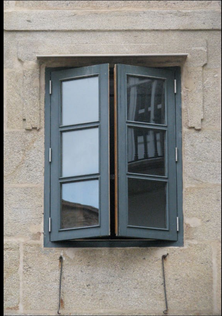
Figura 4.- Fachada de la casa nº 8 de la plaza de San Miguel de Santiago de Compostela, residuo del viejo palacio de Joaquín de Lamas, y una ventana de dicho frente producto de la reforma trazada por Lucas Ferro Caaveiro. Montaje de Roberto Novo Sánchez ( www.novodesenho.net )